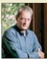
جول أوستر: ترامب لا يقل خطراً عن كورونا