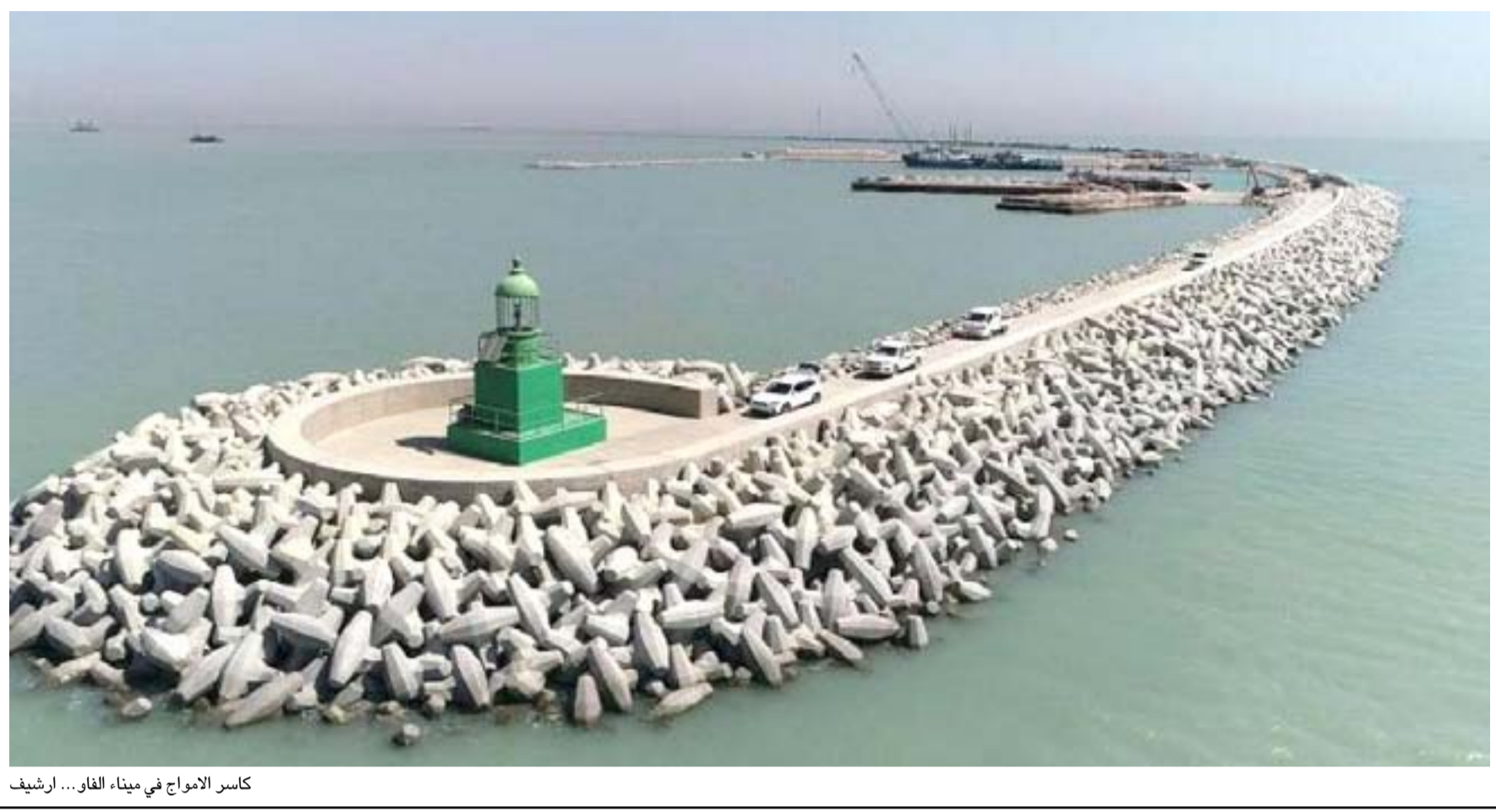
كاسر الأمواج في ميناء الفاو... أرشيف

وقبل هذا الحادث بعدة أسابيع توصلت وزارة النقل إلى اتفاق مع الشركة الكورية لتنفيذ المرحلة الأولى من مشروع ميناء الفاو والمكونة من خمسة مشاريع من ضمنها بناء خمسة أرصفة من أصل ٩٠ رصيفا، وتعميق وكري القناة الشراعية التي تصل الميناء بالبحر، وإنشاء نفق مائي بعرض ٣٠ مترا يربط الميناء بأم قصر، وطريق رابط بين الفاو والبصرة مع ساحات عمل لتفريغ وتحميل الحاويات.