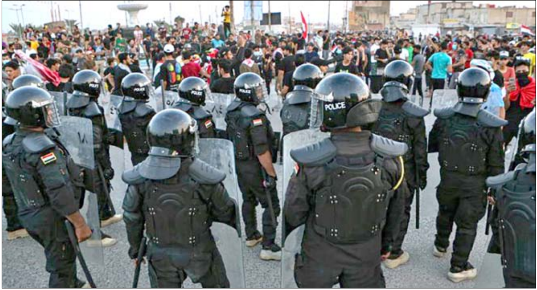
تظاهرة سابقة في محافظة البصرة.. ارشيف