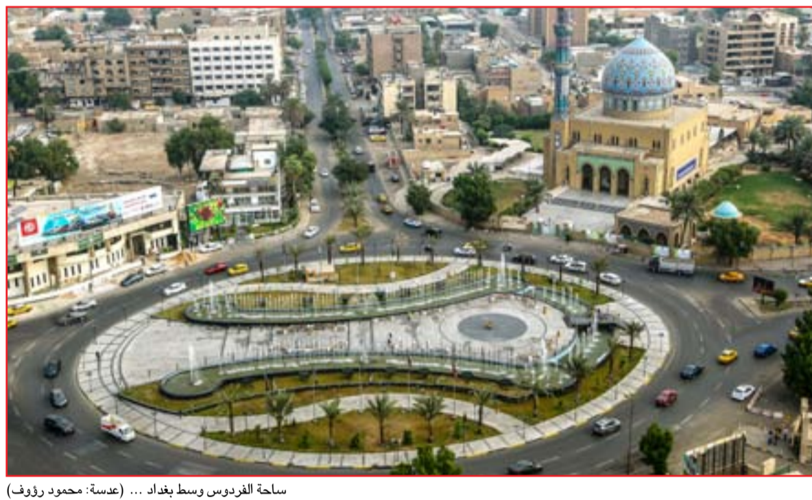
ساحة الفردوس وسط بغداد...