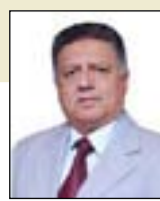
جاسم الصغار يكتب: زيف الديمقراطية الأميركية