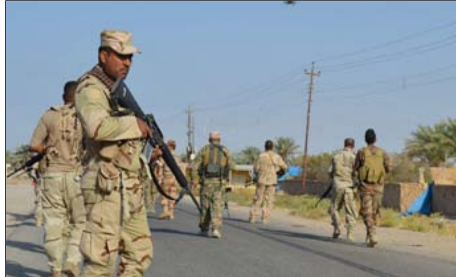
قوة من الجيش خلال عمليات التطهير.. ارشيف

شهد العام ٢٠٢٠ تصعبا كبيرا بعدد الهجمات التي نفذها مسلحو داعش في العراق وسوريا وكذلك شمال افريقيا واسبيا الوسطى وهي المناطق الثلاث التي يكثر فيها نشاط التنظيم. ويذكر انه خلال العشرة ايام الاخيرة من شهر تشرين الاول نفذ تنظيم داعش هجوما على قرية قرب ناحية جلولا باستخدام قذائف هاون وقناصين. وتبنى ايضا المسؤولية عن مقتل اربعة ضباط استخبارات وجرح اثنين آخرين قرب المقدادية فضلا عن ثلاثة آخرين من قوات الحشد عبر نصب نقطة تفتيش وهمية