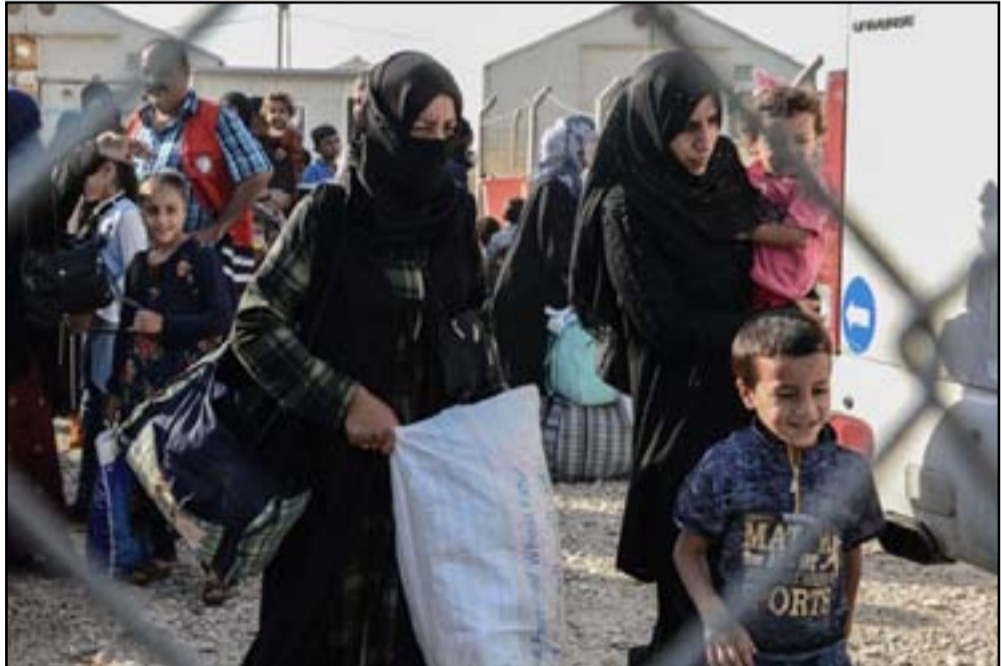
اسر نازحة في احد المخيمات .. ارشيف

جان ايجيلاند، الامين العام للمجلس النرويجي للاجئين، قال أمس الاثنين ان "غلق المخيمات قبل ان يكون سكانها راغبون او قادرين على العودة لبيوتهم لا تقدم شيئا لحل ازمة النازحين. بل على العكس