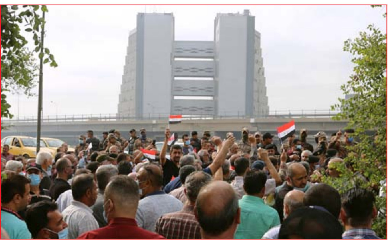
محتجون أمام وزارة المالية أمس..