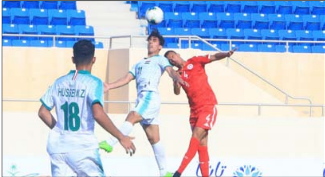
ليوث الرافدين يدشنون معسكرهم في الدوحة

وأضاف: سنعمل على الزج بهؤلاء اللاعبين المغتربين الثلاثة خلال المباراتين الوديتين الترتين سيلعبهم منتخب شباب قطر لكرة القدم على ملعب رقم 5 بأكاديمية (أسباير) في الساعة السادسة مساءً بعد غد الخميس الموافق الثاني عشر من شهر تشرين الثاني الجاري، ويوم الأحد المقبل المصادف الخامس عشر من أجل التعرف على مستوياتهم الحقيقية ومعرفة مدى