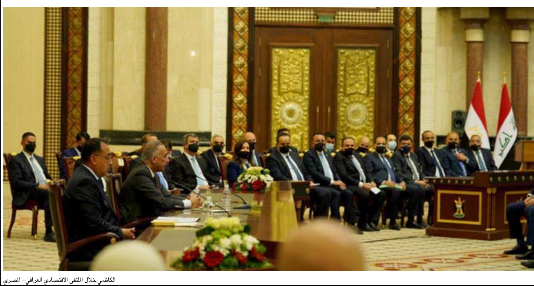
الكاظمي خلال الملتقى الاقتصادي العراقي- المصري

ويضيف النوري في تصريح لـ(المدى) أن "مد هذا الأنبوب فيه الكثير من المشاكل كونه يحتاج إلى أموال طائلة وكبيرة على العكس من الاتفاقية الصينية التي لا تتطلب الاموال"، معتبرا أن "تحول العمالة المصرية إلى العراق في ظل وجود البطالة امر غير صحيح".