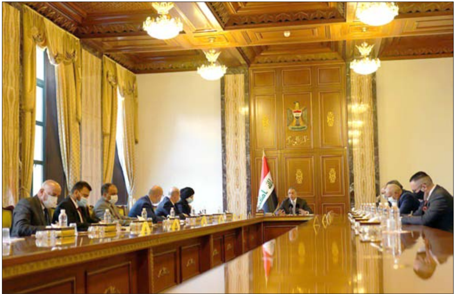
الكاظمي خلال اجتماعه بأعضاء مفوضية الانتخابات.. أمس