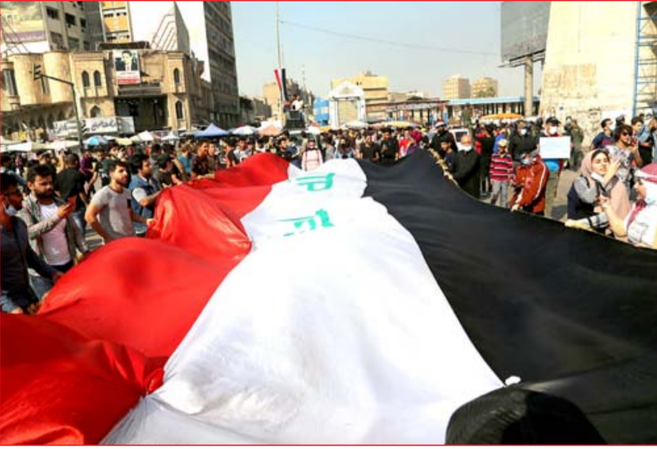
مسيرة لاتحاد طلبة بغداد يوم أمس في ساحة التحرير... عدسة: محمود رؤوف

وكانت آخر موجة اشتباكات بين عدد من القبائل في المدينة، قد بدأت الأسبوع الماضي، وتسببت باقالة مدير الناحية بالوكالة على أثر خلافات على المنصب. واعلنت مستشارية الأمن القومي، يوم السبت، وصول رئيس جهاز الامن القومي قاسم الاعرجي إلى محافظة ديالى، على رأس وفد أمني لإطلاع على سير العملية الأمنية في المحافظة.