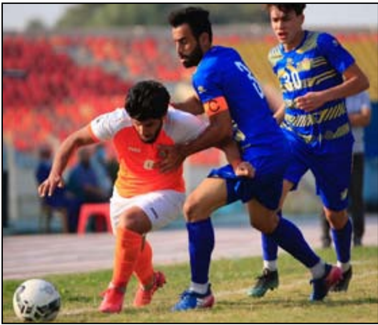
لقاء محمود للحدود أمام بابل

يلتقي فريق بابل لكرة القدم في الساعة الثانية ظهر اليوم الأثنين مع ضيفه فريق الحدود لكرة القدم على ملعب الكفل الأولمبي في محافظة بابل في افتتاح منافسات الدور 32 من بطولة كأس العراق لكرة القدم بالموسم 2020-2021 الذي يشارك فيه 32 فريقاً من العاصمة بغداد والمحافظات في لقاء شبه محسوم لصالح الأخير من أجل الانتقال الى الدور ثمن النهائي بحكم فارق الإمكانات بينهما الى جانب أن الأول يفقد كثيراً الهم أوراؤه الراجعة التي يعتمد عليها بعد قرار