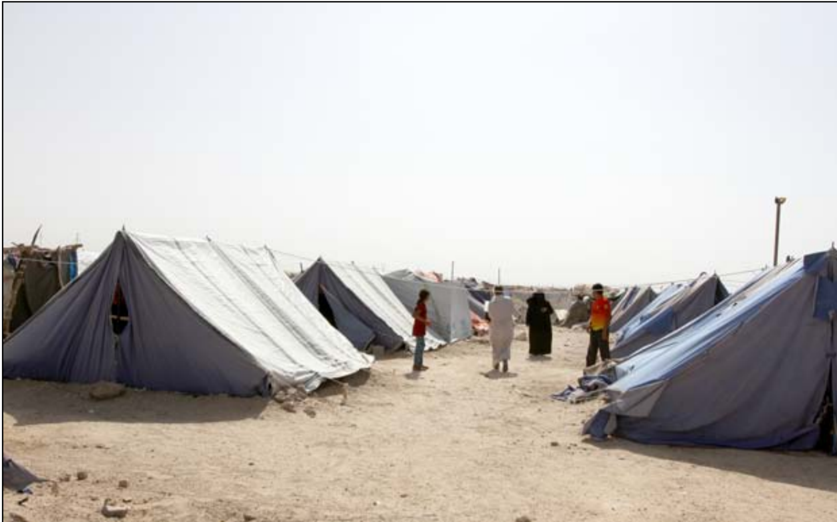
الحكومة اخذت 11 مخيماً للنازحين أسس الاثنيين..

ابو علي يؤكد جازما انه غير راغب بالعودة في ظل الظروف الحالية التي تعيشها مناطقهم حتى بعد تحريرها لهشاشة الوضع الأمني بحسب ما يصله من الأخبار فليده تواصل مع اصدقاء عادوا الى مسكنهم الا انها مهمة بالكامل نتيجة معارك التحرير وحاجتهم الى أموال كثيرة لإعادتها وانعدام فرص العمل،