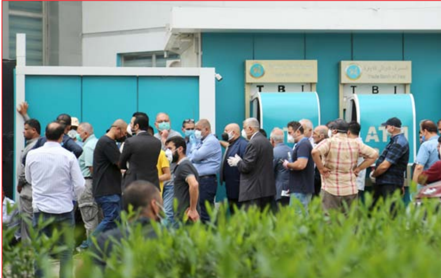
موظفون امام أحد المصارف لاستلام رواتبهم ..