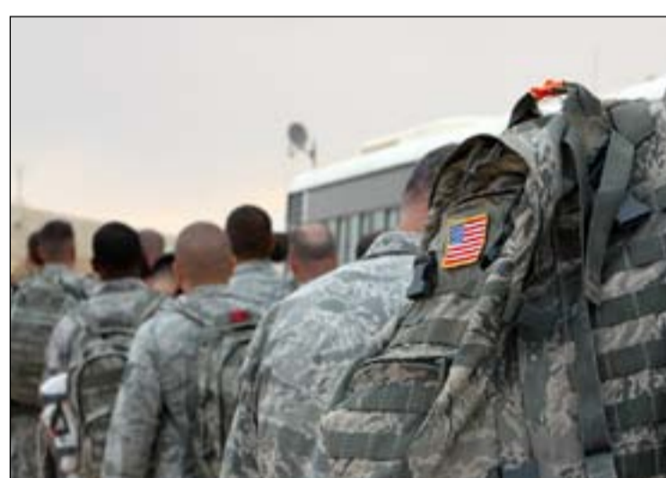
قوات أميركية في العراق... أرشيف

لم تكن رغبة بذلك. وكشف المسؤول السابق في البنتاغون أن "الوزير الجديد بالوكالة، ميلر، قد تلقى تحذيرات من زعيم الأغلبية الجمهورية في البرلمان السيناتور، ميتش ماكونيل، ورئيس لجنة الخدمات العسكرية في البرلمان السيناتور، جيم إنهوف، من أنه ستكون هناك معارضة لفكرة انسحابات لم تدرس بشكل جيد". وأضاف المسؤول السابق "يبدو أن ميلر متناغم مع فكرة الانسحاب مجرد لتحقيق رغبة ترامب فقط".