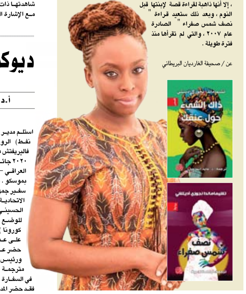
عن /صحيفة الغارديان البريطانية