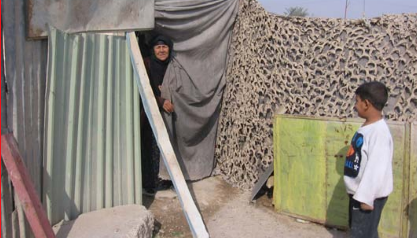
معالجة "العشوائيات" في بغداد بيد مجلس النواب! (تفاصيل ص٤) .. عسدة: محمود رؤوف