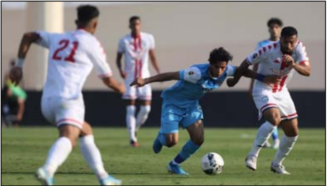
نقط الوسط يسعى لتجاوز أربيل في مسابقة الكأس

وسيشهد فريق نبط البصرة الرحال إلى العاصمة بغداد لمواجهة فريق شهربان من محافظة ديالى على ملعب نادي التاجي الرياضي، فيما سيكون ملعب الكفل الأومبي في محافظة بابل مسرحاً لفريقي الجماهير من محافظة كربلاء المقدسة والبنّاء من محافظة البصرة في الساعة السادسة مساء اليوم الأربعاء في ختام الدور 32 من النسخة الحالية من بطولة كأس العراق لكرة القدم .