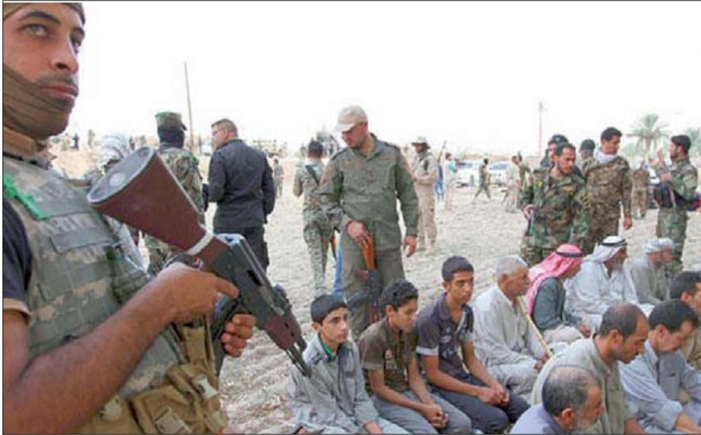
سكان جرف الصخر أثناء خروجهم من المدينة عام ٢٠١٤.. ارشيف

وشهدت الناحية ذات الطابع الزراعي، معارك طاحنة استمرت لعدة أشهر ضد داعش، كان للحشد الشعبي النقل الاكبر فيها، وهو لا يزال المسيطر على الارض. وأعلن رئيس الوزراء السابق حيدر العبادي، في تشرين الاول عام ٢٠١٤، تحرير المدينة التي تقع على بعد ٦٠ كم من جنوب غرب بغداد.