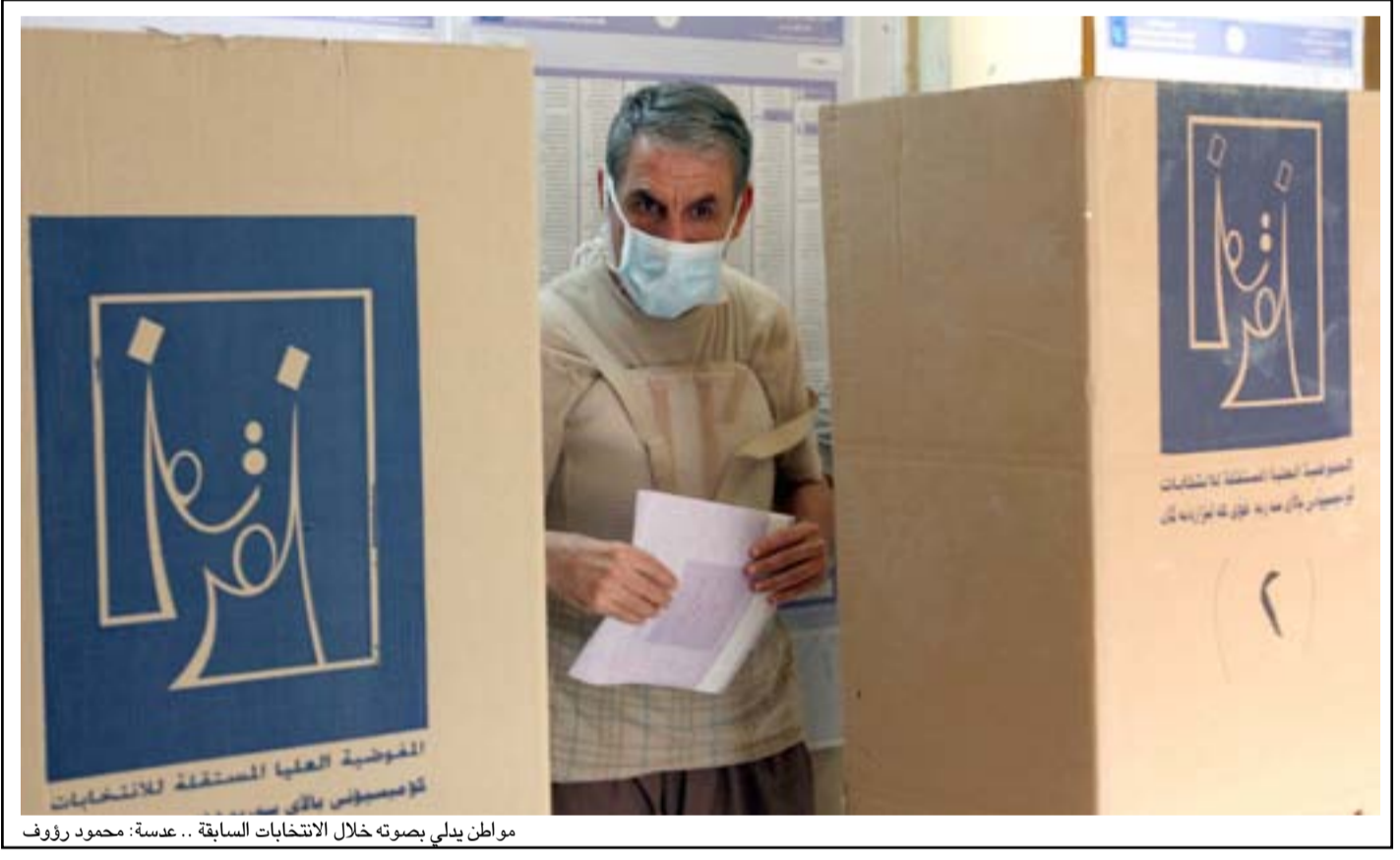
مواطن يدلي بصوته خلال الانتخابات السابقة..

مصدر في رئاسة الجمهورية علق على الاجتماع قائلاً: إنه ناقش مواضيع عدة، منها ما يتعلق بالجوانب الفنية التي تحتاجها مفوضية الانتخابات، وإمكانية تأجيل الاقتراع إلى أربعة أشهر أو أقل من ذلك. ويبين المصدر الذي طلب عدم ذكر اسمه لـ(المدى) أن هناك الكثير من المشكلات الفنية التي تعرقل إجراء الانتخابات البرلمانية المبكرة في مواعيد المحدد، منها تعدد الدوائر الانتخابية، واعتماد البطاقة البايومترية وكذلك توفير الأموال اللازمة، مبيناً أن الرئاسات تركت القرار بشأن موعد الانتخابات، بيد المفوضية وقدرتها على إنجاز كل الجوانب الفنية المتعلقة بالاقتراع. ويتوقع المصدر أن تؤجل الانتخابات البرلمانية المقرر إجراؤها في حزيران المقبل، إلى ما بعد هذا الموعد بـشهرين أو أربعة أشهر، معتقداً بأن الظروف الحالية