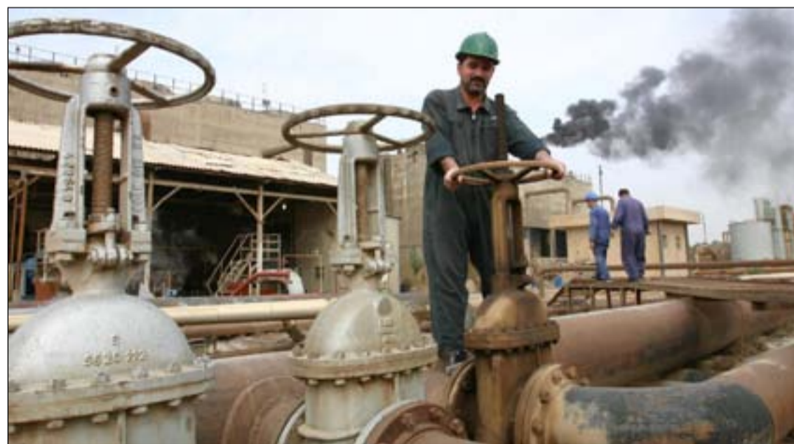
عمال في إحدى حقول النفط

حتى الى ١٢ مليون برميل، لو لم يكن الامر متعلقاً بعوائق الاستثمار ومعوقات البنى التحتية الملازمة الناجمة عن الفساد المستشري في البلاد، مشيراً الى ان قدرة العراق للوصول الى هدفه المرسوم بانتاج ٧ مليون برميل باليوم تبدو ايضا بعيدة عن التحقيق وفقاً للظروف الحالية. ما يتعلق بحقل الرميلا الذي تديره شركة برتش بترولوم BP البريطانية، والذي يشكل انتاجه مجتمعاً مع حقل كركوك نسبة ٨٠٪ من معدل انتاج العراق الكلي للنفط الى الآن، فان الشركة تجري حالياً مباحثات مع وزارة النفط العراقية حول خطط لرفع الانتاج الى ٢,١ مليون برميل باليوم عن معدل الانتاج الحالي للحقل والبالغ ١,٤ مليون برميل باليوم، ومع الأخذ بنظر