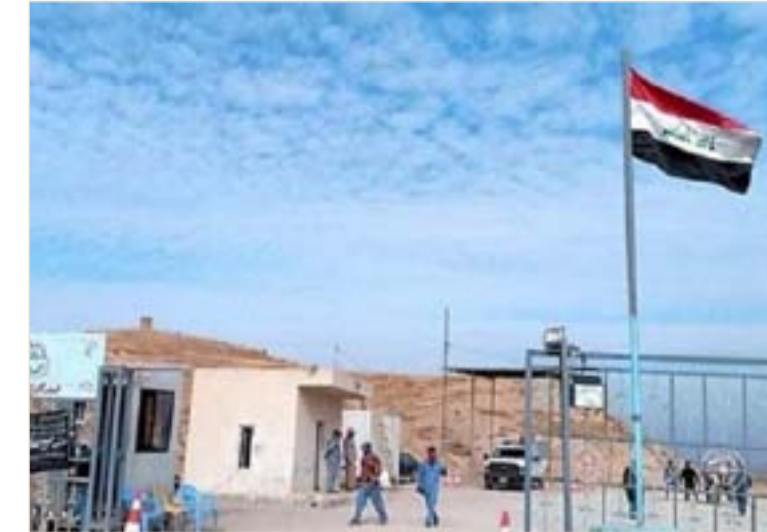
منفذ مندلي الحدودي

وأضاف: الآن جاء دور المعابر غير الرسمية، وهذا الأمر يمكن أن يتسبب في احتكاك وقد يصل إلى احتكاك أمني في الداخل مع الجماعات التي تستخدم تلك المعابر. وأكد الخبير أن السيطرة على الحدود هي خطوة مهمة جدا لتأمين الجبهة الداخلية، عندما تكون الحدود غير خاضعة لسيطرة الدولة سوف تكون هناك العديد من القضايا التي تؤثر على الأمن القومي وعلى مستويات أخرى، لأن تلك المعابر تستخدم في تهريب البضائع والقضايا الأخرى المتنوعة التي تؤثر على الداخل.