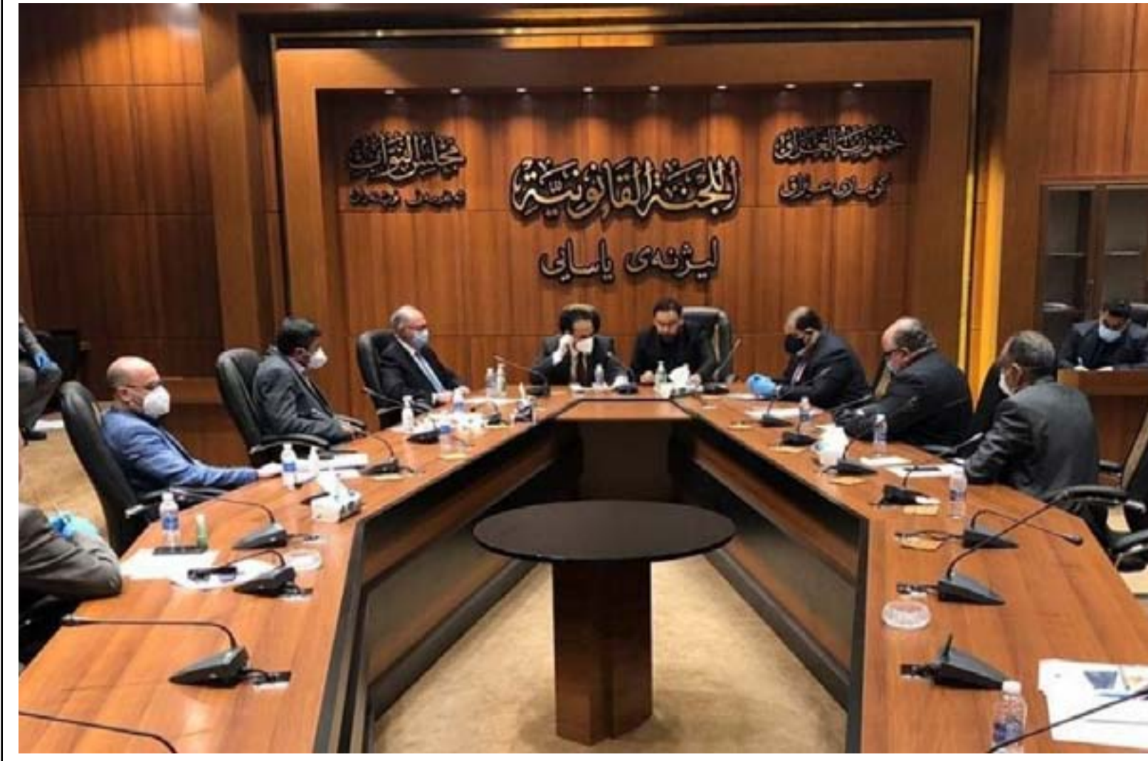
اجتماع برلماني بحضور وزير المالية... أرشيف