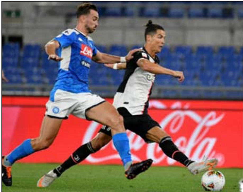
ملعب مابي يحتضن مباراة السوبر بين يوفنتوس ونابولي

الجدير بالذكر إن فريق لاتسيو توج بطلا لكأس السوبر الإيطالي 2019 بعد فوزه على فريق يوفنتوس بنتيجة (3-1) في المباراة التي جرت يوم الثاني والعشرين من شهر كانون الأول الماضي على ملعب (جامعة الملك سعود) في العاصمة السعودية الرياض، في حين فاز فريق يوفنتوس بلقب كأس السوبر الإيطالي 2018 إثر انتصاره الثمين على فريق ميلان بهدف نظيف حمل توقيع البرتغالي كريستيانو رونالدو في المباراة التي أقيمت على ملعب (الجوهرة المشعة) بمدينة جدة السعودية يوم التاسع عشر من كانون الثاني 2019.