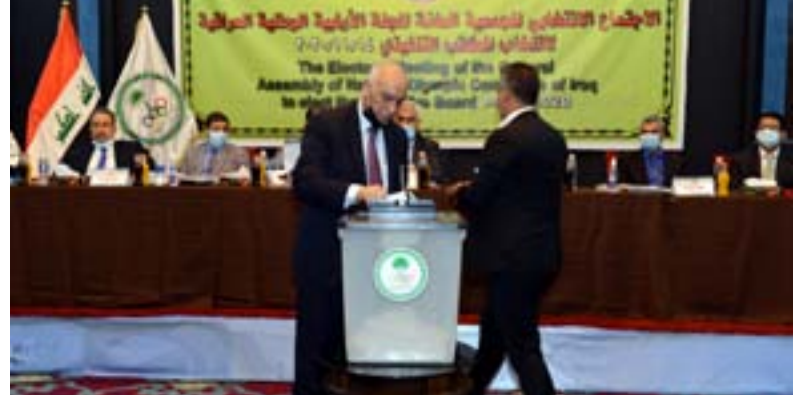
جمعية حقوق الرياضيين تدعو الى حل أزمة الأولمبية