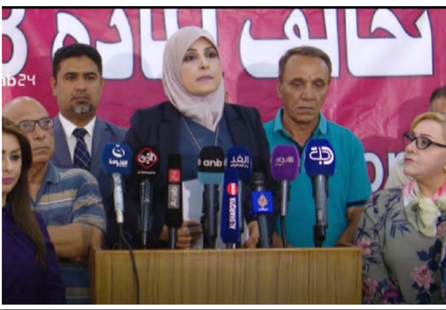
تخالف المادة ٢٨ يرفض قانون جرائم المعلوماتية خلال مؤتمر صحفي.. أرشيف

يحاول مجلس النواب المضي بتشريخ قانون جرائم المعلوماتية رغم الاعتراضات الكثيرة التي صدرت من المنظمات المعنية بحقوق الانسان والناشطين. وأدخل البرلمان تعديلات على التشريع تتضمن تغيير اسمه واستحدثت مركزاً وطنياً تكون مهامه أشبه بعمل الأدلة الجنائية المقتصرة على توفير الأدلة والإثباتات ضد الجهات والشخصيات المتهمه بالجرائم الالكترونية ملاحقتهم قانونياً.