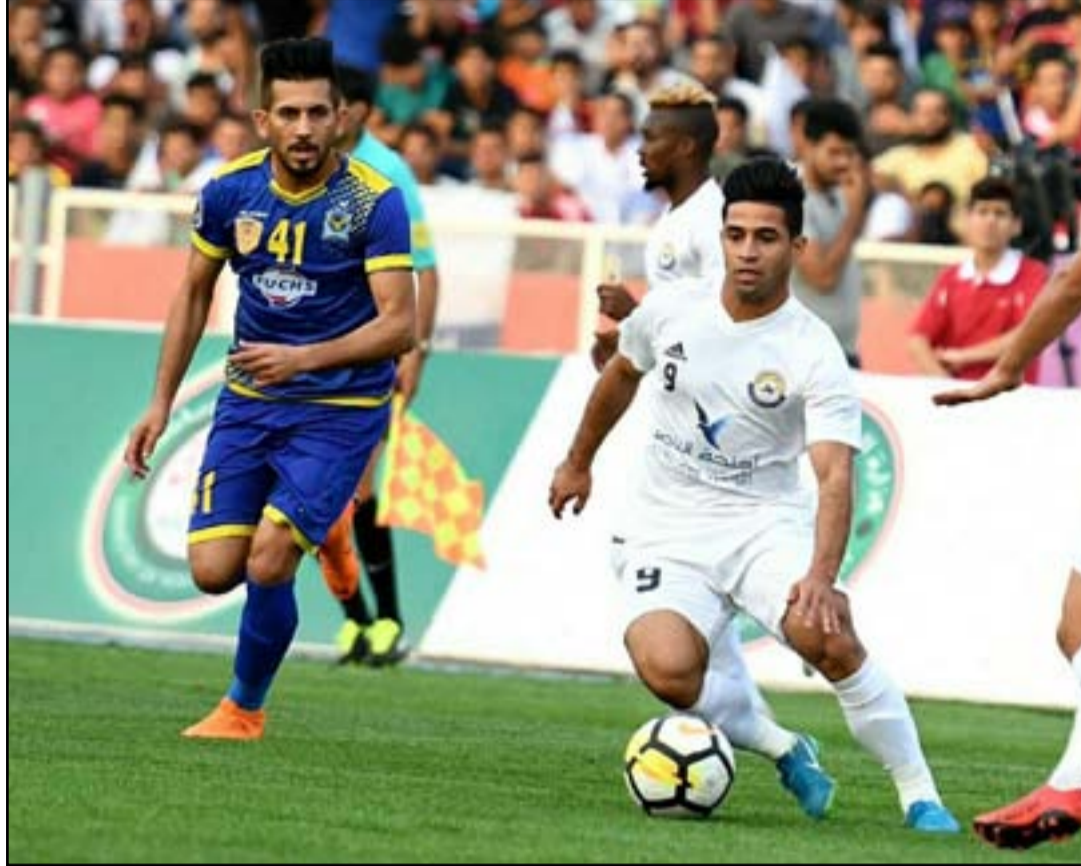
كلاسيكو الدوري العراقي يفقد جمهوره للمرة الأولى