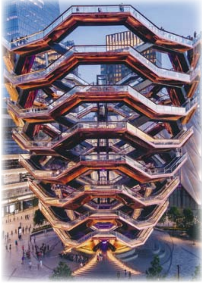
أدراج هدسون "الوعاء"، ٢٠١٩، مانهاتن/نيويورك، المصمم: استديو هيدزويك، منظر عام.