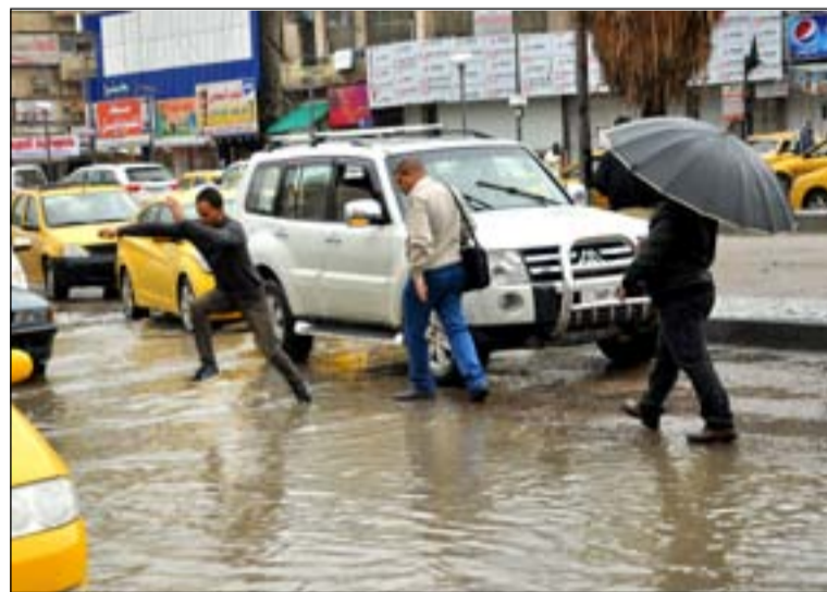
شارع السعدون خلال المطر

يكون بإعادة الخيارات للمواقع التخفيفية بالنسبة للدوائر البلدية، لكي نكون أمام نتائج إيجابية على المستوى القريب وعدم تكرار ما حصل أمس الأول". ودعا إلى "استبدال مدراء لمديريات مجاري متواجدين في مواقعهم منذ أكثر من خمس سنوات، رغم أنهم لم يقدموا شيئاً، والفرق يتكرر في مناطقهم مع كل موسم، وهذه مسؤولية ملقاة على عاتق أمين بغداد