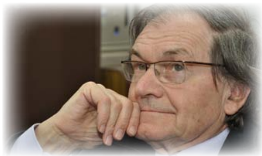
السير روجر بنروز