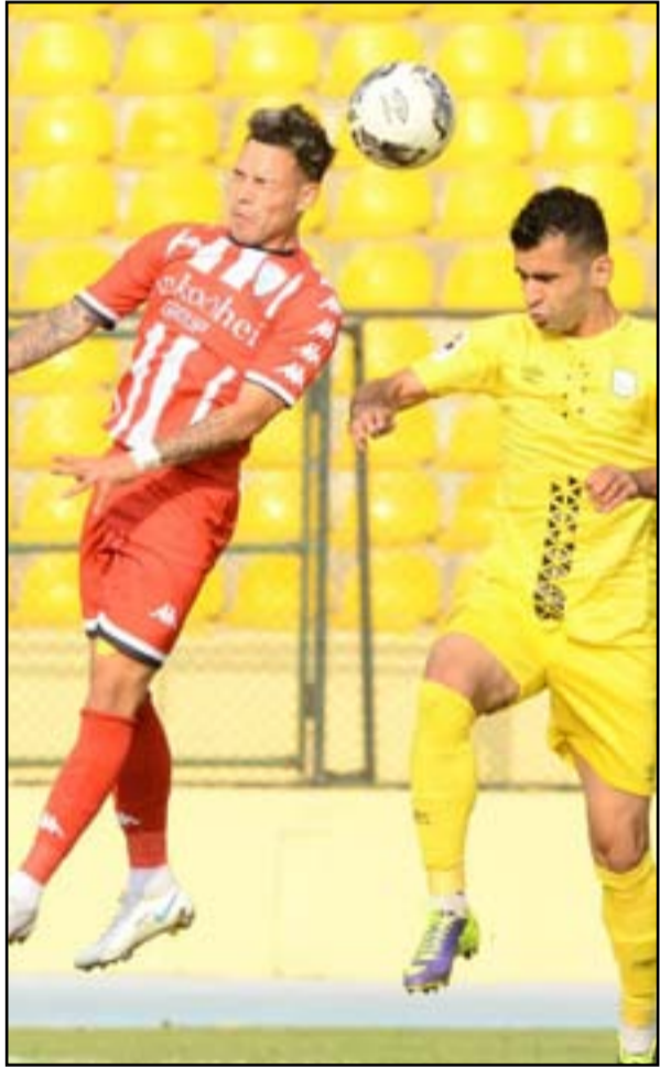
الديوانية يعود الملعب القديم في مباراة الشرطة