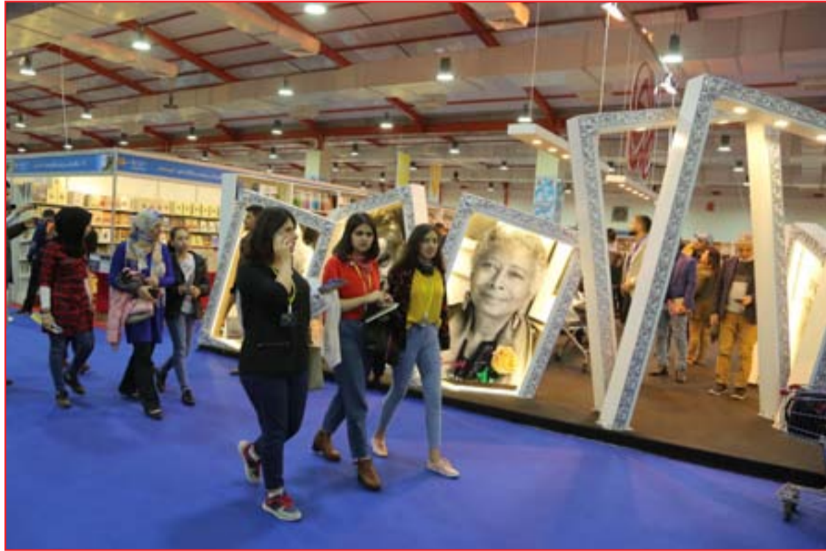
جانب من معرض أربيل الدولي للكتاب... أرشيف