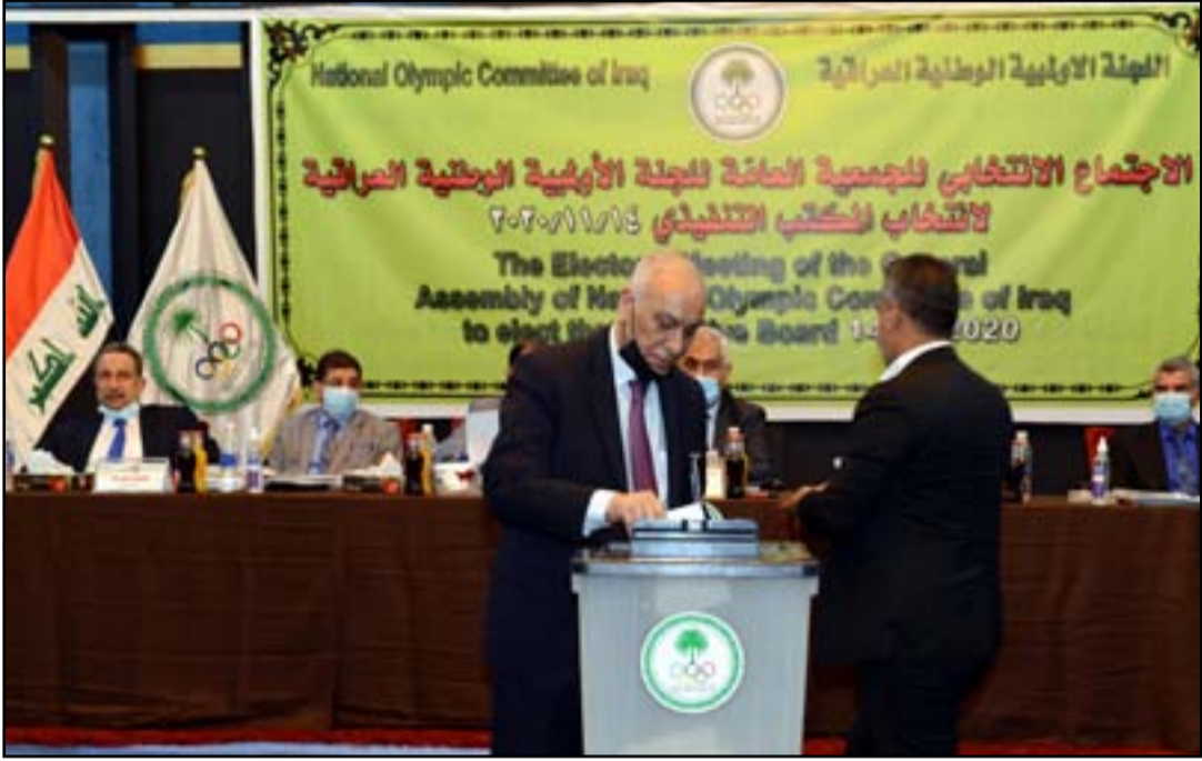
عقوبات دولية وشيكة على الرياضة العراقية