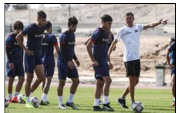
العراق يشارك في بطولة كأس العرب 2021

يوماً، متطعاً إلى متابعة نخبة من أفضل منتخبات المنطقة في المنافسة على الفوز بلقب البطولة. وأشار إيفانتينو إلى أن كأس العرب ستجمع تحت رايتها أكثر من 450 مليون عربي من أنحاء المنطقة، معرباً عن ثقته في أن البطولة الجديدة ستعزز الحماس لدى الجمهور حول النسخة الأولى من المونديال الكروي في العالم وأعرب عن سعادته بتأكيد هذا العدد الكبير من المنتخبات مشاركته في المسابقة التي ستقام مبارياتها في غالبية ملاعب المونديال خلال الفترة من الأول ولغاية الثامن عشر من كانون الأول 2021 وبطولة كأس العالم FIFA قطر 2022، وتقام منافساتها في نفس