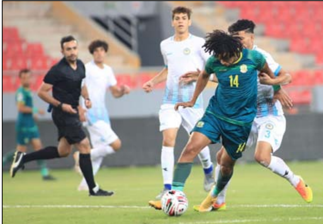
الشرطة يفقد الصدارة من بوابة الديوانية

ويخاض الشرطة لكرة القدم ثالث الترتيب برصيد 8 نقاط إلى مدينة الديوانية لملاقاة الديوانية الرابع عشر برصيد 4 نقاط على ملعب الإدارة المحلية في المحافظة في الساعة الثانية ظهراً في مهمة بغاية الأهمية للمدربين هيثم الشبول وقصي منير وخاصة الأول الذي بات هدفه الأول ترقي فريقه على المركز الأول بصورة مؤقتة في ظل وجود مجموعة كبيرة من لاعبي المنتخب الوطني لكرة القدم الذين يعتمد عليهم السلوفيني سريتشكو كاتانيتش بالتصفيات المشتركة لبطولة كأس العالم لكرة القدم 2022 ويقترب من نسخة الثامنة عشرة من بطولة كأس الأمم الآسيوية لكرة القدم 2023 بالصين بانتظار أن يتلقى هدية ثمينة من فريق أمانة بغداد السابع عشر الذي يملك في جعبته 3 نقاط بإسقاطه فريق القوة الجوية المتصدر برصيد 10 نقاط في اللقاء الذي سيقام بينهما على ملعب بغداد بمنتزه الزوراء في الساعة الثانية ظهر بعد غد السبت في ختام المنافسات رغم أنه سيعاني كثيراً من أرضية الملعب التي لم يتعود عليها نجومه مقارنة بنظر أنهم من