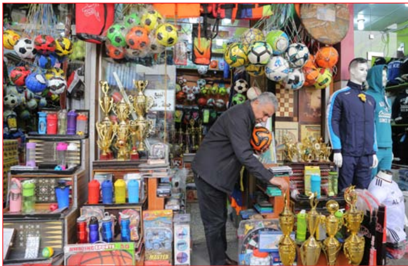
الحركة التجارية تستعيد عافيتها جزئياً مع توزيع رواتب الموظفين...

يثرب لم يكن في منزله لحظة الهجوم، وانشاء خروج ضيوف المزروعى الذين كانوا بزيارة لشقيقه الذي يسكن معه بنفس المنزل، اطلقوا الرصاص وقتلوا ٢ واصابوا شخصاً واحداً، وهم جميعهم من أبناء عمومته". والحادث الأخير، هو الهجوم السابع الذي ينفذه التنظيم في تشرين الثاني الحالي ضد متعاونين مع القوات الامنية والحكومة في المناطق ذات الاغلبية السنية.