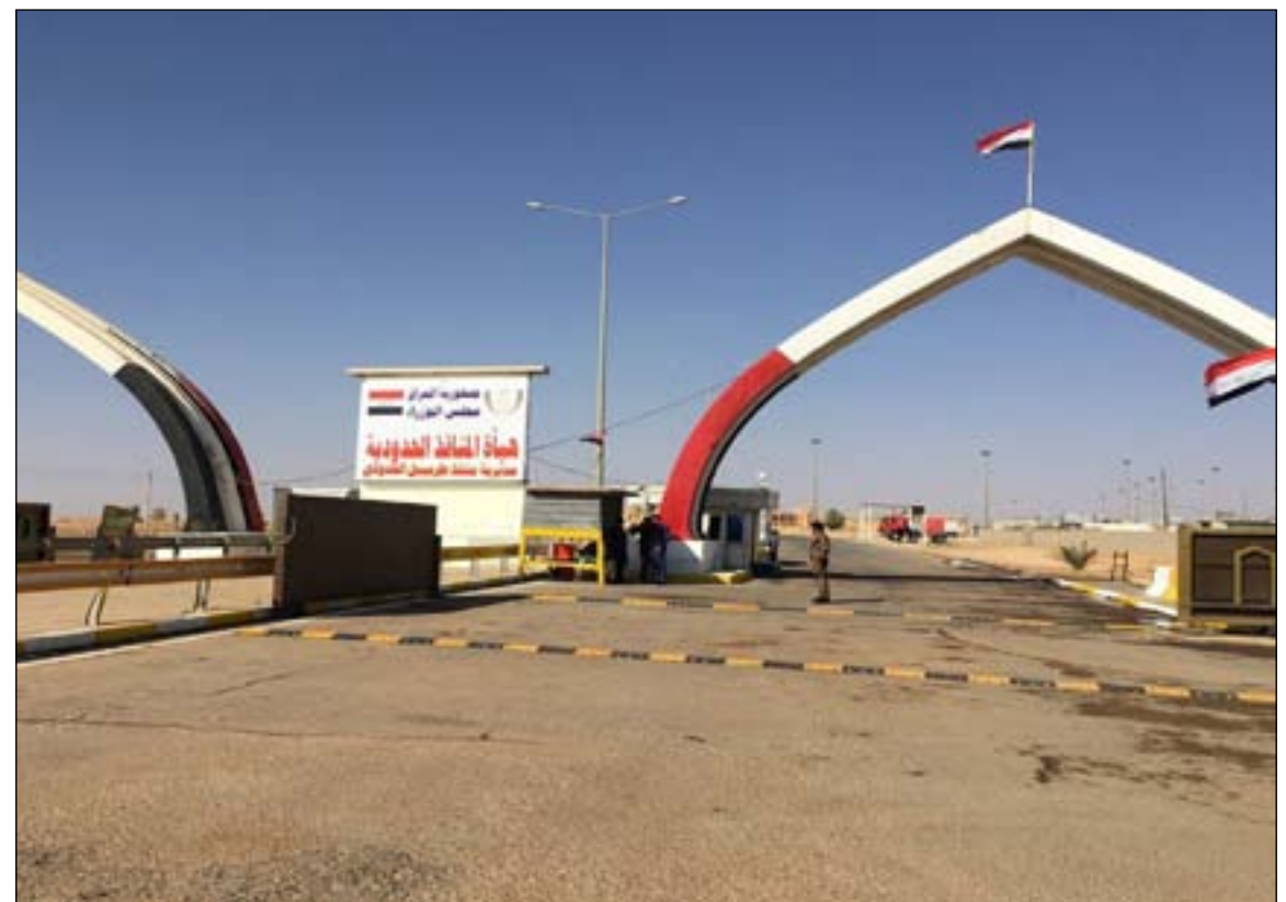
منفذ طربيل الحدودي... أرشيف

مستشار الامن الوطني قاسم الاعرجي، قال ان سياسات الولايات المتحدة دفعت بالجامع المسلحة في العراق الى التصعيد. وقال انه بدون شك اقدام الولايات المتحدة على قتل نائب قائد الحشد الشعبي ابو مهدي المهندس وقائد بليق القدس الايراني قاسم سليماني قد جعل الوضع في العراق اسوأ، مشيراً الى ان العراق كان ضحية هذه النزاعات والحروب الاقليمية.