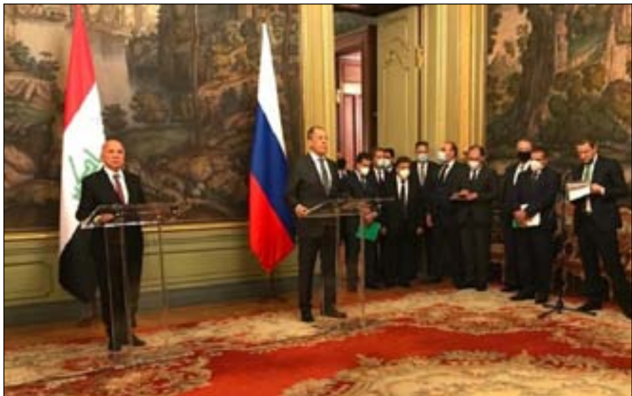
وزير الخارجية العراقي ونظيره الروسي في مؤتمر أمس

نظيره العراقي، أن لدى البلدين علاقات ودية قديمة، مشيراً إلى أن هذه العلاقات لم تمنع بغداد أبدا من تطوير علاقات مع دول إقليمية وغربية أخرى. وأبدى وزير الخارجية الروسي تفاعله إزاء فرص تطوير التعاون بين بلاده والعراق في كافة المجالات ذات الاهتمام المشترك، مشيراً إلى أن روسيا كانت ولا تزال تلعب دوراً بالغ الأهمية في ضمان القدرات الدفاعية للعراق وتسليح جيشه وأجهزته الأمنية، لاسيما في ضوء التهديدات الإرهابية القائمة في البلاد.