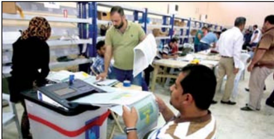
عمليات العد والفرز في الانتخابات السابقة

دعم عملية نشر المستشارين الانتخابيين التابعين للأمم المتحدة في الوقت الذي تجري مفوضية الانتخابات التحضيرات اللازمة لتنظيم الانتخابات العامة في حزيران 2021". وقال السفير الهولندي لدى العراق ميشيل رينتينان، وفقاً للبيان، إن "هولندا سعيدة بمواصلة دعمها للعراق وبالأخص العملية الانتخابية، حيث أن الانتخابات الحرة والنزيهة ذات أهمية بالغة لمواصلة تعزيز صوت الشعب العراقي". فيما أعربت البعثة، عن شكرها "الجزيل لهولندا للمساهمة التي تقدمت بها والتي عززت دعم عملية إجراء انتخابات حرة ونزيهة وشفافة في العراق"، بحسب البيان. بدوره، أبدى سفير الاتحاد الأوروبي، مارتن هوت، الاثنين، دعمه للانتخابات العراقية المقرر تنظيمها في السادس من حزيران العام المقبل، مشدداً على ضرورة أن تجرى في ظل أجواء ملائمة على مختلف الصعيد. الى ذلك قال أستاذ