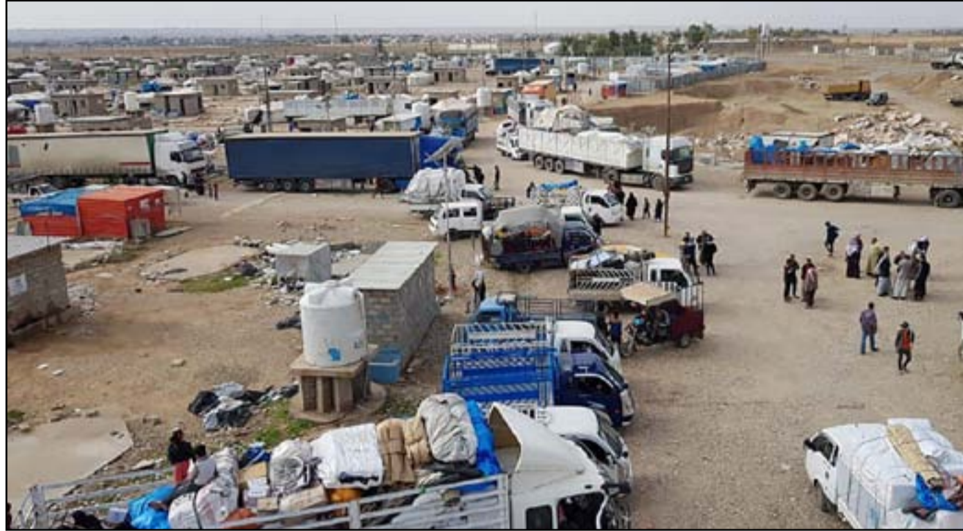
مساعي حكومية مستمرة لإنهاء ملف مخيمات النزوح