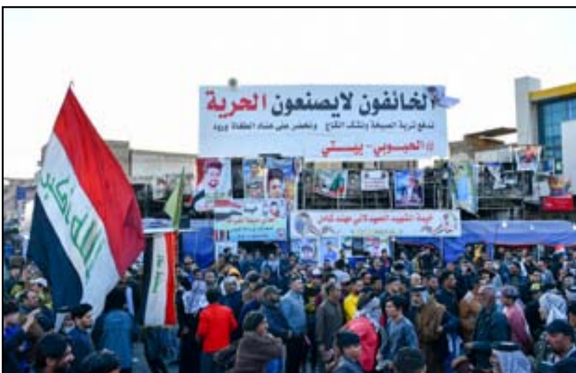
تظاهرات ساحة الحويبي وسط الناصرية

وتساءل الفارحان، "أين كانت تلك القوات يوم اقتحم المسلحون ميدان التظاهرات في ساحة الحويبي وقاموا بقتل واصابة نحو 80