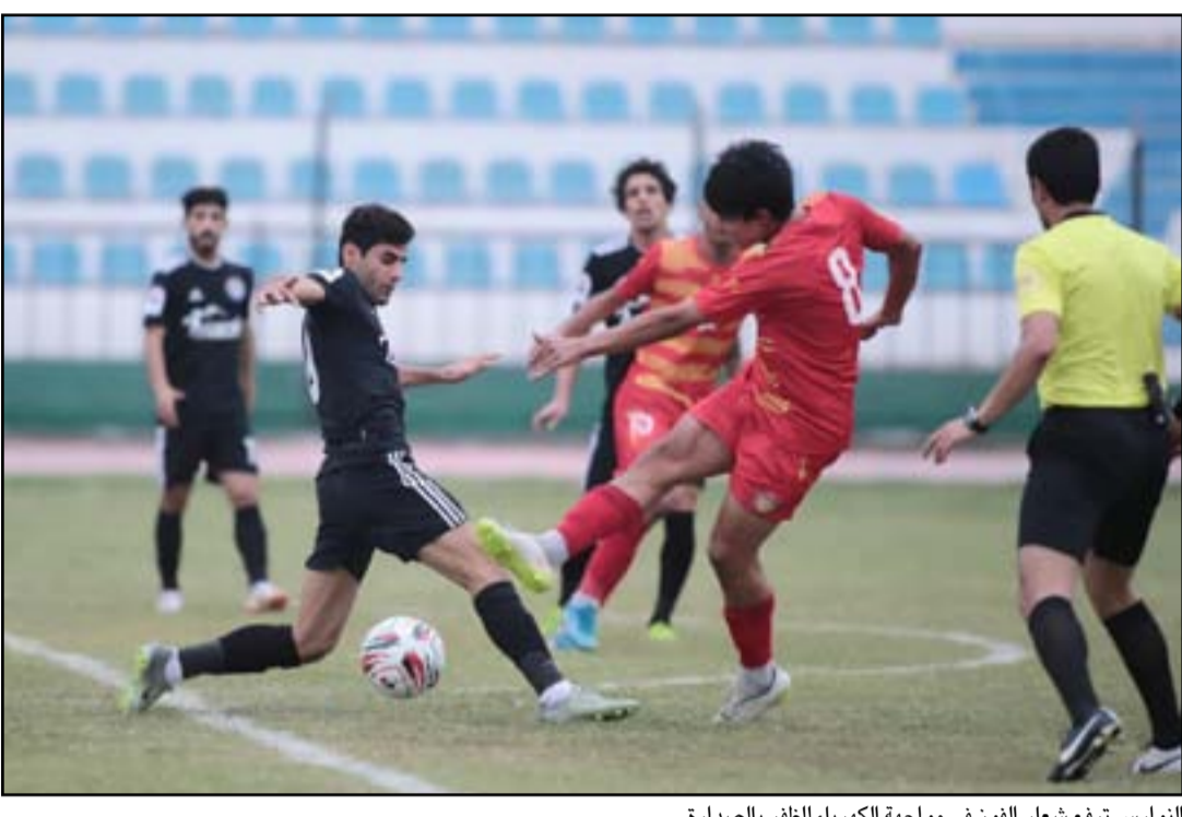
الزوراء ترفع شعار الفوز في مواجهة الكهرباء للظفر بالصدارة