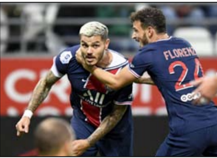
ايكاردى يغيب عن مواجهة مانشستر يونايتد

ويحتضن ملعب (جذع النخلة) بالمدينة الرياضية في محافظة البصرة لقاء من الوزن الثقيل يجمع فريق نبط ميسان التاسع برصيد سبع نقاط ومضيفه فريق الميناء السابع عشر برصيد 4 نقاط في الساعة السادسة والنصف مساءً يسعى فيه الأخير الى استثمار عامل الأرض الى جانبه للظفر بانتصار ثانٍ خلال أسبوع واحد فقط وبغارة مركزه الحالي الذي لا يناسبه نظراً لكونه من الفرق الكبيرة التي تمتلك قاعدة جماهيرية واسعة ويضم في صفوفه عدداً من اللاعبين الذين يمتلكون