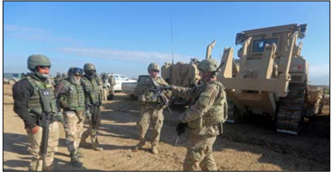
جنود اجانب مع جنود عراقيين