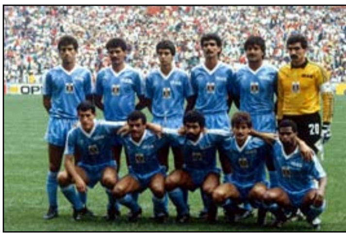
مع المنتخب الوطني في مباراته امام المكسيك بمونديال 1986

هذه الصورة السوداوية البائسة ستصل بنا إلى نتائج كارثية وبالتأكيد وتنتهي آخر فسحة أمل لرياضي عراقي مع الاستمرار ومواصلة التعلّق بهويته ومن يعولّ عليها منافسا ومشاركًا بعد أن تختمت الأولمبية الدولية بالشمع الأحمر على سجل الشرف في تواجدها بينان المتنافسين.