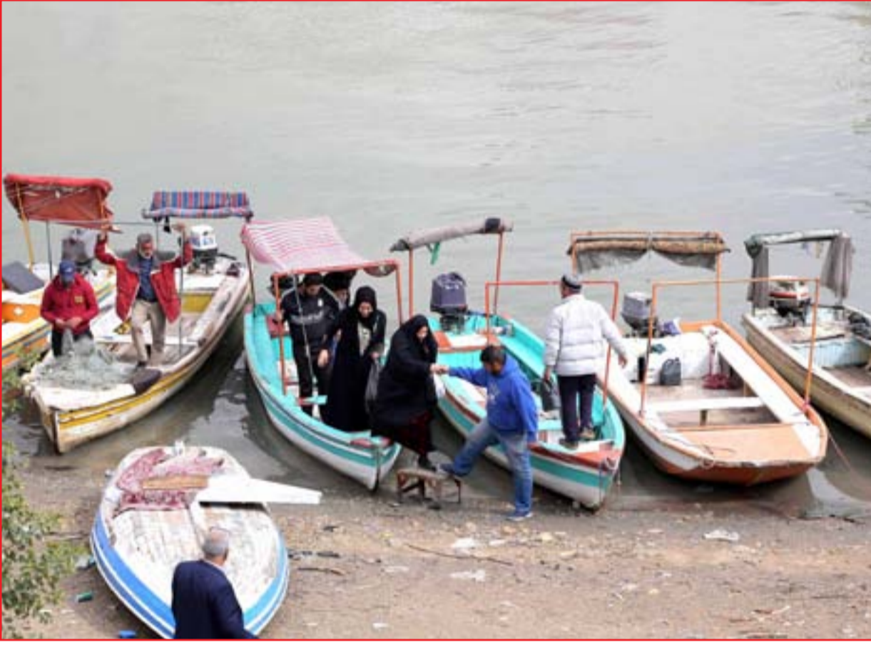
بغداديون يهربون من الزحامات إلى الكسبي النهرية ...