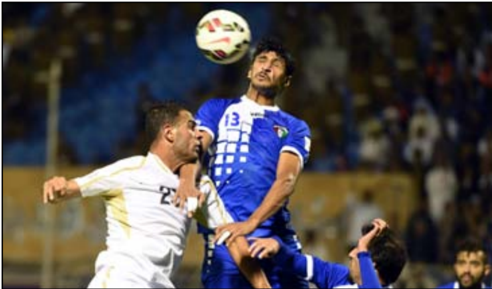
قمة جديدة مع الكويت استعداداً لتصفيات كأس العالم 2022

مغادرة الكويت حيث ستكون أول بروفة تدريبية يتولى قيادتها المدرب الإسباني كراسكو الذي تم التعاقد معه مؤخراً والذي رُحّب بها كثيراً بحكم أن منتخبه سيكتسب فائدة كبيرة من خلال الاحتكاك بأسود الرافدين الذين يتشابه أسلوب لعبهم مع منتخب النشامى وكذلك الكنغر الاسترالي المنافسين الشرسيين لهم على حطף بطاقة التأهل عن المجموعة الثانية إلى الدور الثالث الحاسم المؤهل إلى مونديال قطر إلى جانب التعرّف على مستويات والإمارات .