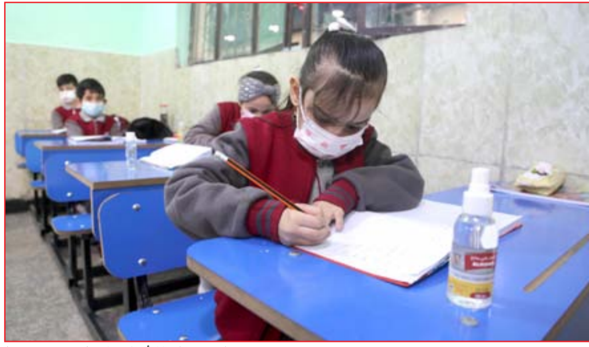
مدارس في بغداد خلال أزمة كورونا ...

مهّد تعليقات زعيم التيار الصدري مقتدى الصدر، لصلح بينه وبين زعيم ائتلاف دولة القانون نوري المالكي بحسب أوساط سياسية قالت ان "دعوة ترميم البيت الشيعي" تمثل منطلق طريق الصلح. كذلك يتحدث نواب عن اجتماع مرتقب يجمع بين القوى السياسية الشيعية ورئيس الحكومة مصطفى الكاظمي لـ"تصحيح العلاقات بين جميع الأطراف. ويكشف بدر الزبيدي، النائب عن كتلة تحالف سائرون أنه "بعد دعوة مقتدى الصدر إلى ترميم البيت الشيعي انطلقت مباحثات ومناقشات بين القوى الشيعية للتحضير إلى لقاء مرتقب يجمعها