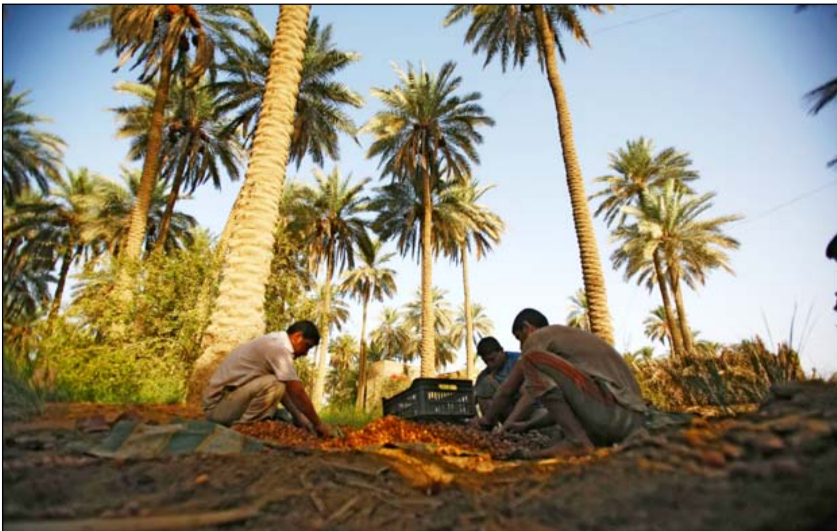
إعداد /عديلة شاهين

وساهمت حرب 2003 في القضاء على مساحات اضافية من البساتين، نتيجة لعمليات تجريف البساتين التي قامت بها الولايات المتحدة الأمريكية في الريف والمدن وازدياد قطع الاشجار كأجراء امني خشية وجود مسلحين يحتمون في البساتين خلف النخيل والاشجار كما انخفض عدد المصانع من 150 قبل الحرب إلى 6 مصانع في عام 2009، وتعباً أغلب التمور العراقية الآن في دولة الإمارات العربية المتحدة.