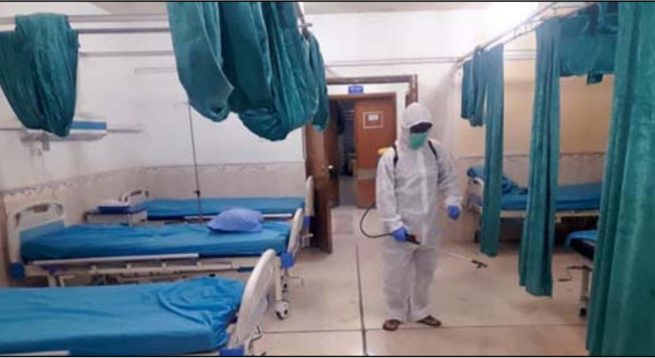
انخفاض الضغوط على ردهات العزل بسبب قلة الإصابات.. ارشيف

مستمر بالتواصل واستحصال الموافقات اللازمة حتى يكون جاهزاً للاستخدام". وأضاف، أن "هناك شركة أيضاً للقاحات، وهي شركة ستراتونيك وربما هذه الشركة تحصل في القريب على الاعتمادية والعراق متواصل معها لحجز حصة من اللقاح وظروفها أسهل من ظروف فايزر". وكان وزير الصحة العراقي حسن التميمي قد أكد في وقت سابق، أن هناك مباحثات مستمرة مع شركة فايزر الأمريكية لتقريب موعد توريد اللقاح والذي سجل له مراحل متقدمة من الموافقات والتجارب، مستندراً أن التعاقد والتوريد مشروط بالمصادقة عليه وتجربته عالمياً سيما من قبل منظمة الصحة العالمية.