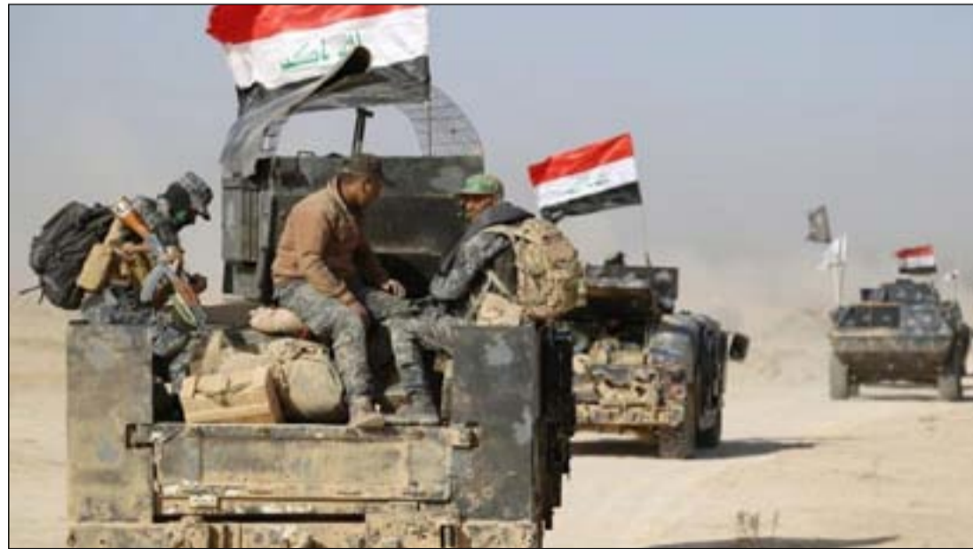
قوات أمنية في عمليات غربي العراق.. أرشيف