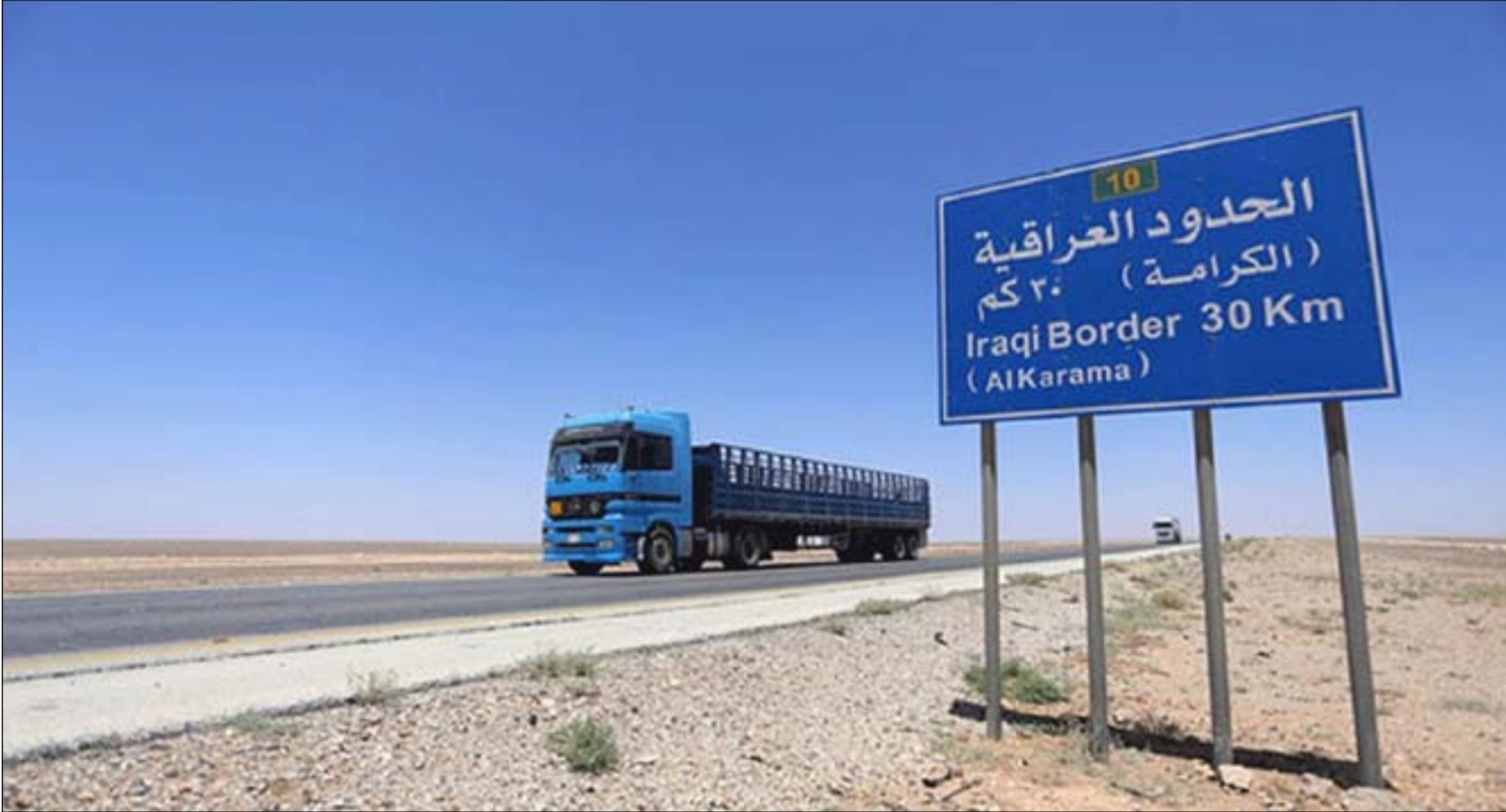
مركبات حمل على الطريق الدولي... أرشيف

وعلى خلفية تلك الأحداث اصدر الحشد الشعبي، قراراً بإيقاف احد عناصره بعد تهديده لقائد عمليات الأنبار ناصر الغنام. وكان رئيس الوزراء مصطفى الكاظمي، قد سبق بإعلان تشكيل لجنة تحقيق حول ما اشيع بان الغنام اراد رفع صور ابو مهدي المهندس النائب السابق لهيئة الحشد، من مواقع في الأنبار. ويؤكد مصدر مطلع في الأنبار ل(المدى) انه خلف قصة رفع صور المهندس هناك تناقض محموم لبيد نفوذ بعض الفصائل على الأنبار وخاصة على الحدود. وتما الفصائل طول الحدود مع سوريا (نحو 600 كم نصفها مع الأنبار) بصور سليمان والمهندس وشعارات ورايات مختلفة، فيما يقول المصدر ان الصور هي آخر هومو الناس. في وقت مبكر من عمليات التحرير من داعش، قفز الى المشهد الصراع على الحدود، وهو ربما السبب وراء إقصاء قائد العمليات الذي سبق الغنام. ويضيف المصدر الذي يعمل قريباً مع قيادة العمليات: "أغلب الفصائل