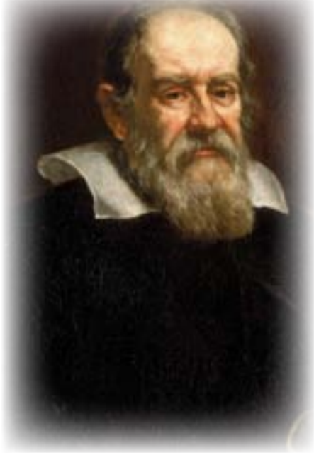
ت. س. إليوت

سوء الطالع جاء العلم متأخراً، متأخراً جداً. وما على ستيفن ديدالوس إلا أن يختار. وقف في مفترق طرق وتأمل. أين وجهته؟ من هنا طريق عذابات الأنبياء، نازفة. ما يزال البخار يصعد من الدماء الساخنة. خطباء وحشود بثّتى اللغات. حناجر تتدابح بأوتارها الصوتية.