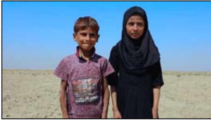
تفشي مرض الفلج الجليدي بين الأطفال بسبب المياه الملوثة