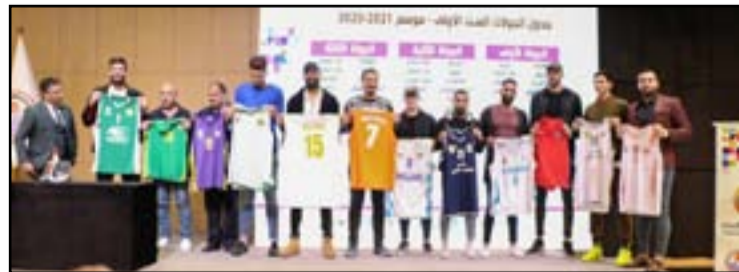
ممثلو الأندية المشاركة في دوري كرة السلة

وستجري الأدوار الستة الأولى في تجمعٍ تحتضنه العاصمة بغداد بموجب الآلية التي تم الاتفاق بشأنها بين مجلس إدارة اتحاد السلة برئاسة د.حسين العميدي مع ممثلي أندية الشرطة والكهرباء والنفط والخطوط الجوية والأعظمية ولفظ البصرة والحلة البابل والتضامن النجفي ونفط الشمال والحشد الشعبي وغاز الشمال وزاخو وذلك بسبب قرب التضامن النجفي.