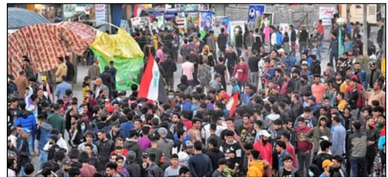
تظاهرات 11 كانون الأول 2020

وأشار التميمي إلى أن "الخيام التي تعمل وفق أجدات حزبية وأغراض شخصية هي من أترت