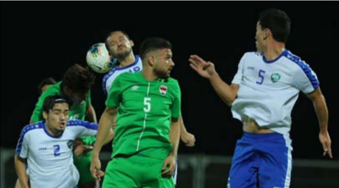
الوطني يسعى للحفاظ على صدارة مجموعته الثالثة

ويحتضن ملعب (الكفل الأولمبي) في محافظة بابل مباراة فريق القاسم صاحب المركز العشرين والأخير برصيد ثلاث نقاط وضيفه فريق الحدود السادس عشر برصيد سبع نقاط القادم من العاصمة بغداد في تطوعات تمتت في جعبته 12 نقطة على ملعب (فراسو) حريري) بحكم