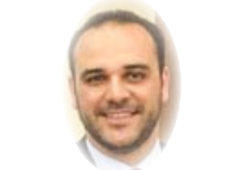
■ د. أمير ناظم الجاسور

يعمل وفق مبادئ السياسة والنظر للضحايا الخارجية والداخلية من مطلق المصلحة الوطنية، وبُشّرت وبُشّرت ووعدت بان يكون العراق مختلفاً عن سابقه حتى بات حلم العراقيين ان يكون بلدهم كإقرانه على الأقل دول المنطقة التي تنعم بالرفاهية والتنمية والحرية بعد ان عاش الشعب سنوات طوال من الحروب والمعاناة، وتعاونت مع أحزاب المعارضة ( الأحزاب الحاكمة الحالية) من أجل تسليمهم زمام الأمور لعراق جديد خال من المشاكل والتهديدات والأزمات التي أثرت على مشاريعهم في المنطقة.