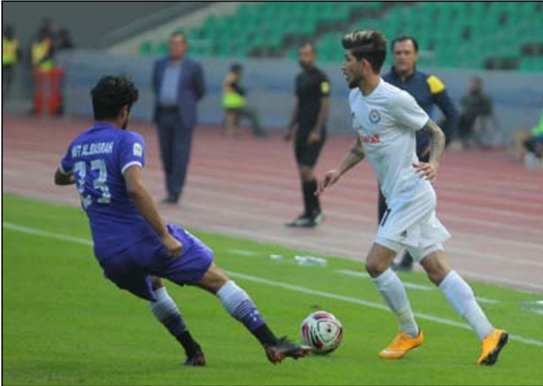
الزوراء في مهمة صعبة أمام الصناعات لطرد النحس

ويسعى فريق الشرطة الوصيف برصيد إثني عشرة نقطة إلى فوز ثانٍ مع المدرب الصربي الكسندر الييتش عندما يضيف فريق النجف الثالث عشر برصيد ثماني