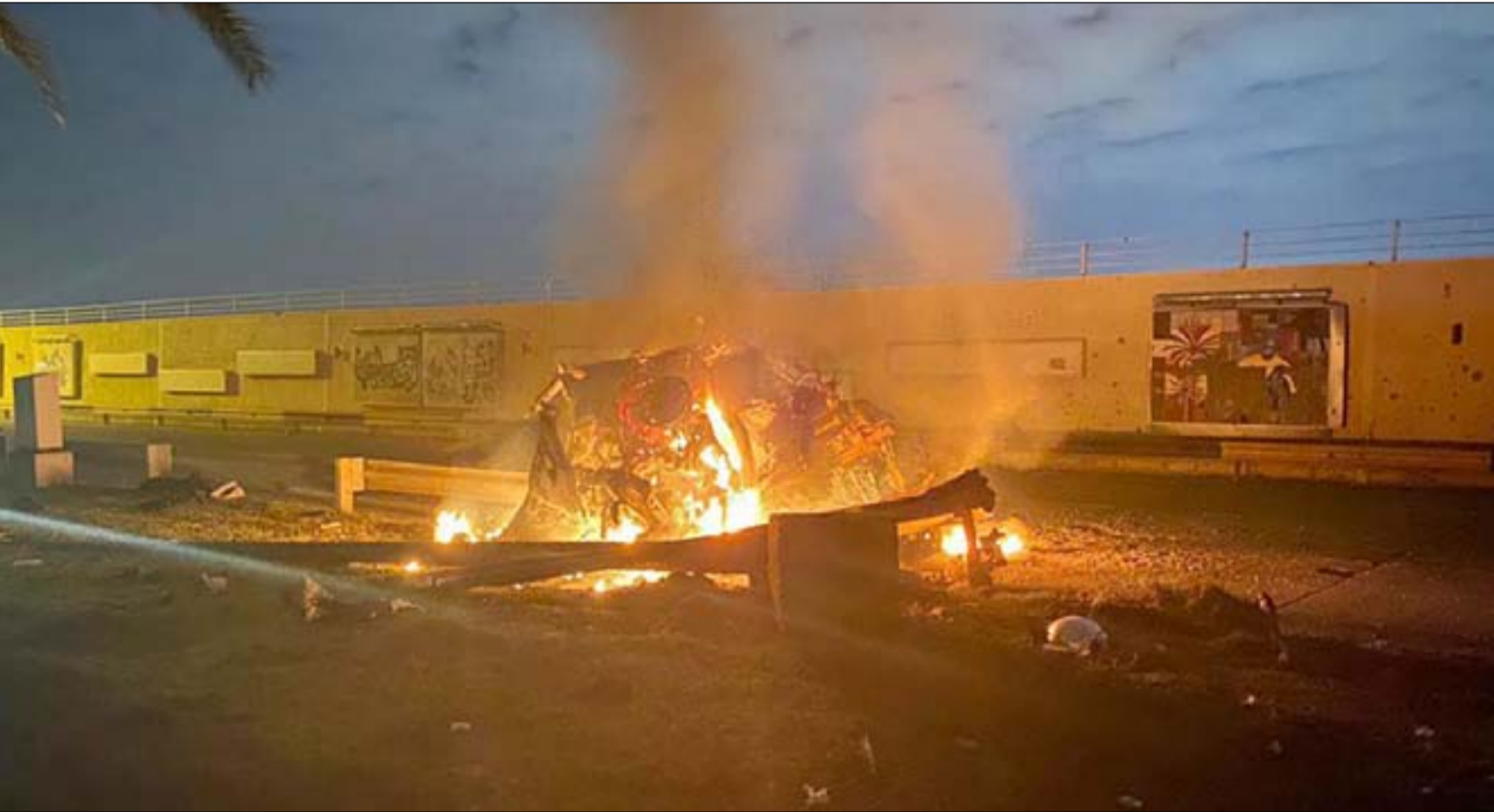
القصف الاميركي على مطار بغداد الدولي..(أرشيف)

العراقية لدخول الطائرات في يوم حادثة المطار. وجاء في الوثيقة الموقعة من قبل قائد الدفاع الجوي السابق، الفريق جبار عبيد كاظم بتاريخ 3 كانون الاول 2020 (بعد ساعات من العملية) أن "هناك ثلاث طائرات مسيرة دخلت أجواء العاصمة بغداد قبل ساعات من العملية واتجهت نحو المطار بعد منتصف الليل نهار 3 كانون الاول 2020 وبعد العملية غادرت العراق باتجاه الأردن".