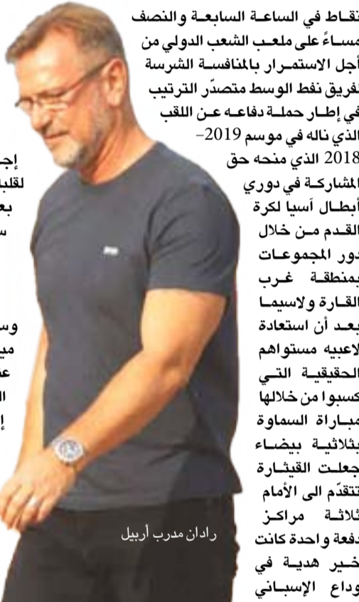
رادان مدرب أربيل

وسيغار فريق نضط ميسان الثامن برصيد عشر نقاط مدينة العمارة إلى محافظة أربيل في إقليم كردستان حيث تنتظره مهمة صعبة في الساعة الثانية ظهراً أمام ضيفه فريق السادس عشر برصيد سبع نقاط القادم من العاصمة بغداد في تطوعات تمتت في جعبته 12 نقطة على ملعب (فراسو) حريري) بحكم