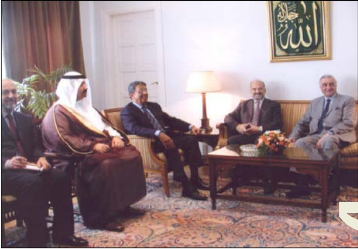
عمرو موسى مع مجلس الحكم العراقي