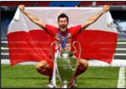
روبرت ليفاندوفسكي قاد فريق بايرن ميونيخ إلى التتويج بالثلاثية التاريخية

وأوضح الفيفا إن اختيار ليفاندوفسكي ضمن القائمة النهائية جاء بناءً على قيادته فريق بايرن ميونيخ إلى التتويج بالثلاثية التاريخية (دوري وكأس ألمانيا ودوري أبطال أوروبا) إلى جانب كأس السوبر الأوروبي والألماني والحصول على جائزة هدف الوندسليغا إثر تسجيله 34 هدفاً ودوري الأبطال بالموسم 2020 الذي أحرز فيه 15 هدفاً فيما نجح رونالدو في مساعدة السيدة العجوز بنيل لقب دوري الدرجة الأولى الإيطالي لكرة القدم بالموسم الماضي وحصوله على المركز الثاني في لائحة الهدافين برصيد 31 هدفاً، وأما ميسي فظف بجائزة الينشيتيني كهدف للدوري الإسباني لكرة القدم للموسم الرابع على التوالي من تسجيله 25 هدفاً وحلول فريق برشلونة على وصافة الليغا.