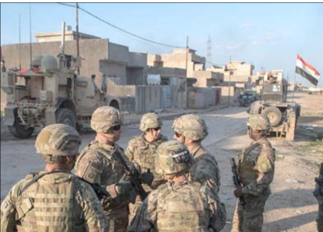
مستشارو التحالف الدولي في قاعدة عراقية

واضاف الجنرال بقوله "اليوم اين ما تجد صراعاً في منطقة الشرق الاوسط تجد هناك نازحين ومهجّرين محليين، وبالإضافة الى المعاناة الإنسانية التي توجد في مخيمات النازحين رغم المساعدات المقدمة من منظمات وجمعيات اغاثية، فإن هناك احتمالية في ان تتحول تلك المخيمات الى ارض خصبة للترويج للأفكار المتطرفة". وقال ان هذه تعتبر مشكلة سنتراليجية كبرى يتطلب حلها موارد دولية فضلاً عن تعهدات لحكومات محلية بحل مشكلة النازحين وخصوصاً المخيمات التي تأتي عوائل مسلحين ومتطرفين.