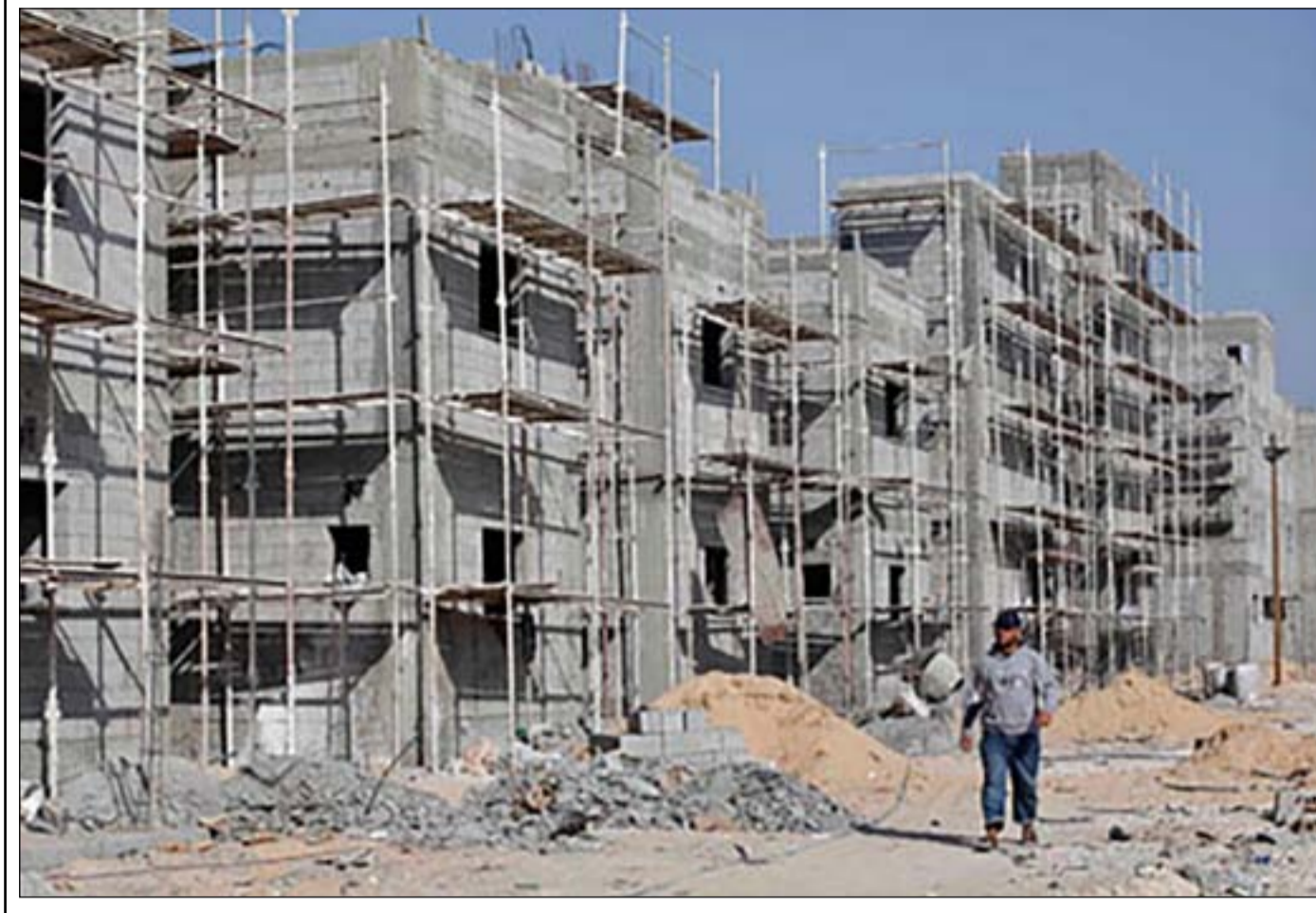
مبنى استثماري في العاصمة بغداد... أرشيف