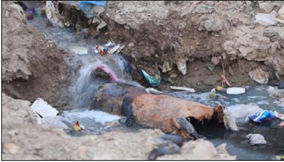
الصرف الصحي في الديوانية

هذا الموضوع تم إعداده بالتعاون مع: Clingendael Institute Free Press Unlimited