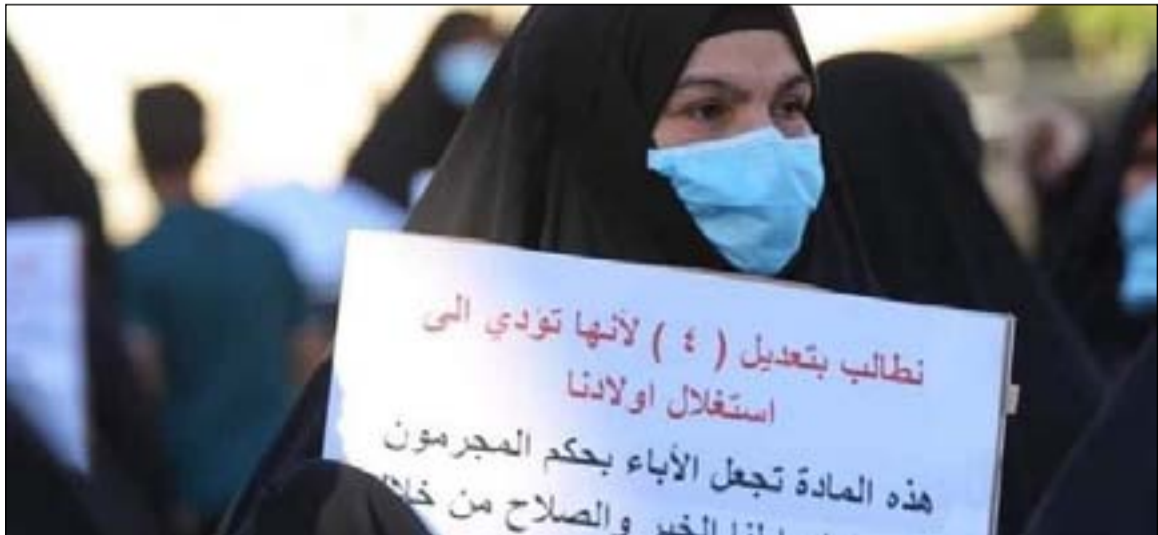
مسنة في إحدى التظاهرات المناهضة للعنف ضد المرأة.. أربيد

وقالت البجاري أنه "رغم الأموال الطائلة التي تصرف على وزارة الكهرباء ودوائر الكهرباء في المحافظات لكن منذ 2003 وإلى الآن لم نستطع الوزارة أن تعالج مشكلة الكهرباء". وأضافت البجاري "اليوم أحد الأسباب في الأزمة هو نقص الغاز لكن هذا ليس مبرراً لانقطاع التيار وخاصة في بغداد ومحافظات الوسط وحتى المحافظات الشمالية تشكو من مشاكل الطاقة الكهربائية". وتابعت أنه "في الفترة المقبلة من عمل البرلمان ستتم استضافة واستجواب عدد من الوزراء ومن بينهم وزير الكهرباء لتوضيح أسباب هذا التلوث الكبير في تجهيز الطاقة".