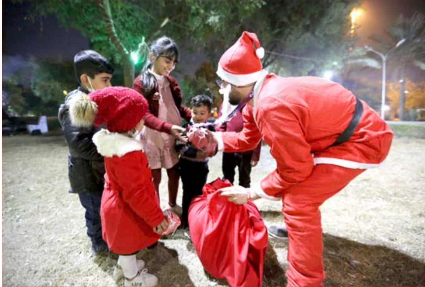
شاب يوزع الهدايا على الأطفال أمس...