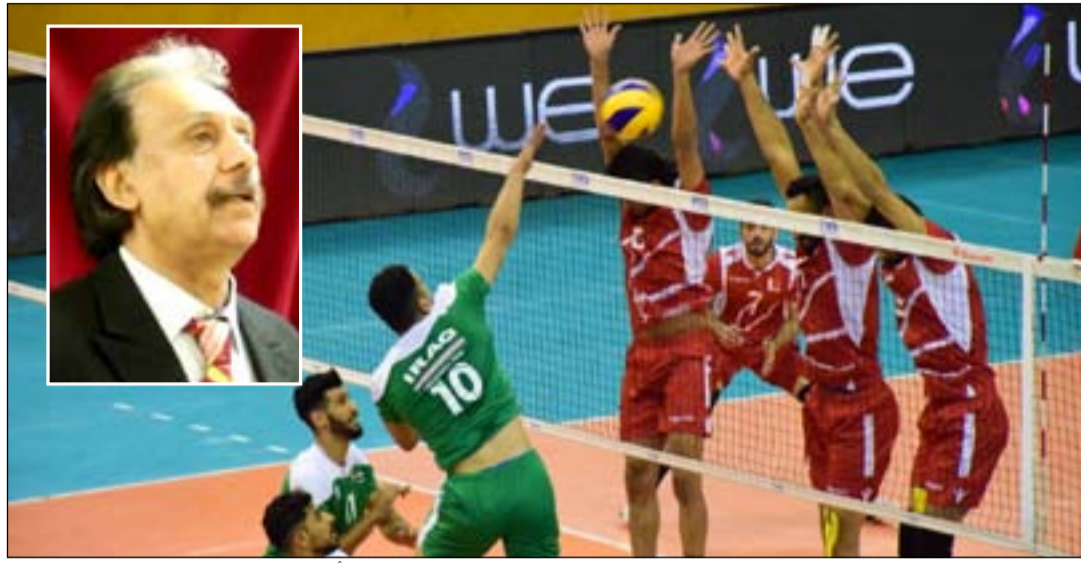
الرياضيون في أمريكا يدعون لانقاذ الرياضة من واقعا الرامن