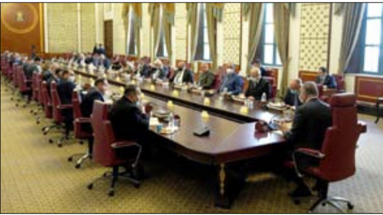
الكاظمي خلال اجتماع يوم امس

ينتهي الى أي من الكتل السياسية، ومفوضية انتخابات مستقلة، وقانون انتخابات منصف يفوز فيه من يحصل على أعلى الأصوات". وأشار إلى أنه "لدينا فرصة للنجاح في استعادة ثقة الشعب بالدولة والنظام السياسي والأليات الديمقراطية، وذلك بإقامة انتخابات نزيهة وعادلة من شأنها أن تحقق استقرار البلد". وبين الكاظمي، "السلطة عندي ليست إرضاءً للذات، وإنما هي عبء إنجاز وإجراء الانتخابات المبكرة وعندها نكون قد أنجزنا المهمة التاريخية التي أنيطت بنا، ونحن مفوضية الانتخابات والعملي الانتخابية". وأكد الكاظمي وفقاً للبيان، أن "المهمة المركزية لحكومتنا هي إجراء انتخابات مبكرة، باعتبارها حكومة استثنائية بكل المقاييس، فهي نتاج لحراك شعبي من جهة ومطلب للمرجعية والقوى السياسية التي تنشأ التغيير من جهة أخرى. وتابع، أن "الحكومات المتعاقبة منذ عام ٢٠٠٣ جعلت من الفترة الانتقالية فترة مستديمة، وهذا يعد من أكبر الأسباب التي جعلت الأليات عقيمة". وأضاف، "نحن الآن على مفترق طرق، بعد أن تحققت ثلاثة أهداف أساسية في هذه الفترة الانتقالية التي نقودها الآن، أولها رئيس وزراء مستقل لا