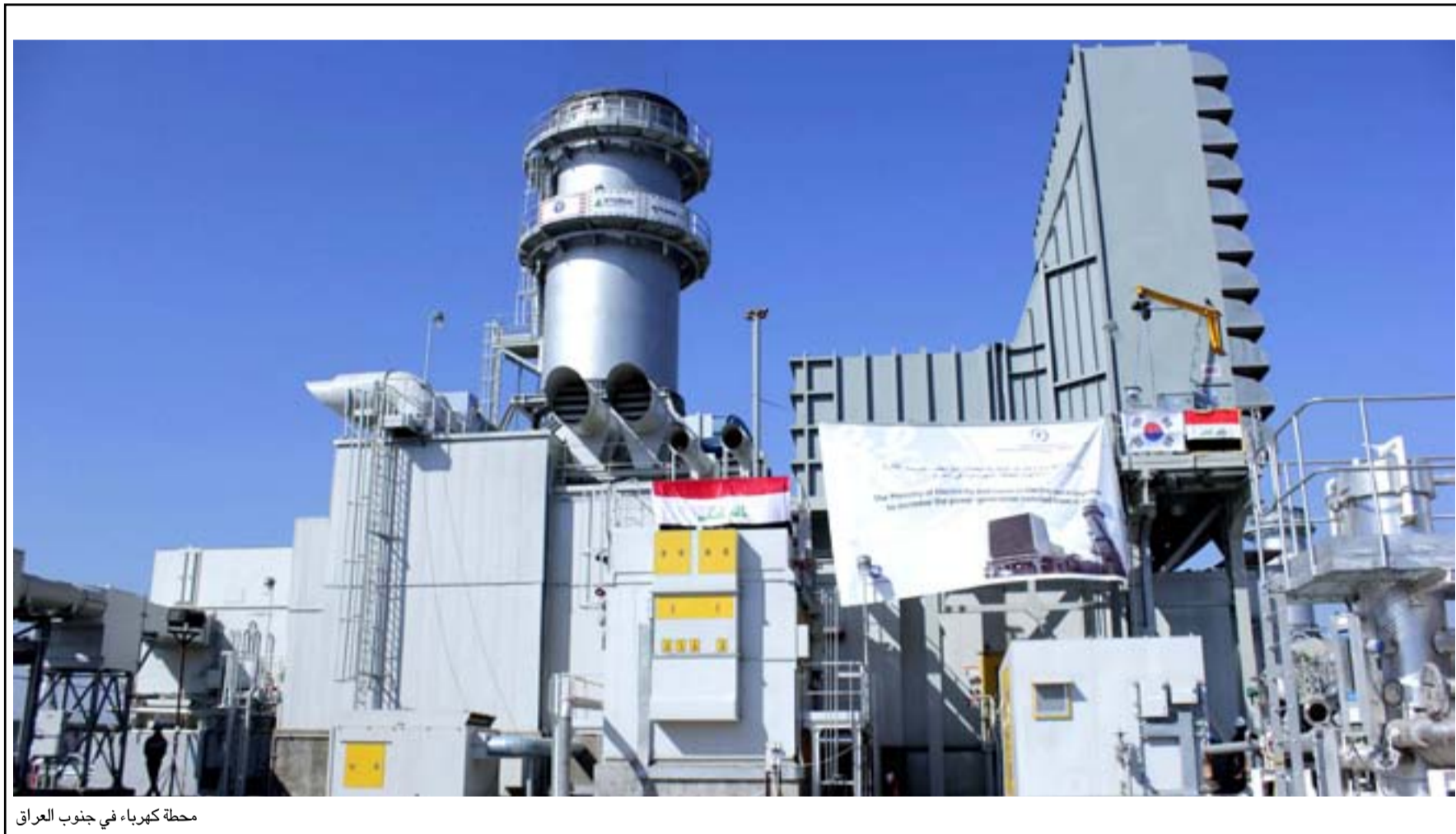
محطة كهرباء في جنوب العراق

مبشراً "هذا الانخفاض في الإنتاج الكهربائي بسبب قلة الغاز وعدم وجود الصيانة". ووفقاً لعفنان وهو عضو في لجنة الطاقة البرلمانية الحالية فإن القدرة التصميمية لجميع المحطات الكهربائية المشيدة في عموم المحافظات العراقية هو لإنتاج أكثر من (27) ألف ميكا واط مع الأخذ بنظر الاعتبار تجهيزها بالغاز الطبيعي والمواصل في إدامتها، مبيهاً أن أكثر من عشر محطات كهربائية متوقفة عن العمل بسبب حاجتها إلى الصيانة وشراء بعض قطع الغيار".