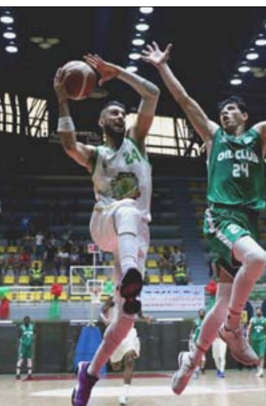
فريق النفط نجح في تحقيق الانتصار خلال ست مباريات

غاز الشمال في المركز الثامن برصيد 7 نقاط من فوزه في مباراة واحدة فقط وخسارته في 5 وكان المركز التاسع من نصيب فريق زاخو حيث جمع 7 نقاط فقط من انتصاره في مباراة وتلقبه 5 هزائم يليه فريق نطق الشمال في المركز العاشر برصيد 7 نقاط من فوزه في مباراة واحدة وتعرضه في الخسارة في 5 وأحتل فريق الحلة المركز الحادي عشر برصيد 7 نقاط حصدها من تغلبه في مباراة واحدة وتعرضه إلى الهزيمة في 5 فيما كان المركز الثاني عشر والأخير من حصة فريق الأغلبية برصيد 6 نقاط فقط من وقوعه في 6 خسارات ولم