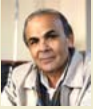
تاركوفسكي الذي رحل منتصف الثمانينيات مثله مثل قرينه الإيطالي بيير بازوليني اهتم بالشعر وكتبه، وكان الإنسان كانا تجسيدا للمصرخة التي أطلقها أورسن ويلز

في فيلم (حنين) وهو آخر أعماله تتعامل الشخصية الرئيسية مع الصراع الداخلي بصمت وتسعى إلى الغناء الحدود في الزمن، البطل هنا مدرس ويبحث موسيقى يذهب في زيارة لقريبة إيطالية يقتفي أثر حياة موسيقار روسي زار القرية نفسها قبل قرنين ويتناب هذا الموسيقار ألم وحنين إلى بلاده، يتكرر الشيء نفسه مع الباحث.. يكفي أن نقف عند معنى عنوان الفيلم ومدلول هذه الكلمة في العربية، خاصة إذا ما عرفنا أن تاركوفسكي قد درس العربية وأتقنها.