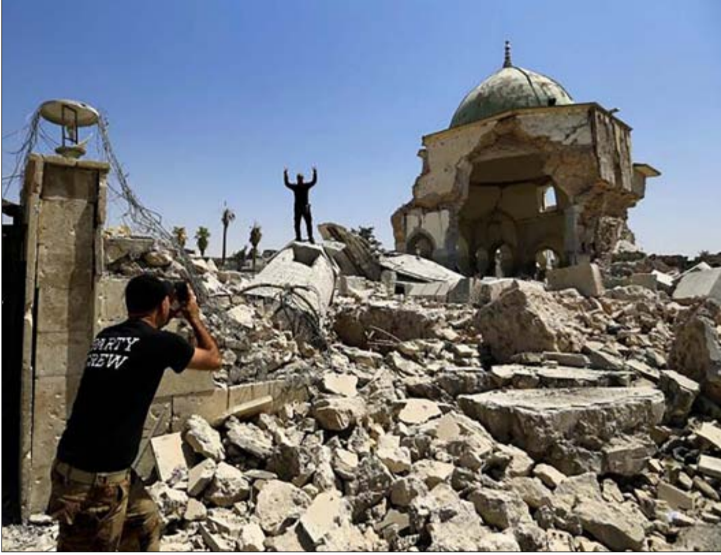
الركاب الذي خلفه تفجير جامع النوري من قبل عناصر داعش ... أرشيف

■ نصف تريليون دينار لإزاحة 3 أهرامات من الركاب