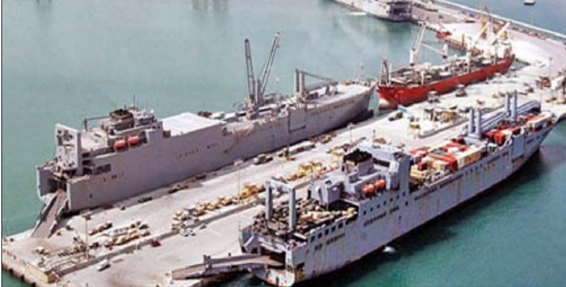
ناقلة نفط في ميناء أم قصر... ارشيف

يضطر الى ترك النفط في الحقول النفطية نفسها مما يشكل ذلك اعاقه مواصلة المزيد من انتاج النفط". كانت تلك المشكلة تعيق ايضا مضاعفة انتاج المزيد من خام البصرة المعتدل وهو صنف نفطي جديد مشكل من مزيج من خام البصرة الخفيف والثقيل ويعتبر مصدر موارد مالية اضافيا. وحالما يتم الاكتمال من مشروع الفاو سيكون الوضع اكثر كفاءة في ضخ الميناء من النفط الى المراسي الحمولة المفردة SPM حيث توجد منها خمسة الان، اربعة منها في حالة استخدام مستمر والآخر يخضع لاعمال صيانة دورية. وكانت عمليات توسعة تجري في طاقة ارضية التحميل عند خور العمبة وارضفة تحميل البصرة. وعلى السياق نفسه بسعي العراق لمضاعفة قدراته التصديرية للنفط، انشاء بحري هولندية لبناء جزيرة صناعية