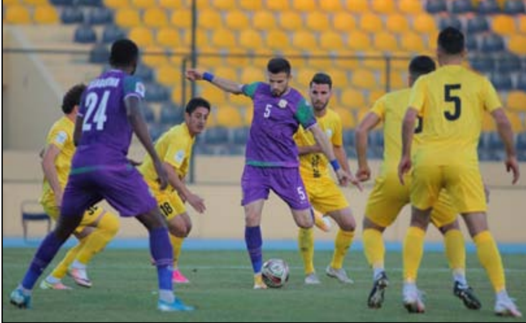
أربيل يطمح بثلاث نقاط من منافسه الطلبة

وبرغم التحديتات التي فرضتها أزمة كوفيد-19، نظّمت إدارة التواصل المجتمعي باللجنة العليا العديد من البرامج والبادرات العام الماضي، بهدف مشاركة الجميع في رحلة قطر نحو استضافة