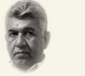
طالب عبد العزيز

لا زريد أن نستيق الأحداث ونرسم صورة قائمة لزيارة الحبر العظم، البابا فرنسيس الى العراق، للفترة من 5-8 آذار القادم، هذه الزيارة التي يترقبها بسعادة بالغة، أشقاؤنا المسيحيون والعراقيون بعامة، والتي تأتي كسابقة لقداسته في الشرق الأوسط، حيث تحتم الأحداث في العراق، المنطقة الأكثر سخونة في وقائنها، وبسبب ما قامت به صوابات داعش، في المنطقة المسيحية على وجه التحديد.