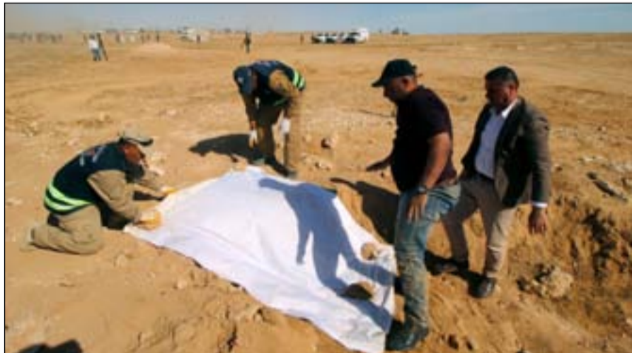
احدى المقابر الجماعية.. أرشيف

ونفذ فصيل مسلح ضمن الحشد يعتقد انه تابع لحركة عصائب اهل الحق جريمة قتل خلالها ٨ مواطنين من قرية الفرحانية فيما ما زال مصير ٤ آخرين مجهولا. ويتابع