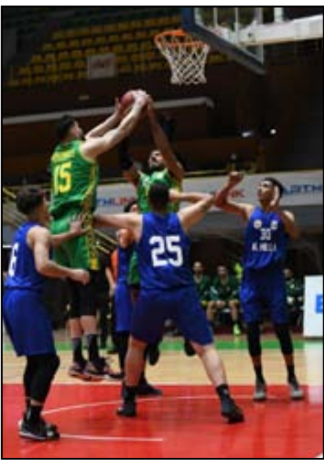
لقاء متكافئ بين الحلة ونفط الشمال بدوري السلة

ويشهد فريق الحلة الى استغلال عامل الأرض الى جانبه من أجل الفخر بانتصار ثاني خلال مسيرته الحالية في الدوري لمغادرة مؤخرة الترتيب الذي يحتله من خوضه 7 مباريات والتقدم الى المركز العاشر في الترتيب خلف فرق النفط المتصدر والشرطة الوصيف والحشد الشعبي الثالث والكهرباء