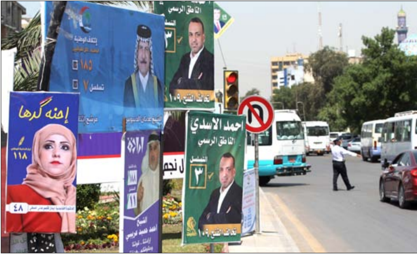
لافئات انتخابية للدورة البرلمانية السابقة.. أرشيف