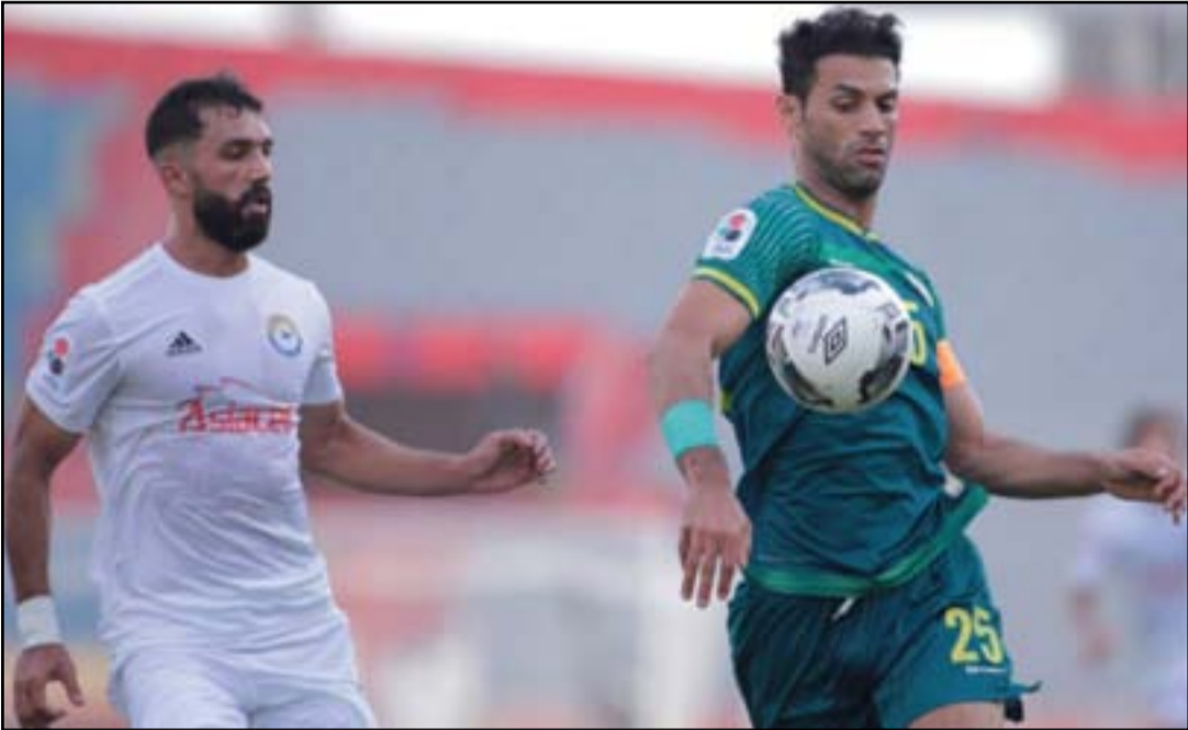
ترقب عراقي لقرعة دوري أبطال آسيا

كانون الأول الماضي وتوّج فريق أولسان هيونداي الكوري الجنوبي بطلا لها بسبب استمرار أزمة تفشي فيروس كورونا المستجد (كوفيد 19-) في عدد كبير من دول القارة منذ بداية شهر شباط الماضي الذي