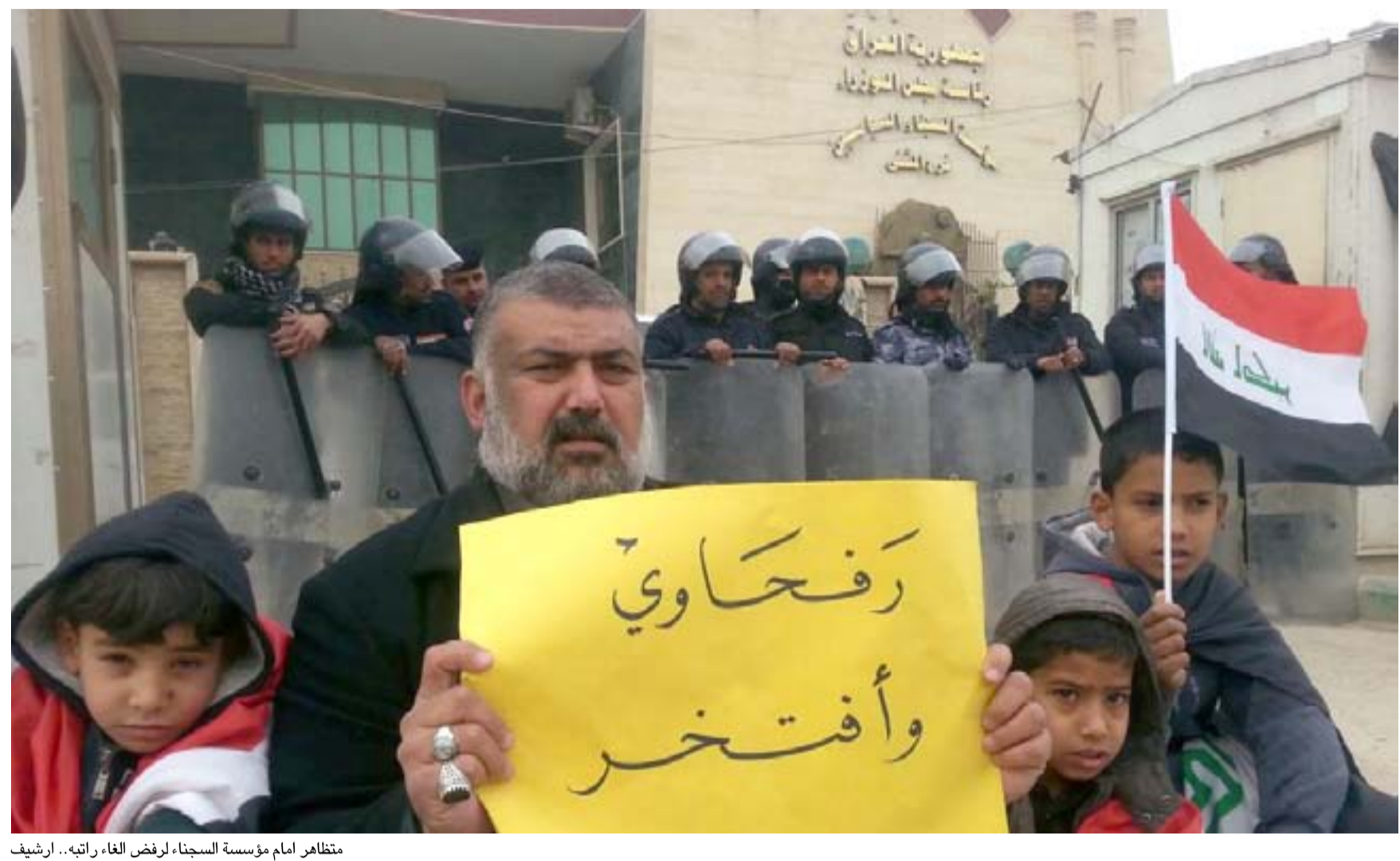
مظاهر أمام مؤسسة السجناء لرفض إلغاء راتبه.. أرشيف

وقراراً يلزم بتحقيق العدالة الاجتماعية ومعالجة ازدياد الراتب والرواتب التقاعدية لمحتجزى رفحاء ووفاء من المقيمين خارج العراق بسبب الأزمات المالية الراهنة. وفي شهر ايلول الماضي توعدت لجنة الشهداء والضحايا والسجناء