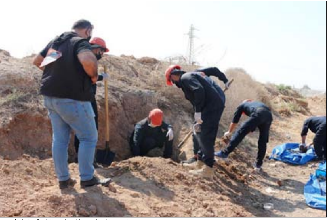
فريق ينتشل رفات ضحايا في إحدى المقابر الجماعية.. أرسيف

وأشار، إلى أن "الإدارة المحلية فاتحت الجهات المعنية ممثلة بمؤسسة الشهداء في صلاح الدين بضرورة تشكيل لجنة مختصة لاتخاذ الإجراءات الاصولية وفتح المقبرة،