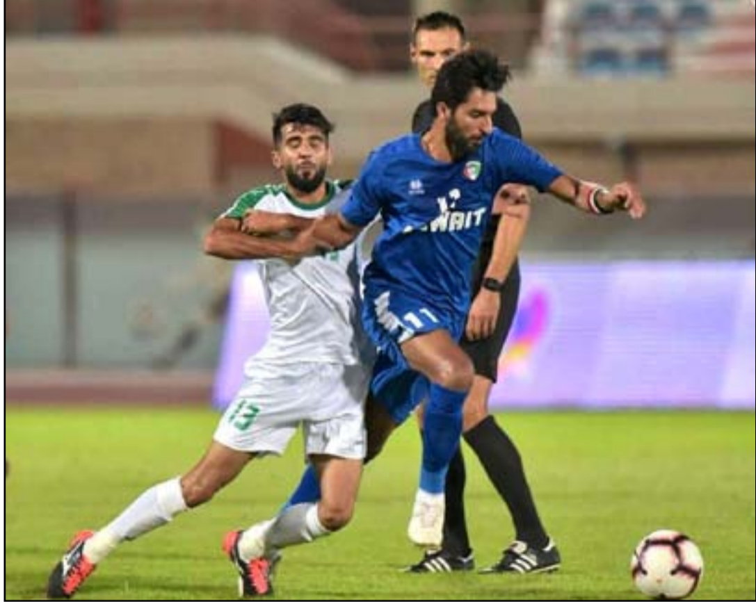
ديربي كلاسيكي خليجي يجمع الأسود مع الأزرق الكويتي في البصرة

ويعتزم مجلس الاتحاد الدولي لكرة القدم إقرار الخطوة الجديدة بالتنسيق مع نظيره الاتحاد الآسيوي لكرة القدم بعد النجاح المنقطع للتظهير الذي حققه الأخير من خلال إقامة الجولات المتبقية للدور الأول من دوري أبطال آسيا لكرة القدم والأنوار الإقصائية لمنطقتي الغرب والشرق بنظام التجمع في العاصمة القطرية الدوحة وفقاً لإجراءات صحية واحترافية تم تطبيقها من قبل الاتحاد القطري لكرة القدم حسب البروتوكول الطبي الشامل الموسى به من قبل الفيفا لاتحادات