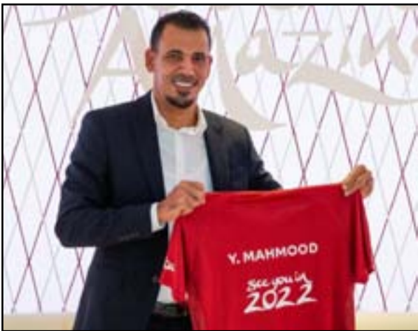
يونس محمود سفير مونديال قطر

مونديال في المنطقة تجربة رائعة أصل أن تترك إرثاً يعود نفعه على الأجيال المقبلة. ويتيح لي هذا الدور أن أقف على المستوى المهر لتفاصيل الإعداد للحادث، والالتزام بالتميز في كل جانب من جوانب التحضير لمونديال قطر 2022 وخصيصاً لم يحالفني الحظ سابقاً للتأهل لنهائيات كأس العالم، ولكن بحكم مشاركتي في التصفيات وحسب لكأس العالم، أرى أن هذه البطولة بالذات تحتل مكانة خاصة في قلوب المشجعين العراقيين في مختلف أنحاء العالم. واختمت يونس محمود تصريحه بجميع ملاعب المونديال القطري جميلة، ولكل منها رونقه الخاص، ولكنني أفضل ملعب الجنوب لأنه يقع في مدينة الوكرة التي لعبت ضمن صفوف ناديها في الدوري القطري بالبحرين والفسني. الأخر إن من أيدعت في تصميم هذا الملعب الرائع هي أبنة بلدي العمرارية العالمية زها حديد.