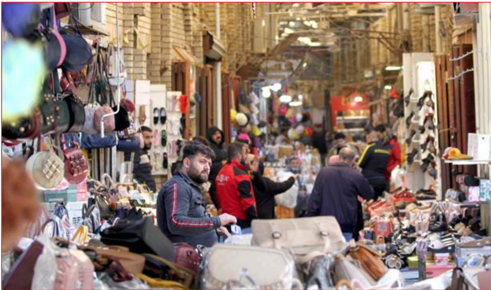
شارع النهر في ظل كساد الأسواق...

2021 بالاتفاق مع الحكومة لتلافي أي خلاف بين السلطتين التنفيذية والتشريعية. ومن أهم التغييرات التي ستقدمها اللجنة البرلمانية على قانون الموازنة هو تغيير سعر برمبل النفط، ومراجعة ضرائب الدخل التي فرضت على رواتب الموظفين والمتقاعدين، لتقليل عجز الموازنة الاتحادية. ويضيف كنا، أن "اللجنة المالية النيابية ستراجع كل فقرة من فقرات قانون الموازنة في سبيل خفض النفقات"، مشدداً على أن