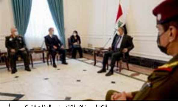
الكاظمي خلال لقائه وزير الدفاع التركي يوم أمس □ بغداد / المدى

أكد رئيس مجلس الوزراء مصطفى الكاظمي، أمس الاثنين، أهمية ترسيخ مبدأ احترام سيادة العراق على جميع أراضيها، جاء ذلك خلال لقائه وزير الدفاع التركي خلوصي أكار. ونكر المكتب الإعلامي لرئيس الوزراء، في بيان تلقت (المدى) نسخة منه، أن الأخير، استقبال، وزير الدفاع التركي خلوصي أكار، والوفد المرافق له، وشهد اللقاء، بحث القضايا ذات الاهتمام المشترك، وتعزيز التعاون العسكري بين العراق وتركيا ضمن إطار التعاون العام، وترسيخ مبدأ احترام سيادة العراق على جميع أراضيها. وأكد رئيس الحكومة، على ضرورة "تفعيل ما سبق إقراره من اتفاقيات بين الجانبين خلال زيارته الأخيرة إلى أنقرة، فضلاً عن أهمية الالتزام التركي بتنفيذ التعهدات الاستثمارية التي تمخض عنها مؤتمر الكويت لدعم العراق عام 2018". كما شدد على "رفض العراق أي تهديد أو نشاط إرهابي يستهدف الجارة تركيا، إنطلاقاً من الأراضي العراقية".