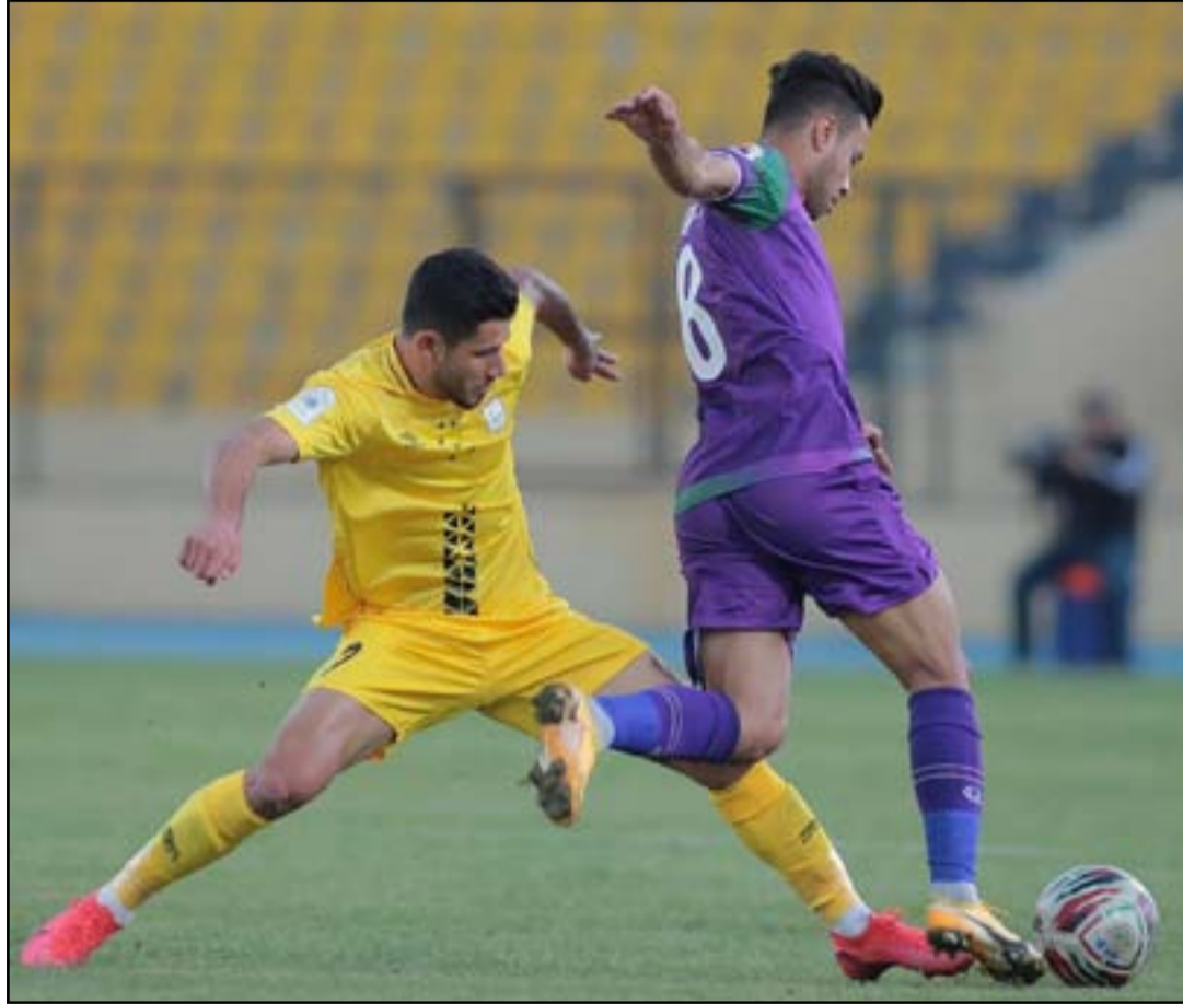
الشرطة وأربيل يطمحان لتحقيق نقاط الأطمئنان في الجولة السابعة عشرة

الوسط بيدرينهو حيث قلص الفارق مع مضيئه فريق باكوس دي فيريرا الذي كان متقدماً بهدفين منذ الشوط الأول من المباراة إثر هدفين سجلهما