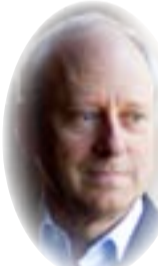
مايكل ساندل x