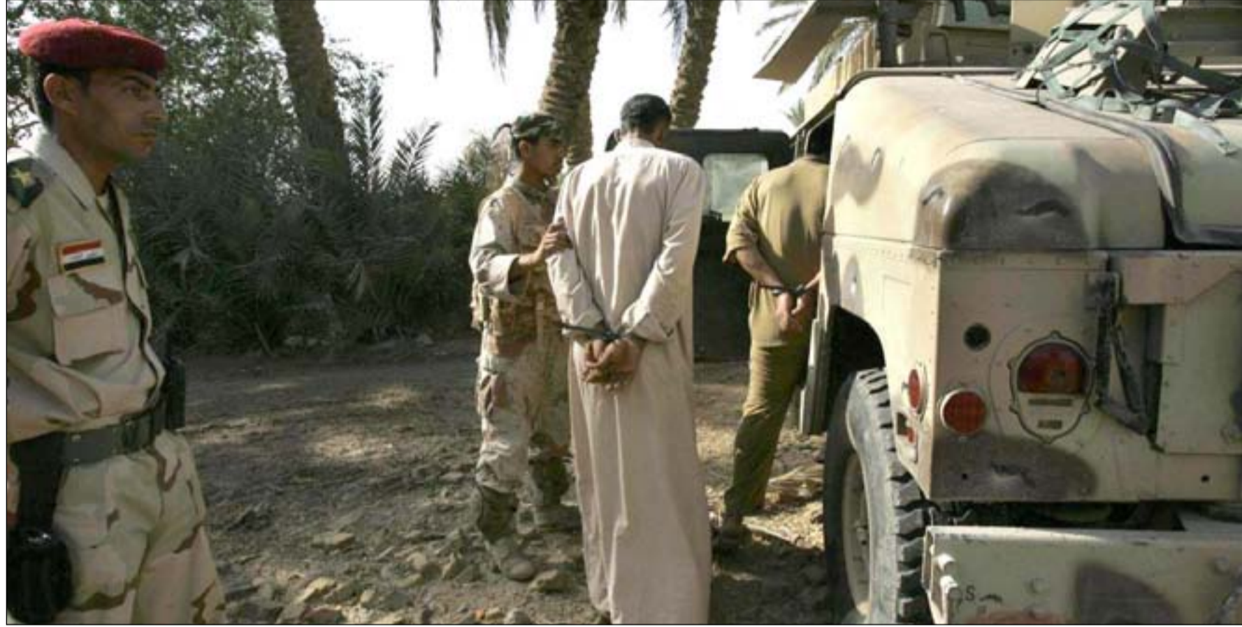
قوة عسكرية في أبو غريب

في الاسابيع الاخيرة من العام الماضي، بدأت تظهر في مناطق غربي بغداد "تحركات مريبة"، لكن لم يتم التعامل معها بجديّة حتى انفجار ساحة الطيران في الشهر الماضي. وبنفس الطريقة تباطأت القيادة العسكرية بسد الثغرات في شرقي ديالى، وهو ما دفع بقايا التنظيم الى شن الهجمات ونصب الكمائن اسبوعيا ضد القوات الامنية.