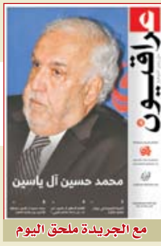
مع الجريدة ملحق اليوم