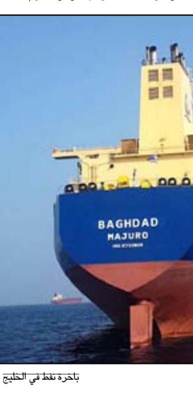
بأخرة نفط في الخليج

واكد وزير النفط احسان عبد الجبار، في وقت سابق، أنه "سيبقى ملتزماً بقرارات أوبك بلاص وسيغوض عن الإفراط في الإنتاج". واشتكت الهند من أن التخفيضات الأخيرة في الإنتاج من جانب بعض دول اوبك خلقت حالة من عدم اليقين للعمالء وأدت إلى ارتفاع في الأسعار العالمية للبترول. وقالت المصادر إن سومو خفضت الإمدادات لشركة نفط إنديان، أكبر مصفاة في الهند وأكبر عميل هندي لها، بنسبة ١٠٪ إلى نحو ٣٥٠ ألف برميل يوميا لجميع درجات خام البصرة الثلاث، في حين انخفض حجم مصفاة مانجالور والبتروكيموايات المحدودة بنسبة ١٧٪ إلى ٥٠ ألف برميل يوميا.