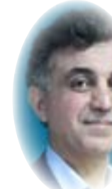
د. فارس كمال نظمي

أخرى- يضرب بقوة في أذهان أقطاب العملية السياسية الفاشلة (بما فيها الذهن الحكومي المتخاذل والمفتون باستبدال الأفعال الملموسة بالأقوال الإنشائية الفارغة)، ليترك لديهم تشوهات تخديرية إدراكية عميقة تمدّمهم بـ"نعمة" الإنكار لكل عوامل التغيير المتفاعلة جذرياً في مرآة الزمن الاجتماعي. فتشاهداهم على شاشات التلفاز وفي المؤتمرات الصحفية وفي تغريداتهم الإلكترونية المرتبكة وهم يحدقون - كخيار بليد وحيد- بساعة الزمن الفيزيائي بحثاً عن تمديد أو تأجيل لموعد انتخابات مبكرة ستشكّل في حال فشلها -المتوقع جداً- نقلة جديدة نحو بزوغ وعي احتجاجي أشد جذرية وتمسكا بالتغيير مما سبقه.