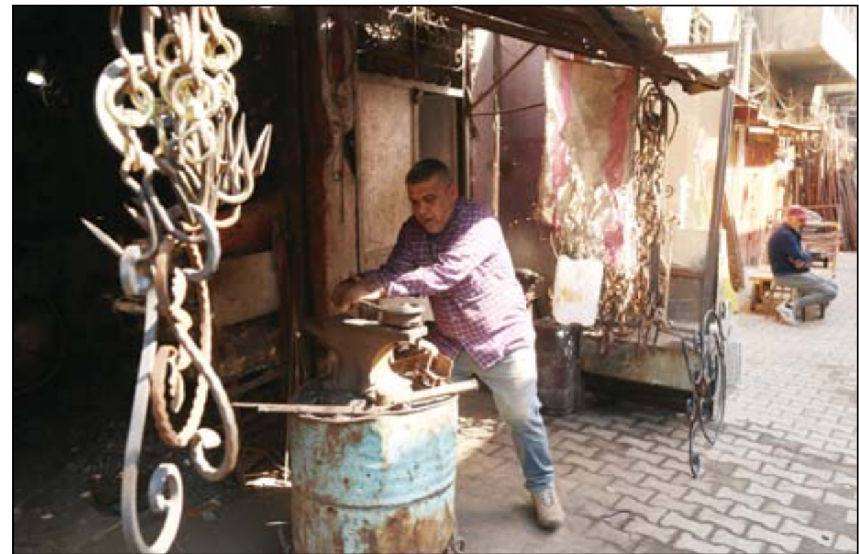
بعد الاعلان عن الحظر.. الاحياء الصناعية تشهد كساداً...

نائب سابق: المناطق المحررة بحاجة لفرص عمل