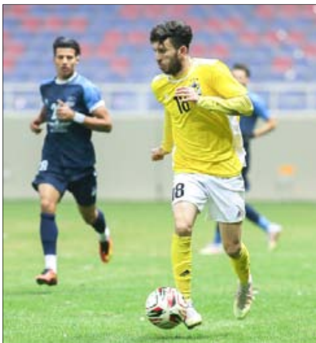
إدارة الجوية ترغب بإقامة دوري أبطال آسيا في البصرة