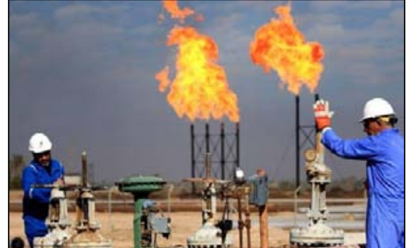
عن موقع ذي ناشنال

بالمقارنة مع دولة الإمارات، ثالث أكبر منتج في