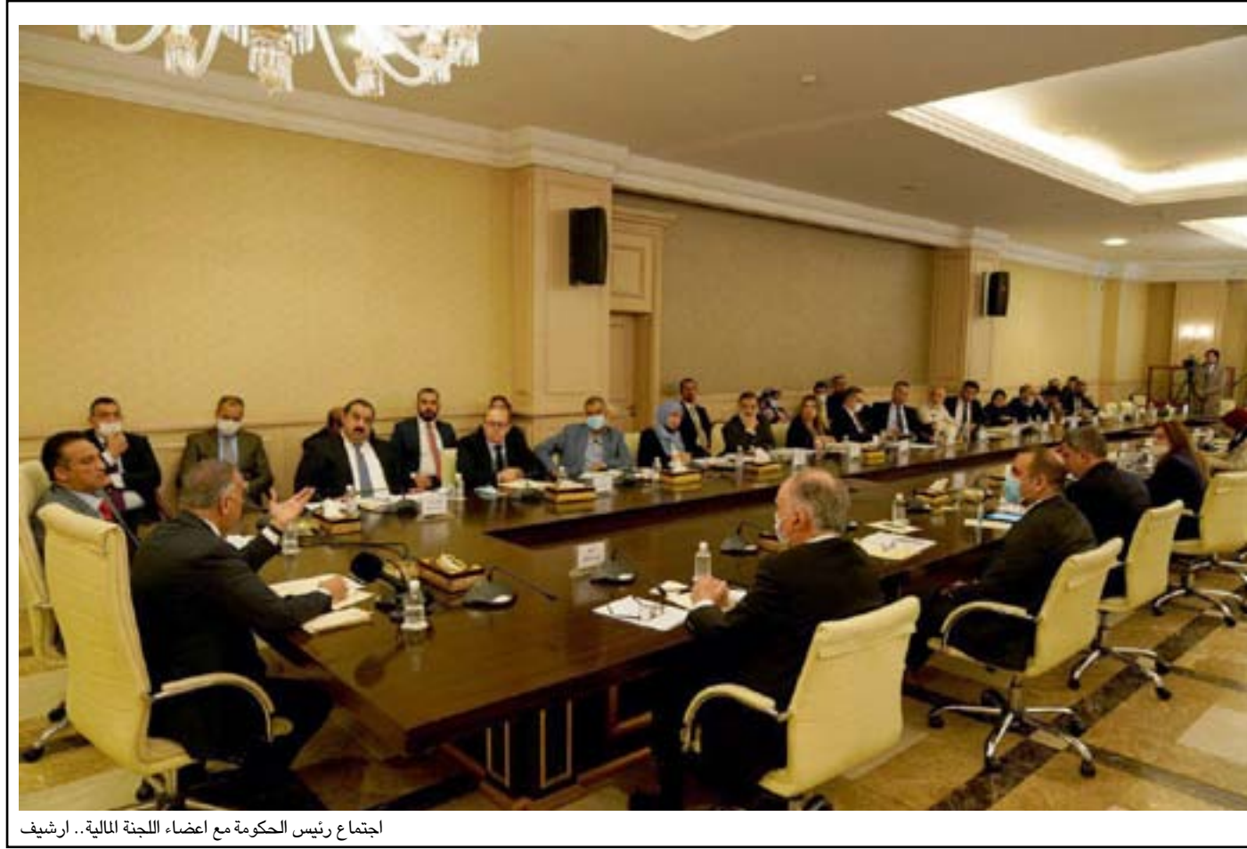
اجتماع رئيس الحكومة مع اعضاء اللجنة المالية.. ارفشيف

وكانت اللجنة المالية في مجلس النواب قد أشرت في وقت سابق جملة من النقاط الأساسية في مشروع قانون الموازنة المالية العامة لعام ٢٠٢١، ومنها نسبة العجز الكبيرة والاستقطاعات المفروضة على رواتب الموظفين وحجم التخصيصات المالية للمحافظات، وأكدت على أهمية معالجة العجز.