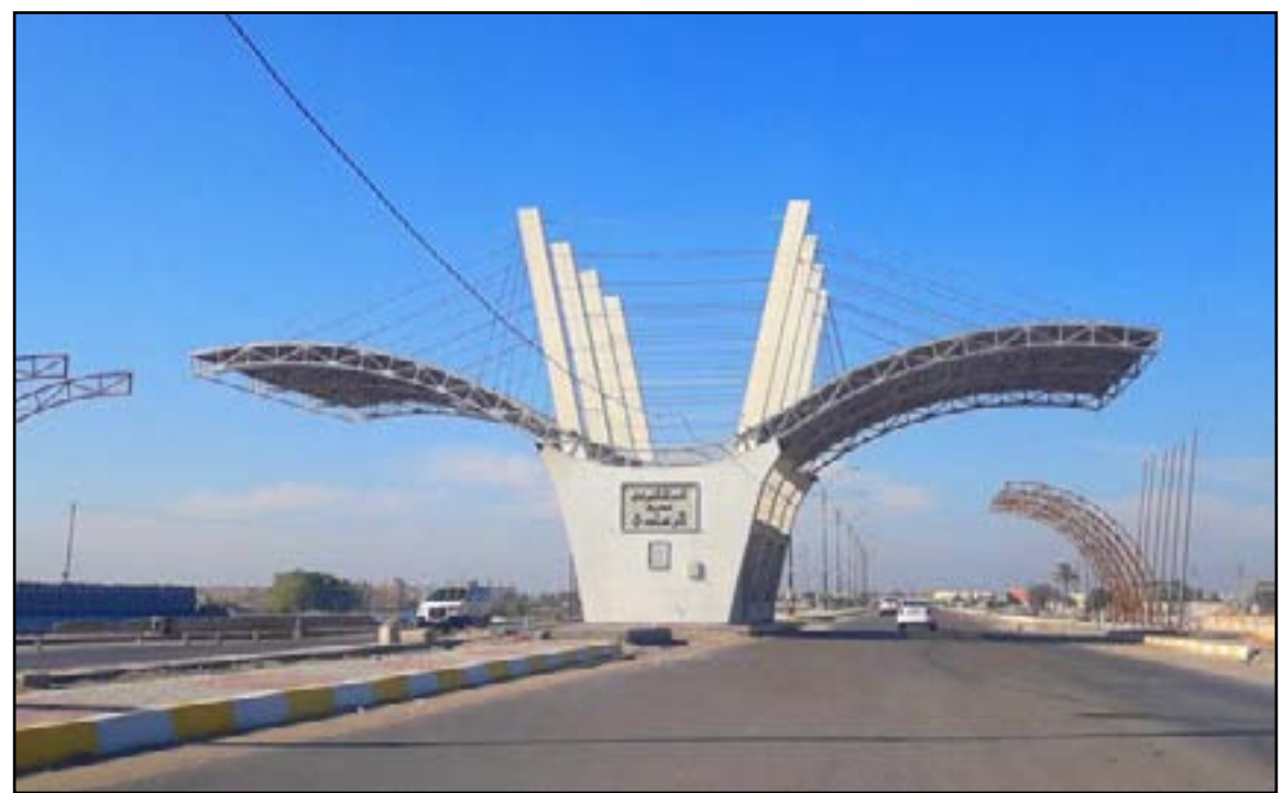
أحد شوارع مدينة الرمادي

تريليونين لمشاريع تنمية الأقاليم لكل محافظات العراق، وهي قليلة جداً مقارنة بما تم وضعه عام ٢٠١٩. لا يمكن لها أن تتولى المشاريع القائمة". وتبين فرحان، أن تخصيص ٥٠٪ من المنافذ الحدودية للمحافظات التي لديها تلك المنافذ هي مادة قانونية ليست لها علاقة بالموازنة، ويجب أن تستمر وتدفع كل شهر".