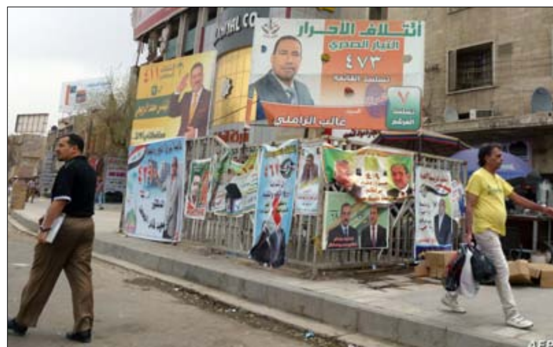
لافات انتخابية سابقة.. ارشيف

داخلية، ترتبط أساساً بعقود الوزارات والمشاريع الاستثمارية التي تحصل عليها الأحزاب إثر مشاركتها في تشكيل الحكومة ضمن المحاصصة السياسية المعمول بها في مرحلة ما بعد ٢٠٠٣، وتحديد الكتل الكبيرة، وبين مصدر آخر خارجي، حيث ينال مرشون دعماً مالياً من رعاتهم الإقليميين، خصوصاً السعودية وإيران. في حين يؤكد المرشح (ص.أ) أن الخطوة الأولى للسباق الانتخابي بدأت فعلاً بالنسبة إلى الأحزاب الكبيرة عبر توزيع بعض الهدايا الثمينة مثل المسدسات وما شابه، إضافة إلى مواد غذائية وملابس وهدايا متنوعة مع شراء ندم بعض الإعلاميين والأدباء والشعراء فضلاً عن رجال الدين. يرى (ص.أ) أن الأحزاب