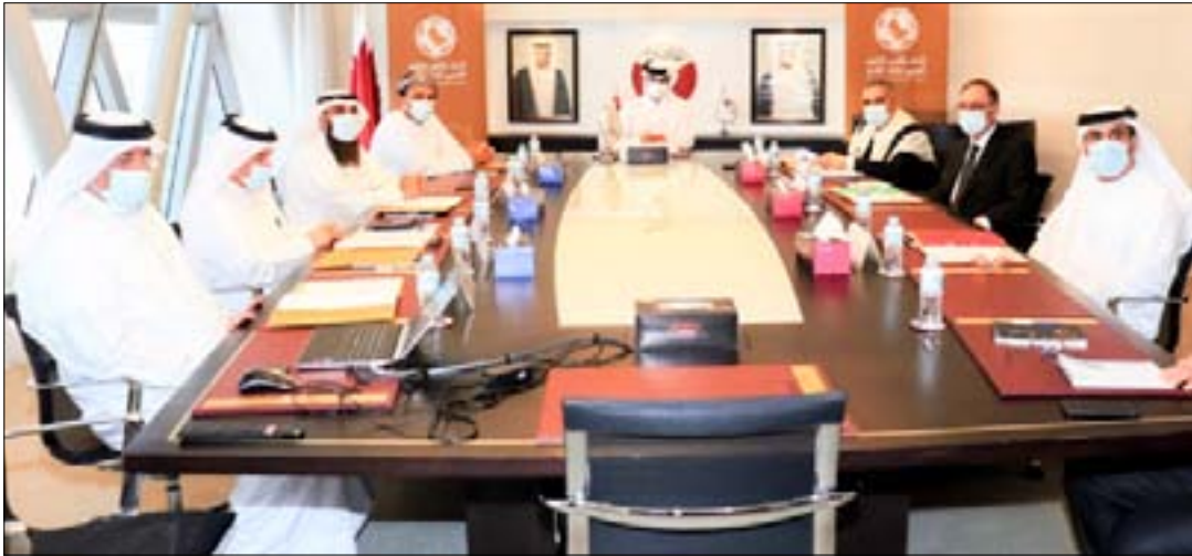
العراق يدرس شروط الاتحاد الخليجي لتنظيم البطولة ٢٥ في البصرة

وشعوره بالأمان التام بدد مثل هكذا شعور، فضلاً عن أن الإجراءات الاحترازية لمنع انتشار الفايروس مستمرة ولا تقلق أهل المدينة أو الزائرون".