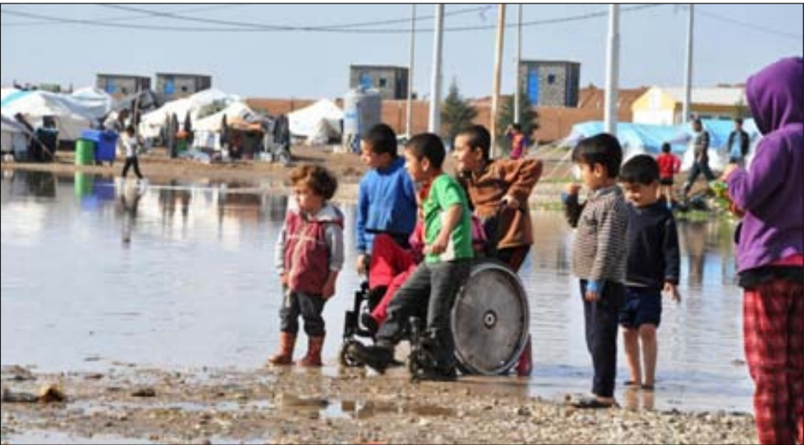
نازحون في احد المخيمات... أرشيف

وكانت العمليات العسكرية التي شنتها القوات العسكرية العراقية لطرد مسلحي داعش من العراق بمساعدة من التحالف الدولي وقوات الحشد الشعبي والتي امتدت من عام ٢٠١٤ الى ٢٠١٧ قد تسببت بنزوح ما يقارب من ٦ ملايين شخص غالبيتهم من محافظات في شمالي البلاد وغربها بضمّنهما محافظات نينوى والبادية وصلاح الدين، ومع عودة ٤,٧ مليون نازح لمناطقهم ما يزال هناك ١,٤ مليون شخص في حالة نزوح منتشرين في عدة مخيمات في محافظة نينوى وإقليم كردستان.