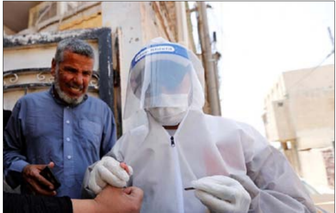
فرق جولة للكشف عن اصابات كورونا.. أرشيف

وكانت وزارة الصحة والبيئة قد سجلت أمس الأول إصابات رسمية بالفايروس المتحور من كورونا، مؤكدة امتلاكها الإمكانيات الفنية لمواجهة، واتخذت قراراً بتزول فرقها الصحية إلى المناطق والشوارع لفرصها على غير الملتمسين بالإجراءات الوقائية.