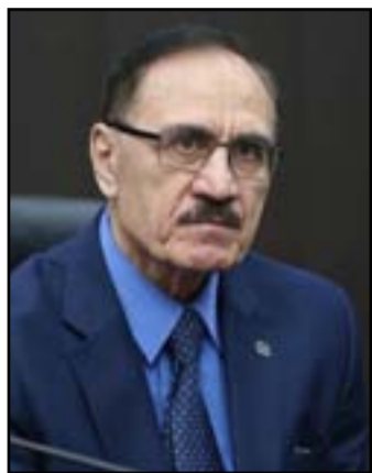
د شامل كامل

وعن سبب عدم الاجتماع مع الهيئة العامة قبيل موافقة الفيغا على النظام الجديد، قال: "أولاً عمل التطبيقية بموجب مسار مُحدّد من الفيغا وليس وفقاً لنهجها، وثانياً سيكون هناك مؤتمر للعمومية لغرض المصادقة النهائية على النظام الأساسي 2020 ولديهم كامل الحرية للتأييد أو الاعتراض على كل فقرة فيه، ويمكن إعادته الى الفيغا لبيان رأيه حول أي ملاحظة".