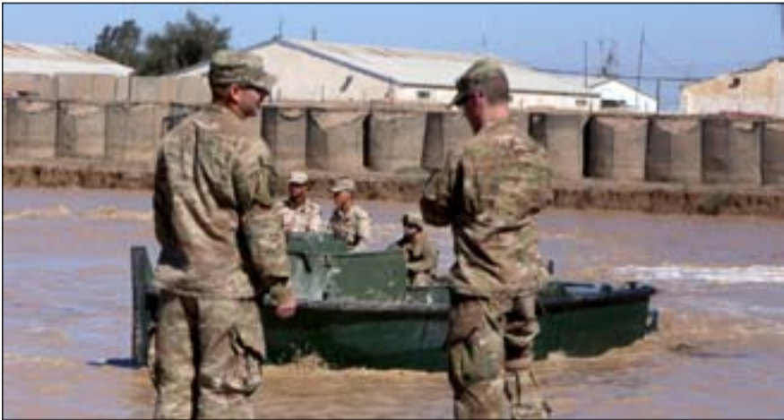
قوات حلف الناتو في العراق... أرشيف

تحسين إدارة القدرات البشرية وتدريبها، السياسة والاستراتيجية، قانون الاشتباك المسلح، القيادة، المرأة، السلام والأمن، والعمل بحرفية في التهيئة الطبية، ضمن الوزارة والتربية العسكرية في الكلية العسكرية العراقية، نظراً لأن الكليات العراقية كانت بحاجة للتجديد وتغيير برنامجها". وعتت قائدة قوات الناتو في العراق، الإصلاح في مجال الأمن موضوعاً هاماً، وقالت: "من الضروري جداً الحكومة الكاظمي، أن تشجع على إجراء الإصلاح في مجالات الأمن، وقد لسننا اهتماماً خاصاً من الكاظمي ببعض منها، مثل مكافحة الفساد داخل وزارة الدفاع التي يقوم الكاظمي بإجرائها حالياً".