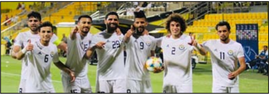
تغاول زوراني يعبور الوحدة في العاصمة الامارتية ابو ظبي