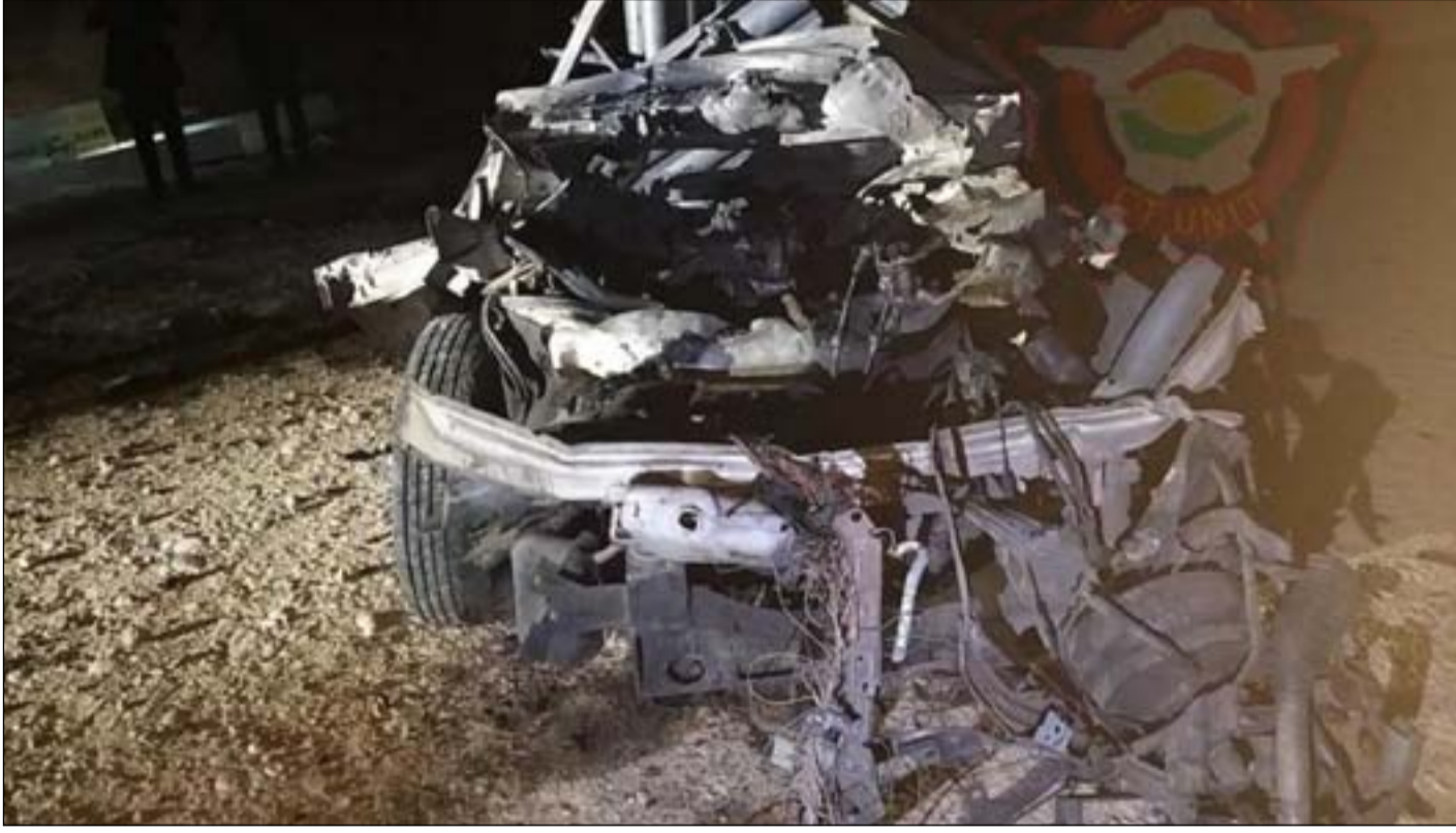
الركبة التي أطلقت منها الصواريخ التي استهدفت مطار أربيل

14 صاروخاً سقط على القاعدة والأحياء القريبة؛ إصابة 7 مدنيين بينهم نازح