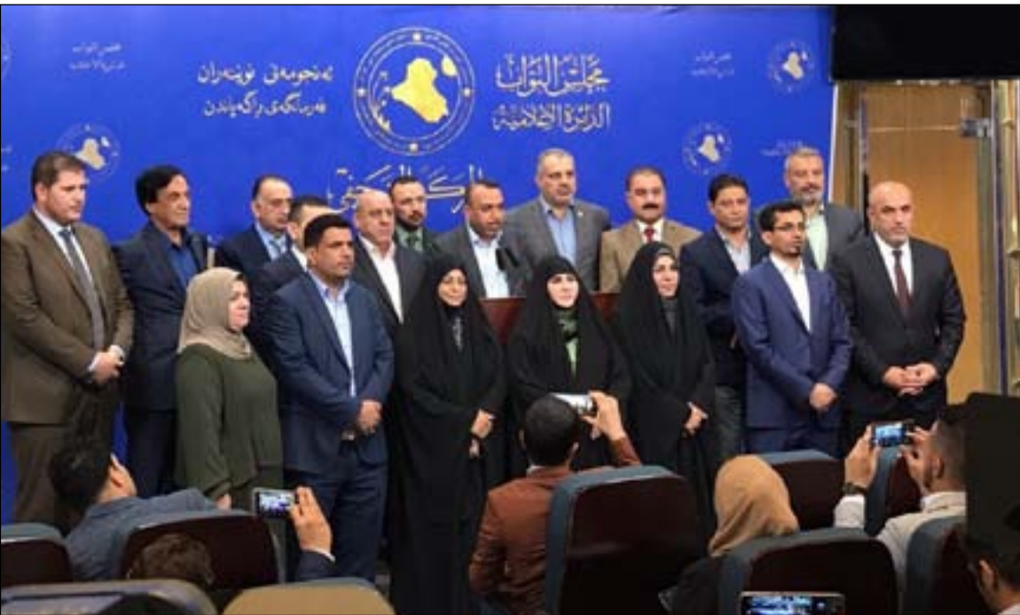
مؤتمر سابق لتحالف الفتح

وأضافت: "تشير الإحصائيات الإجمالية للتحالفات السياسية المسجلة لدى المفوضية 29 تحالفا منها 25 تحالفا مصادقا عليه في عام 2018 ايدت 6 تحالفات منها الرغبة بالمشاركة في الانتخابات النيابية المقبلة، وسجلت 4 تحالفات فقط و9 تحالفات قيد التأسيس في عام 2021". وأكمل: "في السياق ذاته عملت المفوضية بجهود حثيثة على تسهيل اجراءات تسجيل الأحزاب والتحالفات عبر التنسيق مع الجهات الساندة لعملها، ومنها (الهيئة الوطنية العليا للمساعدة والعدالة، ووزارة الداخلية/الأدلة الجنائية، هيئة