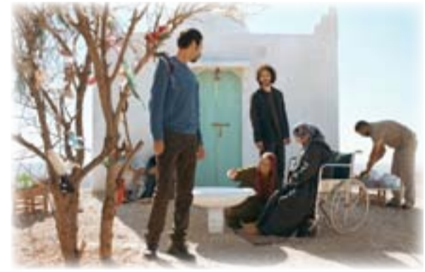
لقطة من فيلم "سيد الجهول" 2019

أعلنت مؤسسة الشارقة للفنون عن انطلاق سلسلة أفلام ربيع 2021، والتي تقام عروضها في ابتداء من الجمعة القادم.