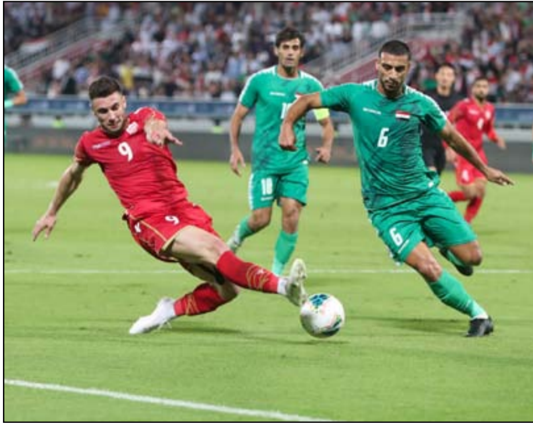
منافسة حامية للظفر بتضييف مباريات المجموعة الثالثة بالتصفيات المشتركة

الاجتماع الطارئ وأرتفع عدد الاتحادات الراغبة بإقامة الجولات الأربع الأخيرة إلى اثني عشر أثر تقديم اتحاد النيبال طلبه الرسمي إلى الاتحاد الآسيوي لكرة القدم بعد اتحادات العراق وإيران والبحرين وأستراليا والسعودية وأوزبكستان والإمارات وقطر وعمان وماليزيا والصين بالتشاور مع دولها حتى ساعة متأخرة من أمس الأربعاء متأخرة من أسس لجنة المسابقات القارية في ظل تواجد الأبناء عن ارتفاع الطلبات خلال الفترة المقبلة قبل الإعلان الرسمي يوم الخامس عشر من آذار المقبل بخصوص البلدان المضيفة لمباريات تلك الجولات بعد الاطلاع على الضمانات وتنفيذ الشروط التي تم مناقشتها خلال الاجتماع الطارئ وخاصة بشأن الفعالة الصحية التي يتم تنفيذها على الفور بعد وصول المنتخب المنافسة إلى مطار المضيف قبيل الدخول في المنافسات الحقيقية خلال المدة من الثالث ولغاية الخامس عشر من شهر حزيران المقبل التي ستجري بنظام التجمع من أجل وصولها في النهاية إلى بر الأمان مثل نسخة 2020 من دوري أبطال آسيا لكرة القدم وكأس العالم للأندية لكرة القدم في العاصمة القطرية الدوحة.