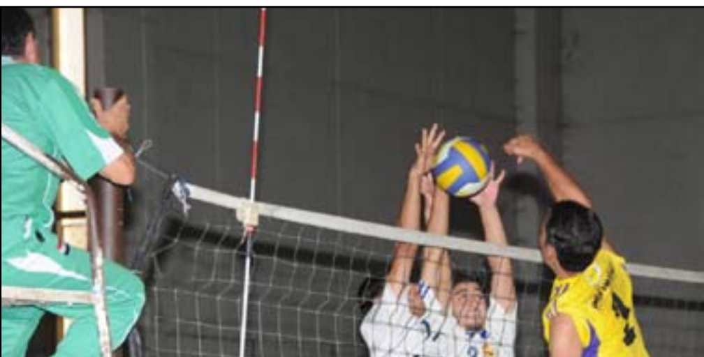
تأجيل جديد بطال دوري الطائرة الممتاز موسم 2020-2021