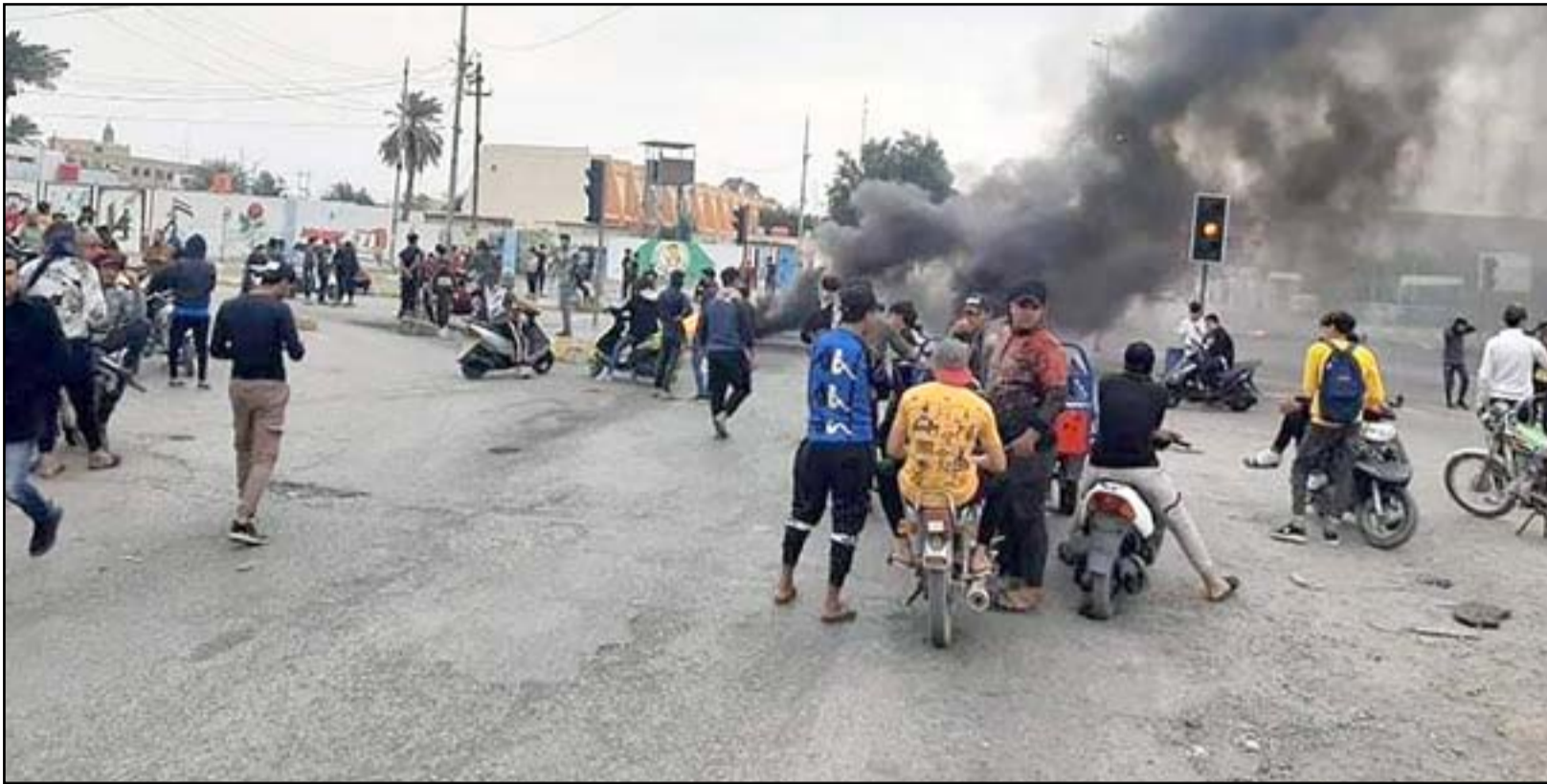
تظاهرات في الكوت... ارفيف

واضاف الزركاني: "لم يصدر من القوات الامنية اي تصرف غير مهني، حيث كانوا يحملون فقط الهراوات والدروع في حين ان البعض ممن يدعي السلمية