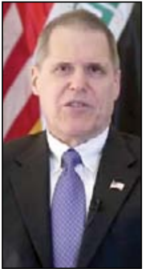
السفير الأميركي ماثيو تولر