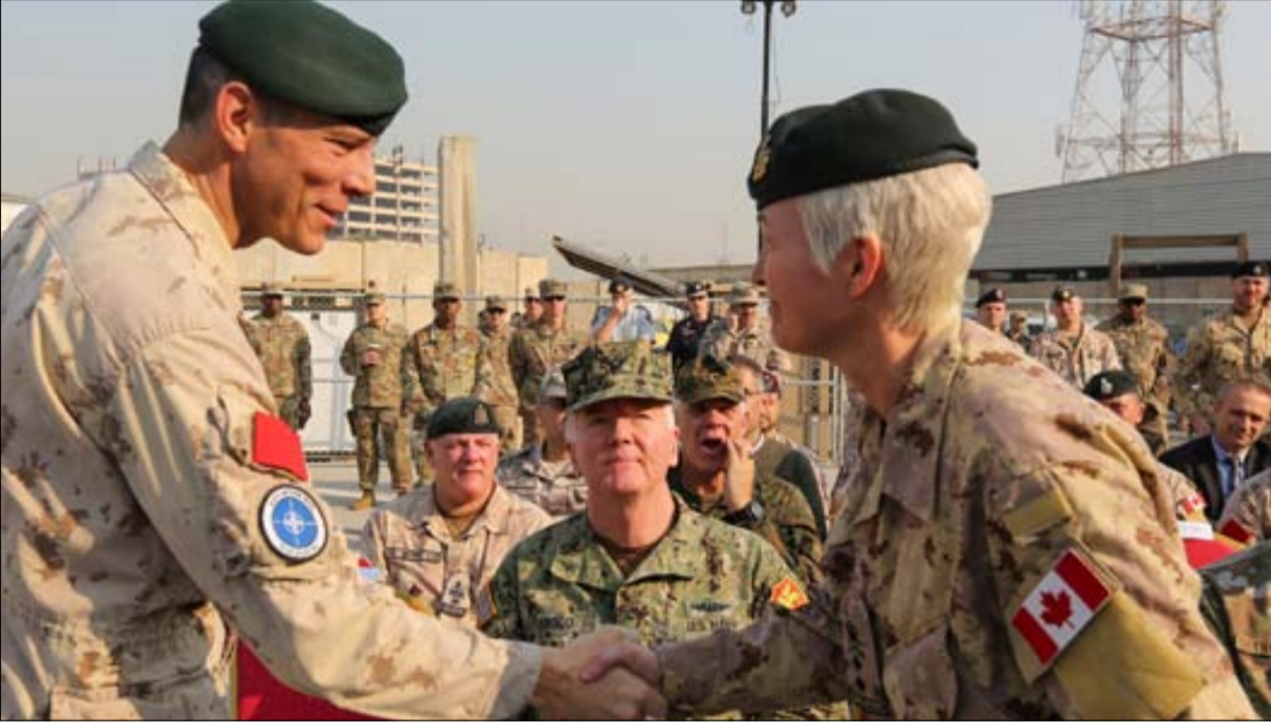
قوة من حلف الناتو في العراق... ارشيف

زادت فصائل مسلحة من استعداداتها بعد ٢٤ ساعة من استهداف السفارة الاميركية في بغداد، بينما لا يبدو هناك رد من واشنطن حتى الآن. وقبل نهاية ٢٠٢٠ كانت خيارات اميركا بضرب الجماعات التي تقصف سفارتها في العراق، عالية جدا قبل ان يغادر دونالد ترامب البيت الابيض.