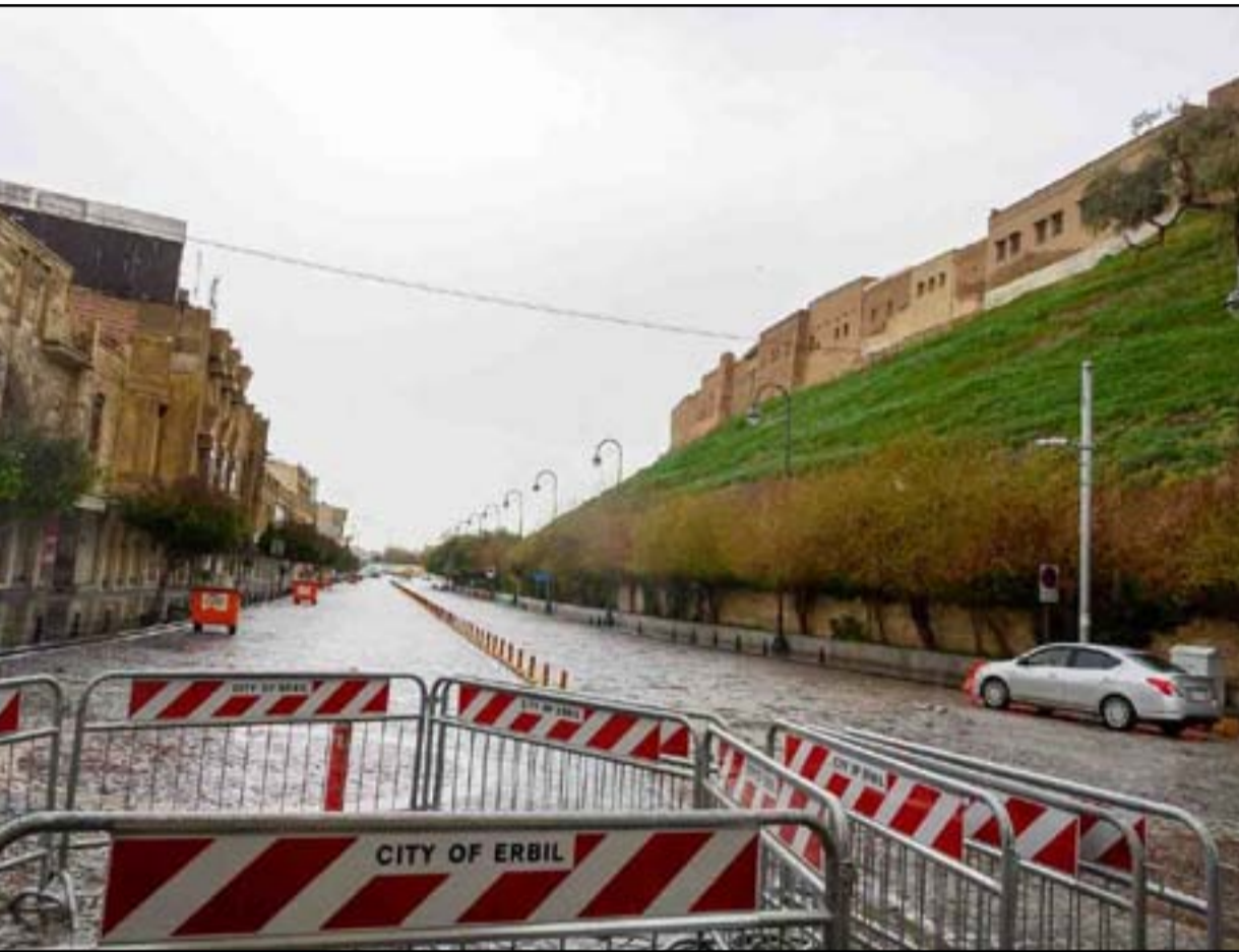
إقليم كردستان على خطى بغداد.. إجراءات مشددة وحظر دخول السائحين

زادت فصائل مسلحة من استعداداتها بعد ٢٤ ساعة من استهداف السفارة الأميركية في بغداد، بينما لا يبدو هناك رد من واشنطن حتى الآن. وقبل نهاية ٢٠٢٠ كانت خيارات أميركا بضرب الجماعات التي تقصف سفارتها في العراق، عالية جداً قبل أن يغادر دونالد ترامب البيت الأبيض.