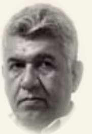
طالب عبد العزيز

ونحن نتصفح السيرة الشخصية لصنّاع التاريخ الإنساني، غالباً ما نقع على حياة مفرطة في واقعيتها لرجال دين وسياسة وثقافة وغيرهم، هناك مخلوقات أممية بكل معنى الكلمة، تطلعنا بين الصفحات، لهم حياتهم العامة والخاصة، التي تشبه حياتنا في معظم مفاصلها، حياة تتساقق معنا في السلوك والعادات والأكل والشرب، وفي ما يرتدي أصحابها من الثياب وما يحصل لهم في مناسبة ما، وفي وقوعهم بين جادتي الصواب والخطأ، ضمن نظام أو بلا نظام، خارج المركزية التي تُرسم لهم، أو ترفضها طبيعة الحياة العامة والبروتوكولات، وبمعنى آخر هناك فسحة من الحرية، قد تكون أكبر مما كان مخططاً لها.