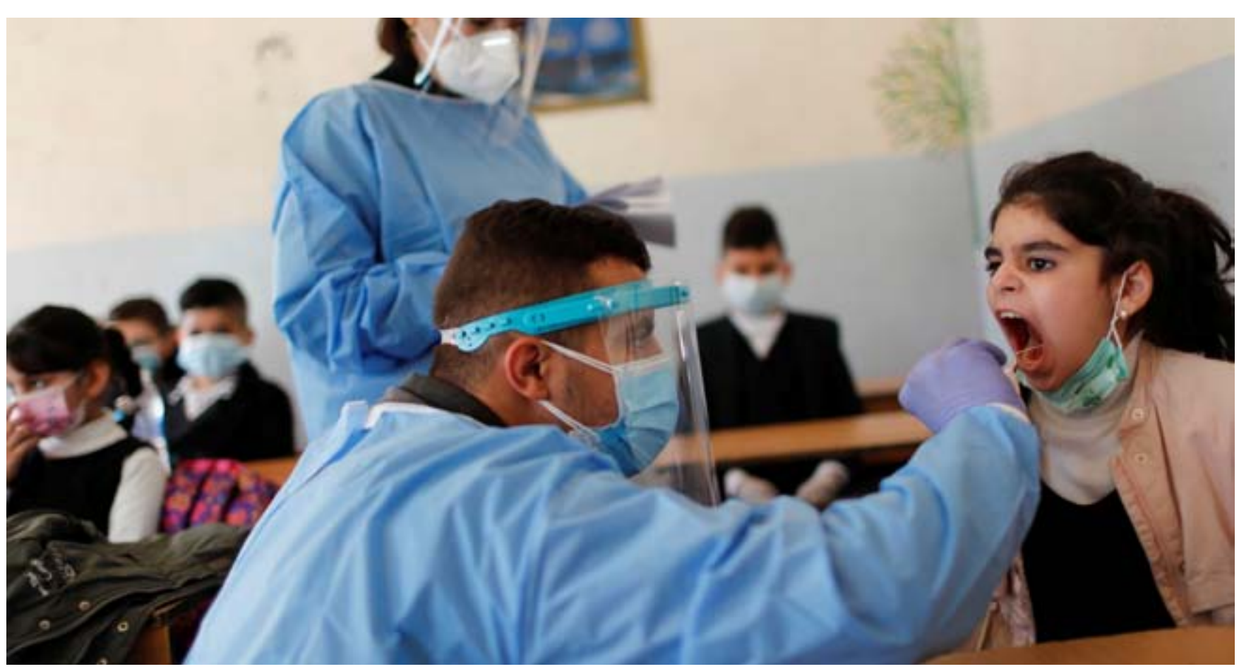
فريق من الصحة خلال جولات فحص كورونا.. أرشيف