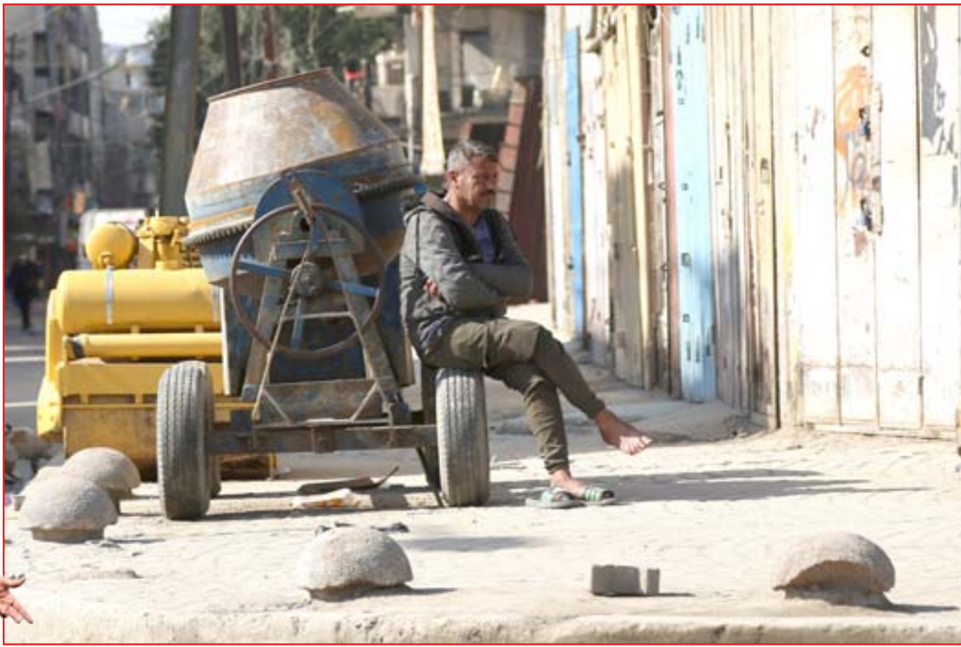
عمال العراق بلا رواتب والحظر يلاحق مصدر رزقهم...