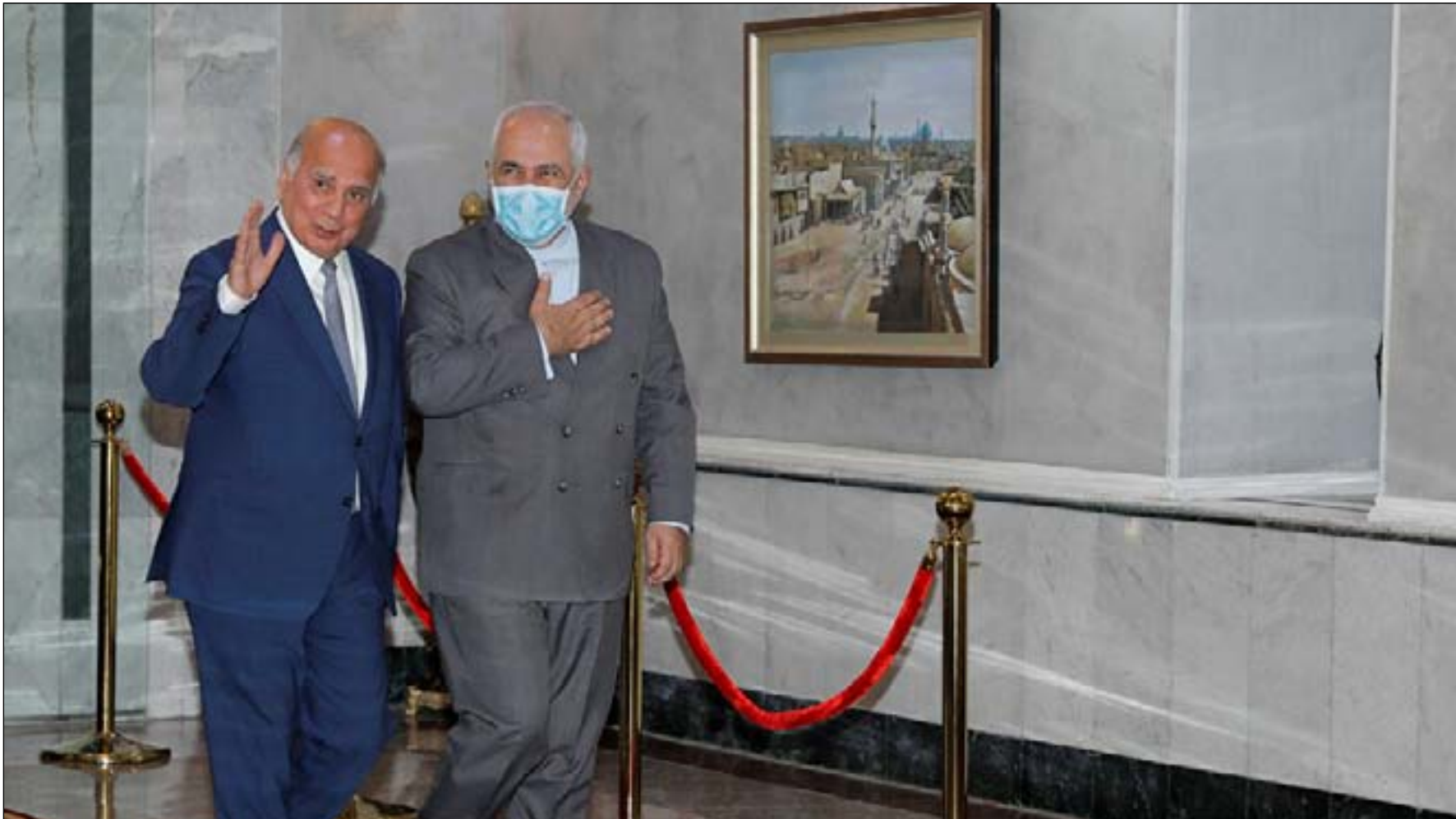
لقاء وزير الخارجية العراقي ونظيره الإيراني

وأشار كيري، في مقابلة مع وسائل اعلام غربية، إلى أن الغارة "استهدفت فصائل مسلحة شيعية يُعتقد أنها متورطة في الهجمات الأخيرة التي استهدفت الأميركيين وشركاءهم في