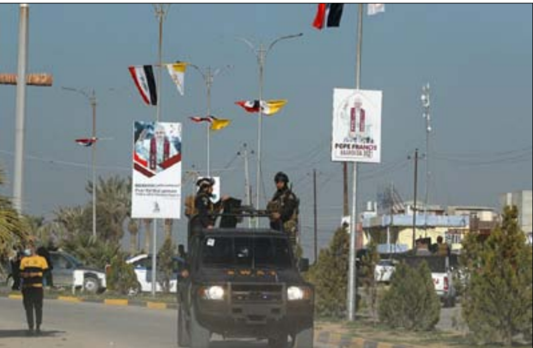
لائحات بابا الفاتيكان في قرة قوش

في مدينة الموصل، هناك اربع كنائس تمثل حقبا تاريخية مختلفة تحتل مساحة صغيرة من المكان ومحاطة ببيوت ذات ارتفاع واطئ، ستكون ضمن برنامج جولة البابا فرانسيس في 7 آذار خلال زيارته التاريخية الى العراق، يطلق عليها اسم "ساحة الكنييسة" أو حوش البيعة. في غضون ايام قليلة متبعية، من المتوقع ان يدخل البابا فرانسيس التاريخ بكونه أول بابا فاتيكان يزور العراق.