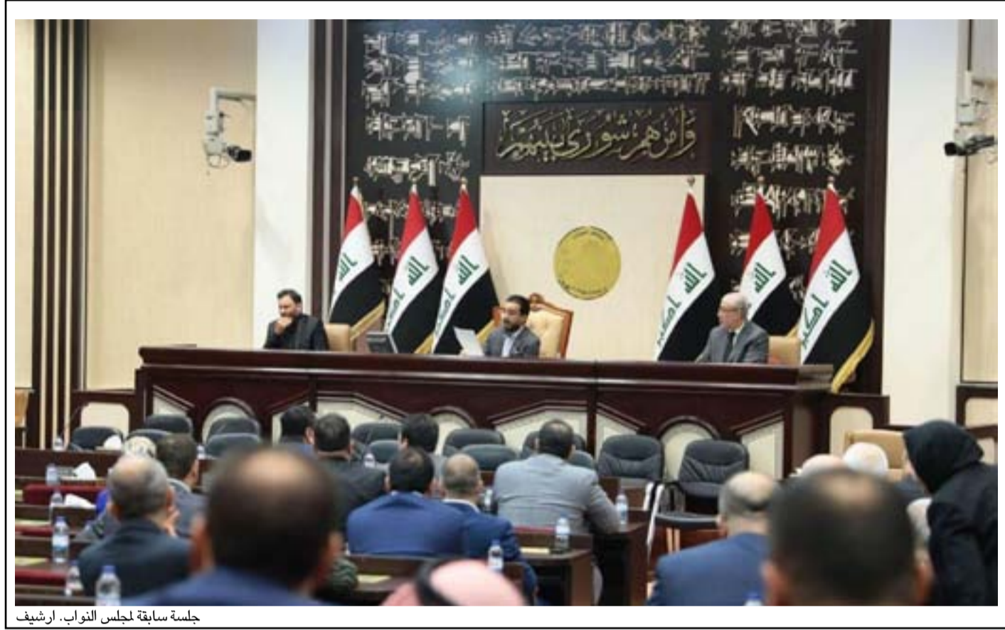
جلسة سابقة لمجلس النواب. أرشيف