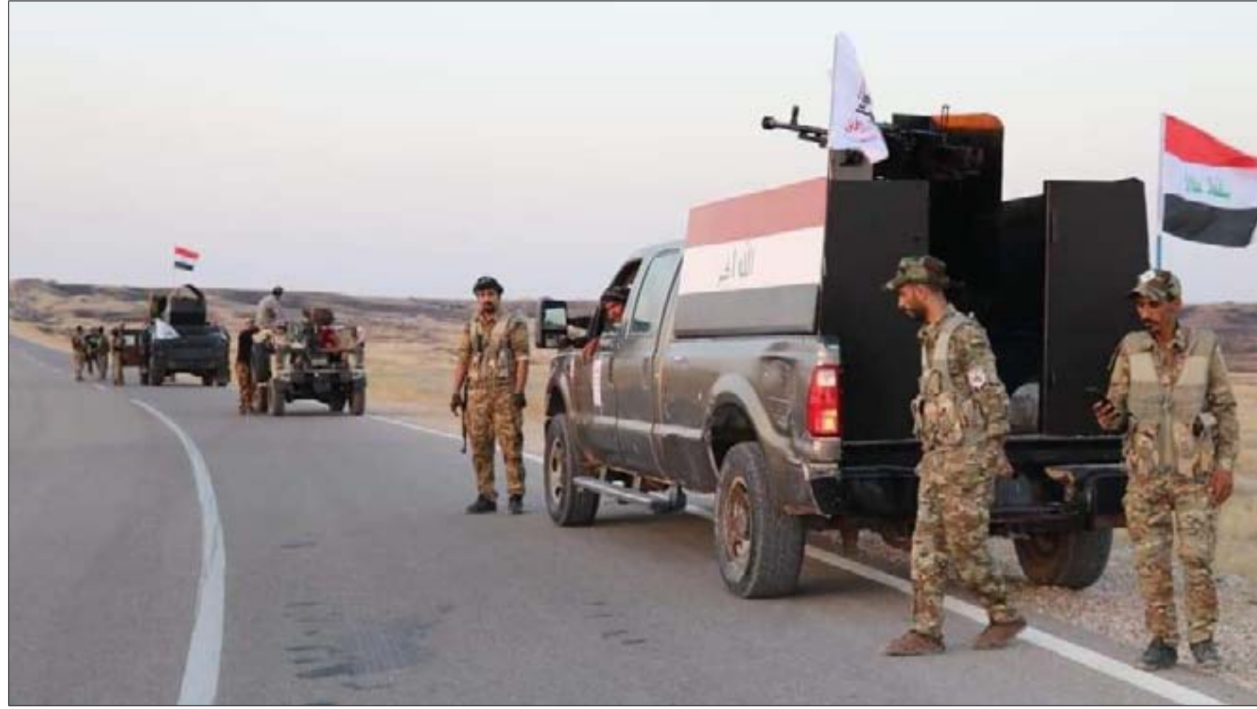
قوة عسكرية قرب حميرين ... ارشيف

الاتحادية واقليم كردستان، حيث ابعدت "البشمركة" من هناك قبل اكثر من ٣ سنوات. ويقول آزاد شفي النائب عن خانقين: "التنسيق بين الاتحادية و"البشمركة" سيقصص تلك الهجمات لكن الخلافات السياسية تمنع الوصول الى اتفاق". وكانت وزارة البشمركة، قد كشفت في وقت سابق، عن اتفاق مع الحكومة الاتحادية على تشكيل قوات مشتركة لمعالجة الفراغات الامنية في الخطوط الفاصلة، لكن تنفيذ الامر لم يحن بعد. وقال الامين العام لوزارة البشمركة جبار ياور الاسبوع الماضي، في تصريح للوكالة الرسمية، إنه "من خلال التفاهات المشتركة جرى الاتفاق على معالجة الخطوط الفاصلة بين قوات البشمركة والجيش العراقي من خلال تشكيل قوة مشتركة بين الطرفين وجعلها خطوطا مشتركة لسد الفراغات الامنية الموجودة بين الخطين". واذاف ياور أن "هذا الاتفاق لم ينفذ لغاية الان"، وأن ما تم افتتاحه من مراكز مشتركة "هما المركزان الرئيسان فقط في بغداد واربيل بعدد ضباط اقل من المتفق عليه، فيما لم تفتح المراكز الأربعة المتبقية لغاية الان".