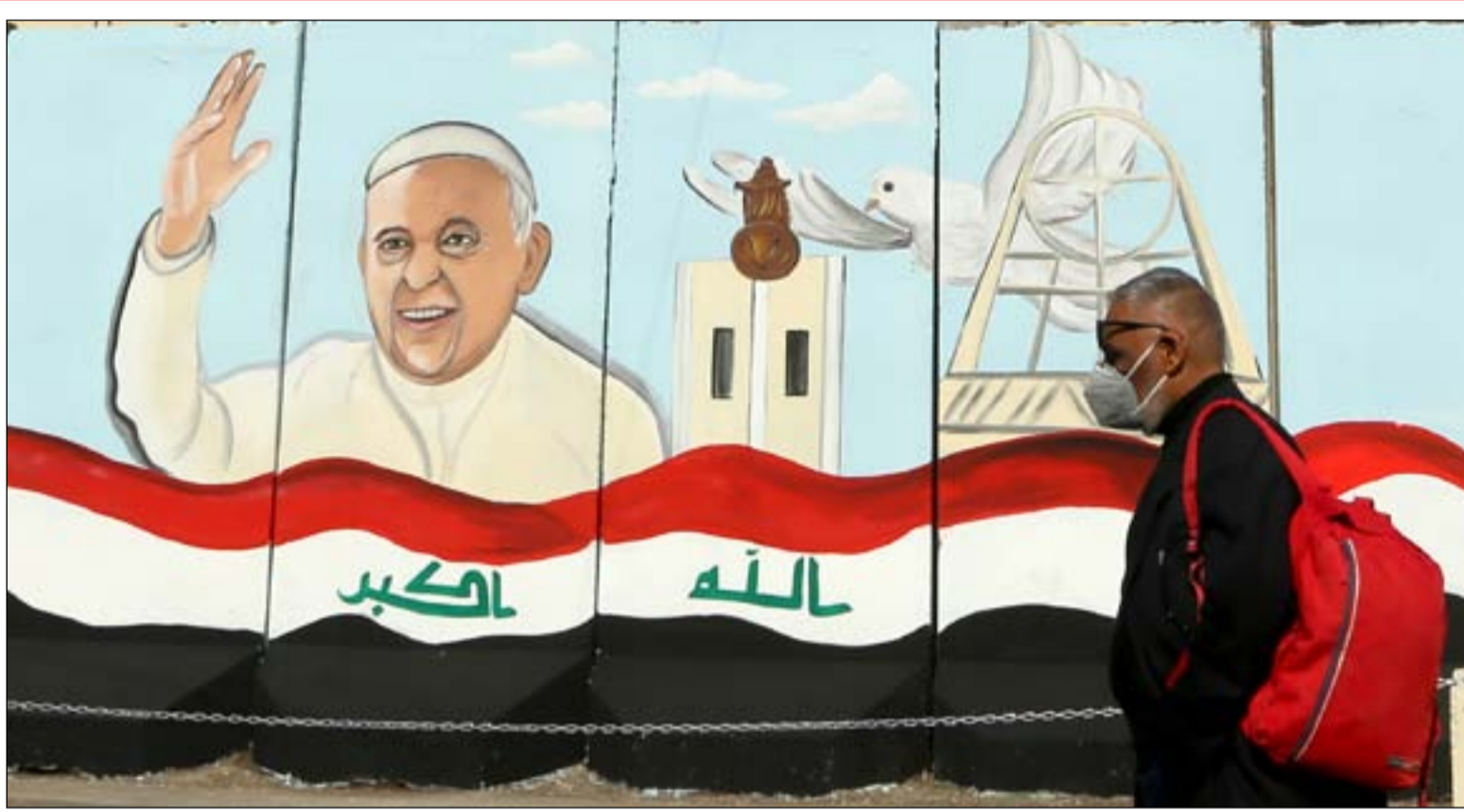
كوكريت بغداد يزين برسومات للبابا...