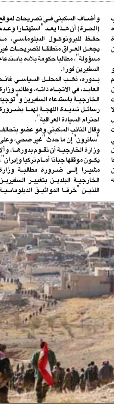
قوة من الحشد في سنجار... ارشيف