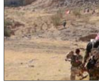
قوة من الحشد في سنجار... ارشيف

وخرجا عن مهام إدارة سفارة بلديهما في العراق". وتابع: "لا يمكن لسفير دولة في دولة أخرى التصريح ضد دولة ثالثة، فالأعراف الدبلوماسية تحتم أن تكون مثل هذه التصريحات صادرة عن وزارة الخارجية في كل بلد"، مطالبا البلدين أن يفضا صراعهما بعيدا عن الأراضي العراقية. من جانبه، قال العابد إن هذه "التصريحات مرفوضة جملة وتفصيلا"، مشيراً إلى أنها "تصرف لا يمثل الأعراف الدبلوماسية". وأردف: "تصرف وقح من قبل الطرفين"، لكنه قلل من مدى تأثير ماحدث على الواقع أو تكون التصريحات معبرة عن فقدان العراق لسيادته على الأرض. وبينما يقول النائب السكيني إن هذه التصريحات ربما تمثل "فجرا جديدا" للخارجية العراقية، فقد حذر من تصاريحات إردوغان من تهديد حركة النجباء بمهاجمة القوات العسكرية التركية في شمالي العراق. كذلك، هددت "عصائب أهل الحق" بأنها على استعداد "للتصدي لأي سلوك عدواني من جانب تركيا. وقبل أيام، أعلن وزير الخارجية الإيراني، محمد جواد ظريف، رفض بلاده لوجود تركيا في العراق وسوريا، واصفا سياسات أنقرة بـ"الخاطئة".