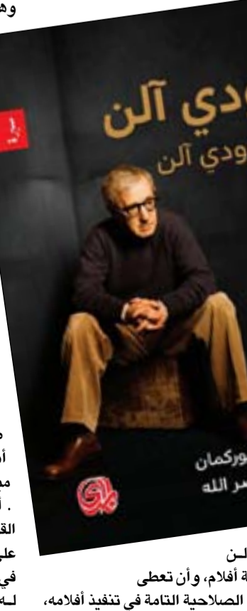
إعداد: سنيغ بيررمان ترجمة: دلال نصر الله

الأعمال الدرامية القوية مثل الجرائم والجنح والأزواج والزوجات . في مناقشة هذه الإنجازات ، نشارك آلن إلهاماته وقلقه وإحباطاته الشخصية والمهنية . يتخلل وودي آلن عن وودي آلن ذكرياته وأرائه: مشاهدة الأفلام بعد الظهر أثناء نشأته في بروكلين ؛ حكايات عن صناعة السينما . مناقشات للأفلام المفضلة ، والممثلات الأكثر إلهاما ، والمصورين السينمائيين ؛ حبه لموسيقى الجاز . سحره مع مدينة نيويورك . من اهتمامه الشاب بالسريرية غير المنطقية لتشارلي شابلن وماركس برانز إلى الشعر الغنائي لإنجمار بيرجمان ، تكشف المحادثات عن وودي آلن عن وودي آلن عن التأثيرات الواسعة لرؤية وودي آلن الانتقالية وتقربه ، بكل تعقيداته الضعيفة ، أكثر مما سبق . ولد وودي آلن عام 1935 وهو ممثل وكاتب سينمائي ومسرحي وعازف جاز أميركي أيضا . ويعيد أحد أبرز المخرجين في هوليوود . عرف بتقديمه الأفلام الرومانسية الكوميدية التي تتخللها محاكاة ساخرة وكوميديا