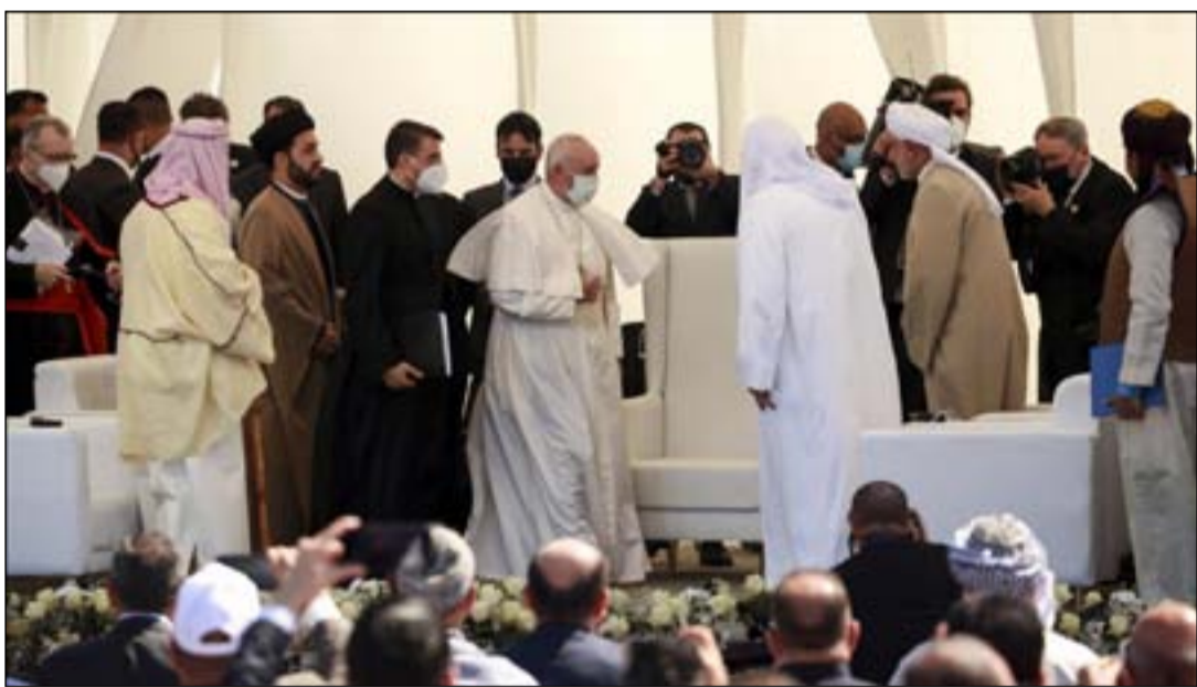
البابا فرنسيس في أور يوم أمس.

وجاء في كلمة البابا فرنسيس في ملتقى الأديان انه "يجب ان ننسى اخوتنا فنحن أحفاد النبي إبراهيم... أخوتنا تدفعنا للعيش بإنسانية، ويجب ان لا ننسى نوايا الإنسان الحسنة فمن