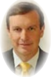
■ بقلم كريس ميرفي ترجمة عادل حبه

طهران ، إذ من الممكن لحوار أمني إقليمي يشمل جميع الأطراف أن يحل محل سباق التسلح والحروب بالوكالة. قد يبدو هذا وكأنه ضرب من الخيال، لكنه بعيد كل البعد عن ذلك، فقد بدأت البرامج الخضراء لهذا الحوار بالظهور منذ سنوات، ويمكن للقيادة الأميركية المقتردة، بتطبيق كل من الخل والعسل، وأن تشرع في إنشاء هيكل للانفراج، وعلى الرغم من أنه لا ينبغي للولايات المتحدة أن تمنح الإماراتيين أو السعوديين حق النقض (الفيتو) على اتفاقية نووية ثنائية مع إيران، فإن الحوار الإقليمي من شأنه أن يربط دول الخليج بشكل أقرب إلى الولايات المتحدة بشأن السياسة الإيرانية، ومن المرجح أن يعطي مجلس التعاون الخليجي مساهمة أكبر في التوصل إلى أي اتفاق مستقبلي.