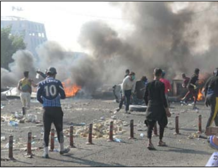
مظاهرون في الناصرية.. ارشيف

في وقت سابق لـ(المدى) ان عمار الحكيم- زعيم تيار الحكمة- يضغط على رئيس الوزراء لمنع تغيير المحافظ، كما انهم (المتظاهرون) رفضوا في وقت سابق لقاء مع الحكيم لمناقشة موضوع المحافظ. وينتمي حسن منديل الذي يدير محافظة بابل بالوكالة منذ اكثر من عام الى تيار الحكمة، بعد هروب المحافظ السابق التابع لدولة القانون كرار العبادي، وصدور حكم بالسجن الغيابي سبع سنوات لتزويره وثائق.