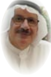
■ د. حسن مدن

من أحد روافد تنوعه الثقافي والحضاري. صورة البابا وهو يتمشى في أورشليم، هي الصورة التي يحتاج إليها العراق الآن، يقول الكاتب العراقي علي حسين، ليس فقط دعماً مسيحيي العراق، ودعوة لهم للبقاء، وإنما تأكيداً لفكرة التعايش والأخوة والمواطنة، وهذا ما يظهره حرص البابا على أن يشمل برنامجه اللقاء مع شخصيات إسلامية، بينها المرجع علي السيستاني .