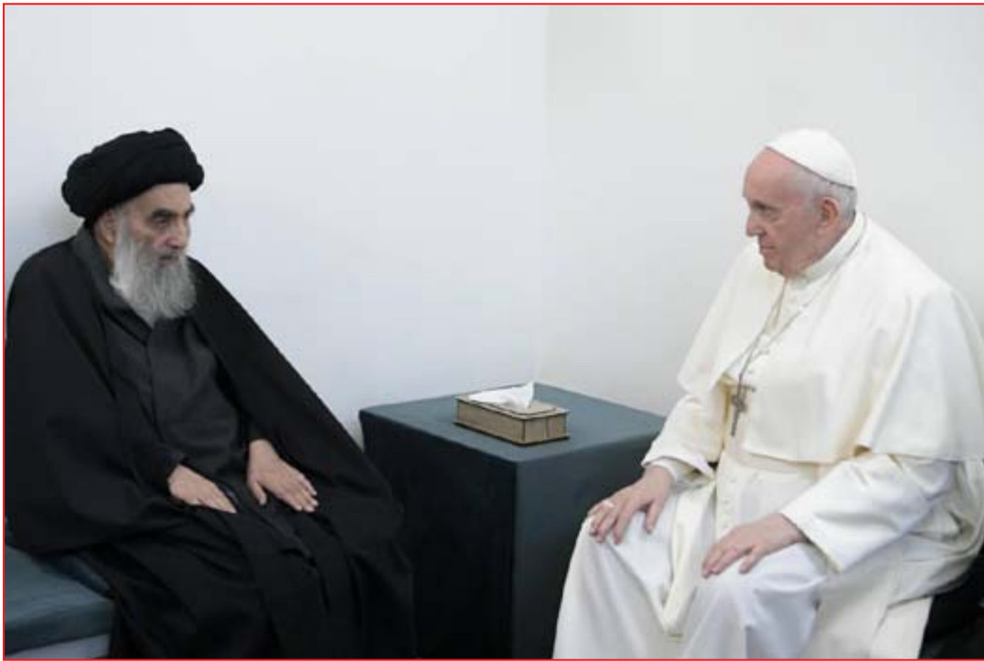
لقاء السيستاني وبابا الفاتيكان أمس ...