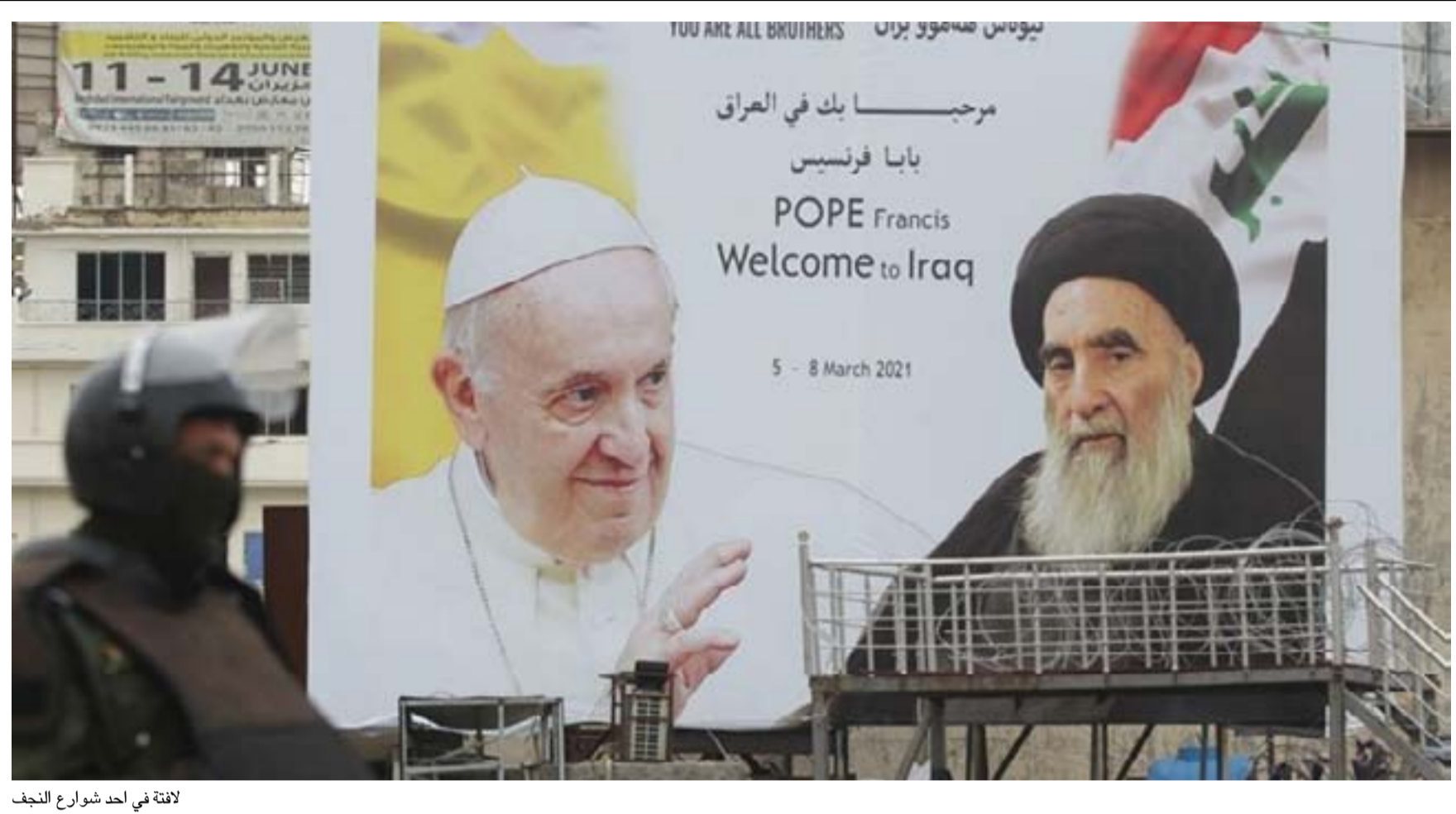
لافتة في احد شوارع النجف

وأكد السيستاني، للبابا "اهتمامه بأن يعيش المواطنين المسيحيون كسائر العراقيين في أمن وسلام وبكامل حقوقهم الدستورية"، وذلك بحسب بيان صادر عن مكتبه عقب اللقاء الذي جمع بينهما في النجف. وأشار السيستاني إلى ما يعاني منه الكثيرون في مختلف البلدان من الظلم والقهر والفقر والاضطهاد الديني والفكري وكبت الحريات الاساسية وغياب العدالة الاجتماعية، فضلاً عن الحروب وأعمال العنف والحصار الاقتصادي وعمليات التهجير.