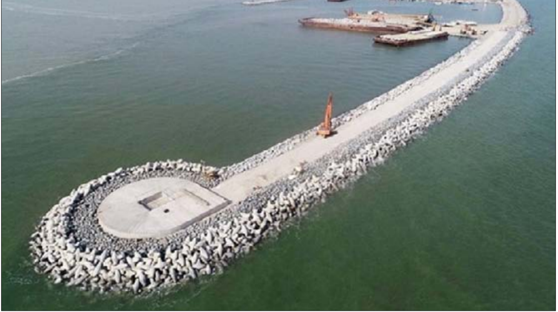
كاسر الامواج في ميناء الفاو الكبير.. ارشيف

وتعود فكرة إنشاء هذا المشروع لها بـ٩٩ مليون طن سنويا، ليكون واحدا من أكبر الموانئ المطلة على الخليج العربي والعاشر على مستوى العالم، وتم وضع حجر الأساس لهذا المشروع يوم ٥ نيسان ٢٠١٠. وصممت شركة ايطالية متخصصة