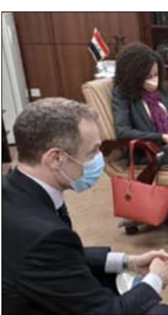
القانونية البرلمانية تبحث مع وفد أممي قانون المحكمة الاتحادية أمس