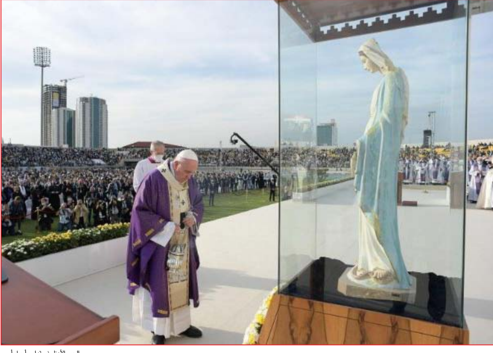
الحبر الأعظم في قداس أبريل أمس