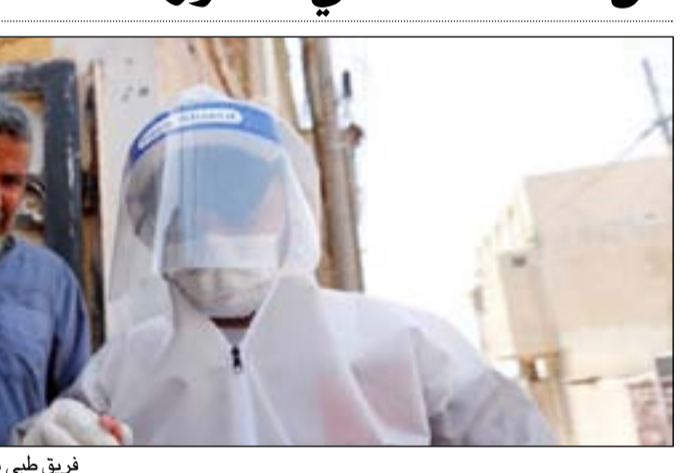
فريق طبي يجري فحص كورونا