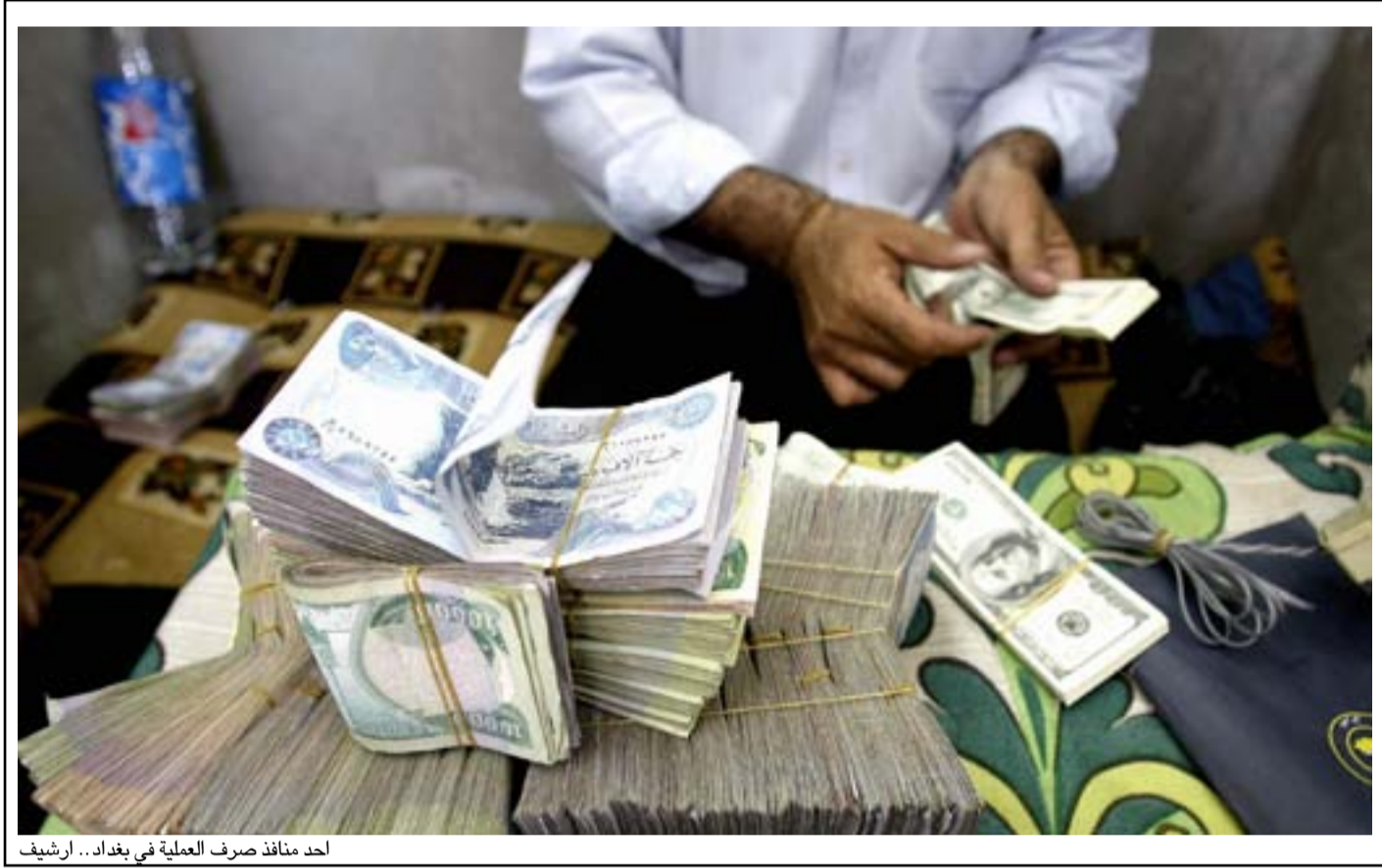
أحد منافذ صرف العملي في بغداد

وبين كوجر، أن "البنك المركزي هيئة مستقلة وله قانون خاص ويحمل كامل المسؤولية في موضوع السياسة النقدية وتحديد سعر الدولار". وشدد، على أن "الحكومة الاتحادية