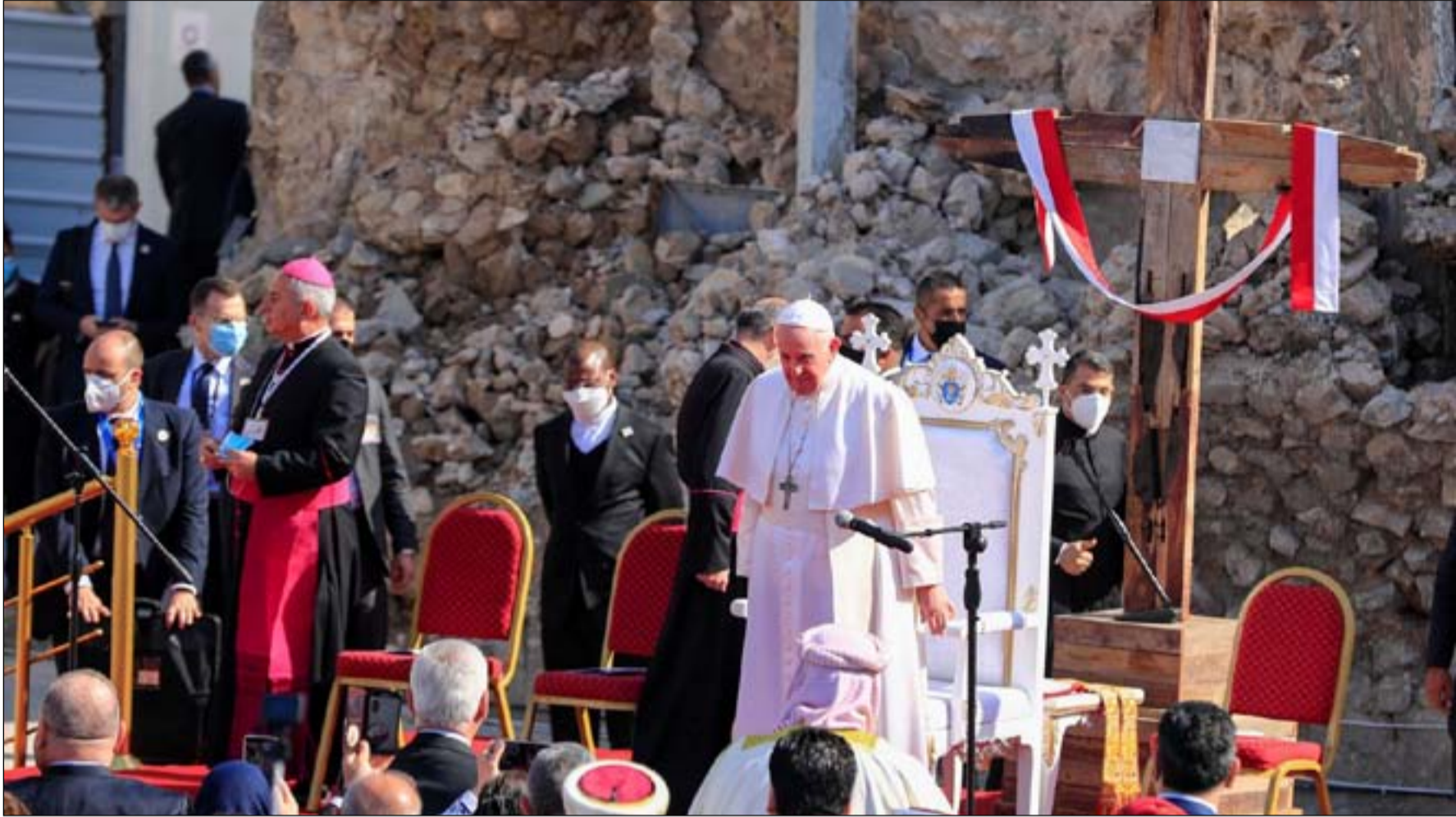
بابا الفاتيكان في نينوى أمس

وانخفض عدد المسيحيين في العراق إلى أقل من 50% بعد عام 2003، وقتل منذ ذلك الحين، 1200 مسيحي في عموم البلاد، بينهم 700 قتلوا على الهوية. بحسب جمعيات مسيحية لحقوق الانسان.