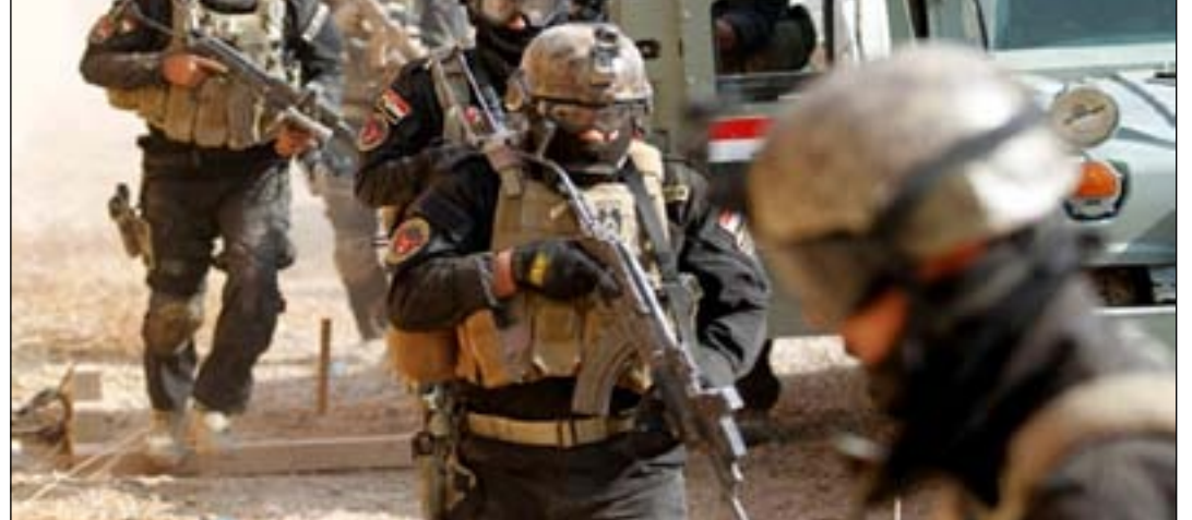
قوة من مكافحة الارهاب في صلاح الدين

وفي وقت متأخر من يوم أمس، أعلن الحشد الشعبي في بيان تلقته (المدى) إن "قوات اللواء التاسع بالحشد الشعبي ضبطت مسكراً كاملاً لفلول داعش الارهابي يحتوي معملاً للتفخيخ ومخبأً للعجلات في صحراء العيث شرقي محافظة صلاح الدين". وأضاف إن "ذلك جاء خلال المرحلة الثانية من عمليات ثار الشهداء، إذ عثرت القوات أيضاً على مضافات ثابتة وموقفة وأنفاق لبعض التحركات الامنية في مناطق: عسيلة وغظبية ودواجي والختاوية الثانية، كما عثرت القوات أيضاً على عجلة مدمرة لفلول داعش الارهابي ومواد متفجرة C٤ ومستلزمات طبية وغيرها".