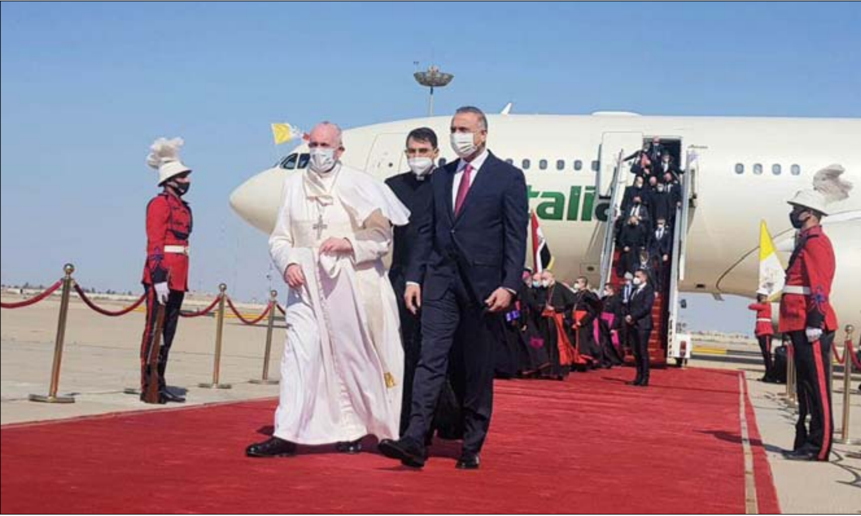
الكاظمي خلال لقائه بابا الفاتيكان قبل أيام

وصلّت رسالة قداسة البابا إلى كل أنحاء العالم، وهو يحوّل قلبه معجج بروح رسالة في مدن العراق الحبيبة، ووصلت إلى كل شعوبنا التي كل شعوب الأرض لتقول: نحن شعب العراق... شعب التاريخ والحضارة، لقد عانينا الكثير من الحروب... وسال الدم على أرضنا حتى ارتوت... ونشر الموت طوال عقود ظلالة السود في منازلنا... وعانت في ربوعنا غربان السلاح والفساد والإرهاب والكراهية... لكن معدننا الأصيل لم يصدأ، لأن روح الحياة وحبّ السلام والتمسك بالقيم