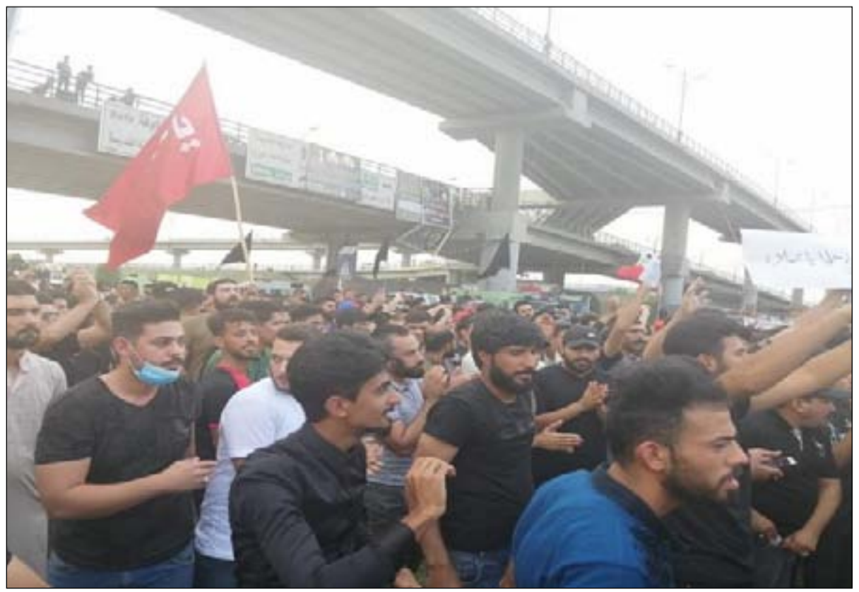
جانب من تظاهرة سابقة .. أرشيف

وأظهرت لقطات بثها ناشطون على مواقع التواصل الاجتماعي وقوع إصابات في صفوف المحتجين نتيجة استخدام قوات الأمن لقنابل الغاز والكرات الزجاجية الصغيرة لتفريق التظاهرات. وجاء التصعيد في المدينة التي تضم أحد أكثر المراكز المقدسة لدى الشيعة، على خلفية عملية اغتيال جاسب الهليجي وهو