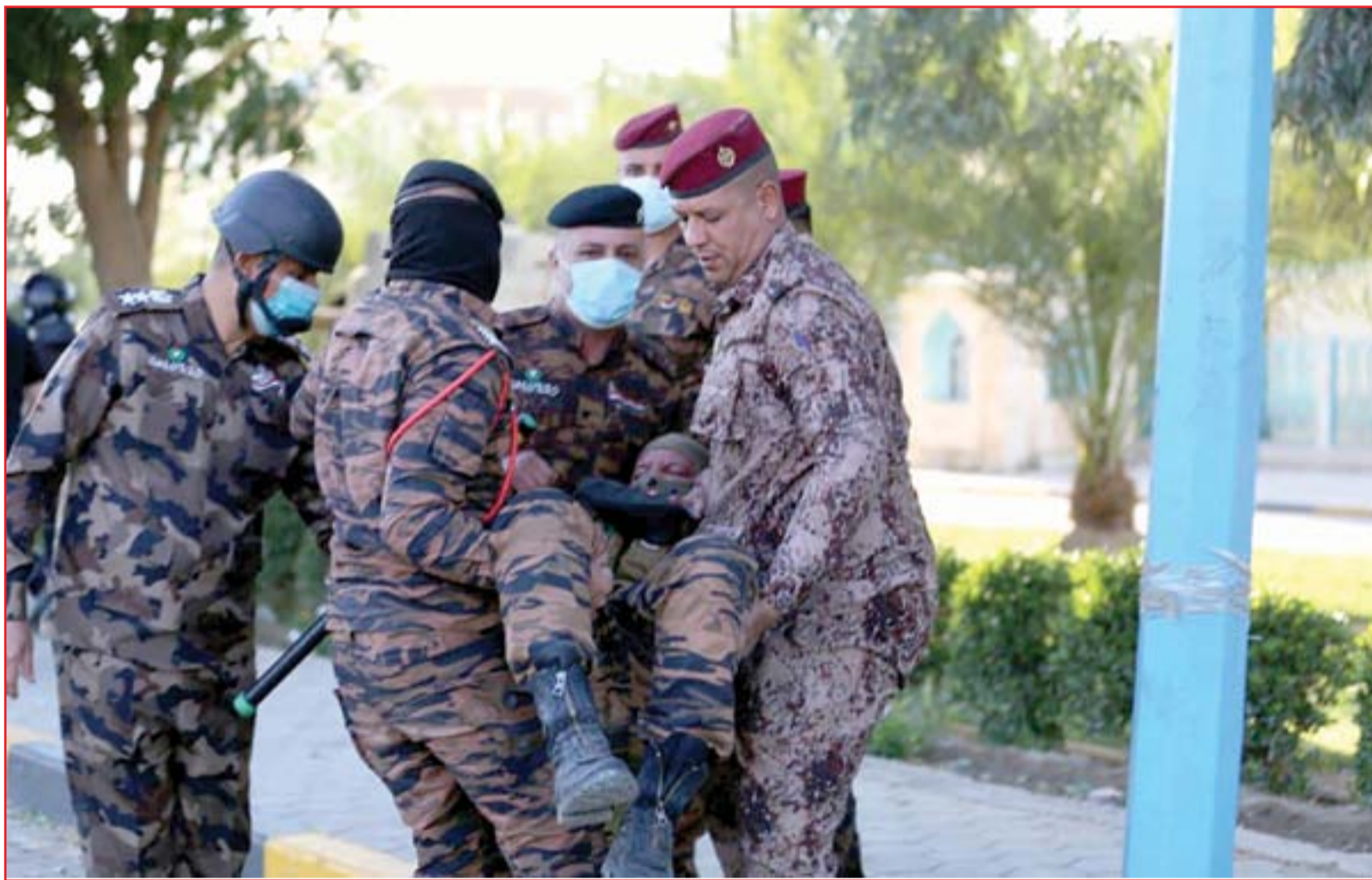
منتسب يصاب أثناء تفريق تظاهرات النجف أمس الأول