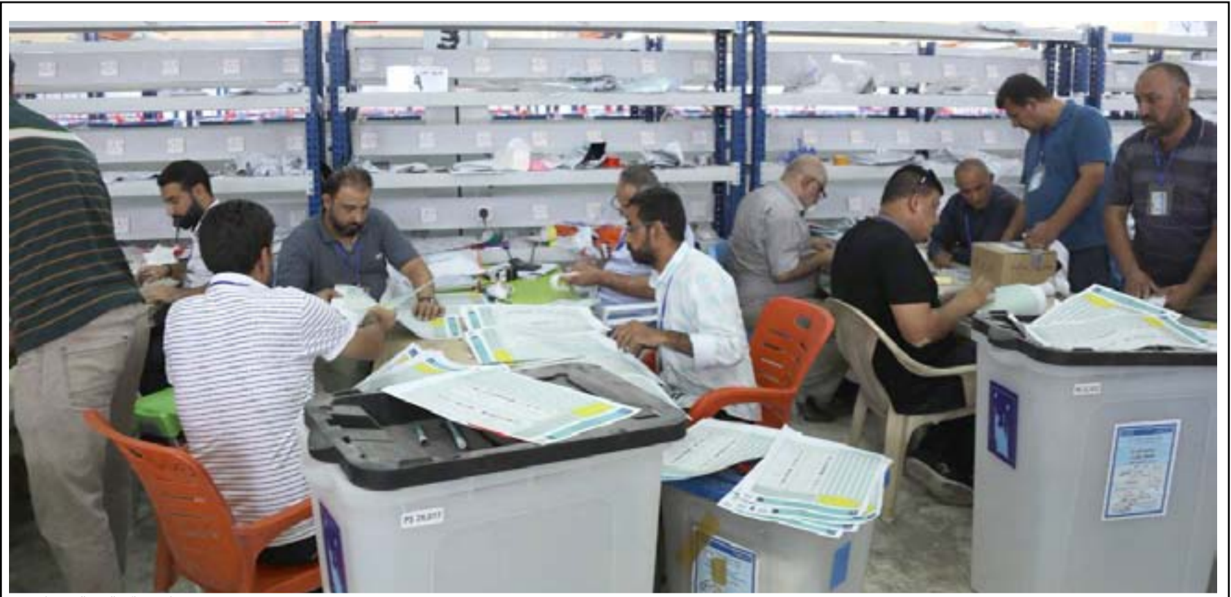
أحد مراكز العد والفرز... أوشيف

اقبالاً على تحديث السجل الانتخابي، ان بلغت نسبة المشاركة فيها حوالي ٨١٪، واسط والمثنى وصلت نسبة التسجيل إلى ٧٦٪ لكل محافظة منهما، والبصرة أكثر من ٧١٪، القادسية ٧٠٪، وبعدها محافظات ذي قار وكركوك ودهوك حيث قرابة معدلات تسجيلها ٦٩٪، في حين بلغت نسبة التحديث في بابل وكربلاء والنجف ٦٨٪، ومحافظة السليمانية ٦٦٪، ثم تأتي بعدها اربيل وصلاح الدين والانباء بـ ٦٠٪. ويتابع "أما محافظة نينوى فقد سجلت نحو ٥٠٪"، وطلب مفوضية الانتخابات بـ "القيام بجولات لدعوة المواطنين إلى التسجيل، وتذليل العراق قائمة التسجيل إذ يقول الهنداوي أنها "سجلت أقل نسبة تحديثاً جانب الكرخ". أما على صعيد توزيع البطاقة الباليومترية يصف الخبير والمستشار الانتخابي عملية توزيعها على الناخبين بـ "الجيدة"، مضيفاً أن "عدد البطاقات التي تم توزيعها يصل إلى نحو ١٤ مليون بطاقة باليومترية (بطاقة طويلة الامد التي تحتوي على صورة وفيها بصمات الإصابع على العكس البطاقة القصيرة التي تكون خالية من الصورة والبصمات)، من أصل خمسة وعشرين مليون ومئتين وخمسين ألف ناخب يحق لهم المشاركة في الانتخابات البرلمانية المقبلة".