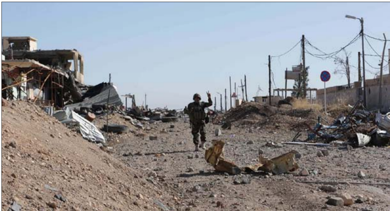
جندي في سنجار بعد إعلان تحريرها أرشيف

السوري باتجاه الأراضي العراقية في منطقة الدوحي الحدودية غرب جبل سنجار . وأضاف البيان: "في الوقت ذاته، اشتبكت قواتنا البطلة مع مجموعة إرهابية أخرى من داخل الأراضي العراقية في جبل سنجار بعد أن قامت بفتح النار باتجاه الفوج ذاته واستمر الاشتباك مدة نصف ساعة تم خلاله إيقاف عملية التسلل وهروب المجموعة الإرهابية باتجاه الأراضي السورية في حين قامت قوة أخرى من قطاعات الحدود بملاحقة العناصر الموجودة على جبل سنجار ومعالجتهم بمختلف الأسلحة، وقد لانت هذه العناصر الإرهابية بالفرار ."