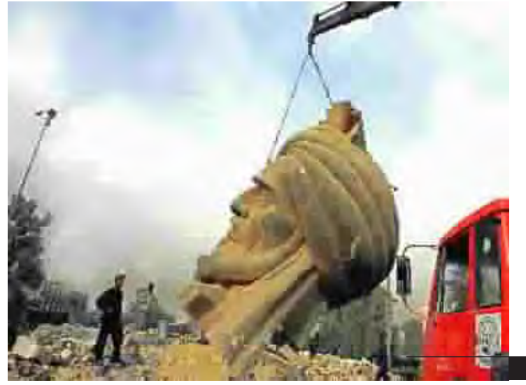
رافعة تنقل تمثال ابو جعفر المنصور عن مكانه ، بعد ان تعرض لانفجار ليلة امس الاول في بغداد. وابو جعفر المنصور هو الخليفة العباسي الذي بناه بغداد سنة ٧٦٢ م.