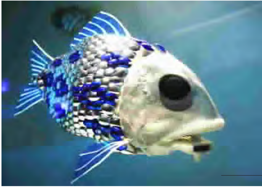
سمكة - روبوت تسبح في حوضها في معرض لندن للحيوانات البحرية ، وقد كشف المعرض مؤخرا ثلاثة روبوتات لحيوانات بحرية قام بصنعها فريق من جامعة (أكسف) البريطانية.

اعلنت النجم الامريكى سلفيستر ستالونجا عن نيته تكرار دوره كملانم في سلسلة افلام (روكي) الذي جلب له الشهرة منذ ثلاثين عاما. ومن المقرر ان يقوم ستالونجا باخراج وانتام وكتابة فيلم (روكي بالبو) وهو الفيلم السادس من السلسلة التي حصل الاصل منها على جائزة اوسكار عام ١٩٧٦