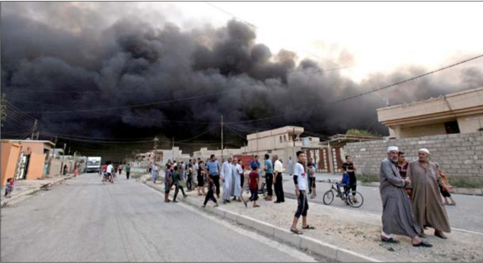
ناحية العبارة قصفت بأكثر من ١٠٠ هاون خلال ٤ سنوات

واعترض الدهلكي ما حدث بانته "رسالة واضحة بان ديالى بلا قانون ولا حكومة تحاسبهم او يخشونها وهذا ليس بالامر المفاجئ في دولة القانون".