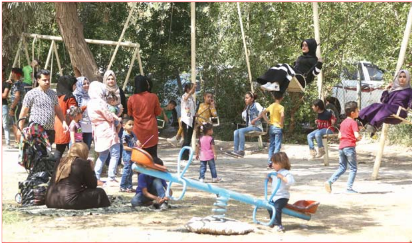
رغم حظر التجوال عائلات بغدادية تحتفل بنوروز في حدائق سلمان بك...

حتى نهار امس، كانت القوات الامنية ما تزال تبحث عن مصير مختطفين من قبل جهات مجهولة في بلدة تقع في شمالي ديالى، وجرى الحادث في اعقد منطقة في المحافظة، حيث يتسابق "داعش"