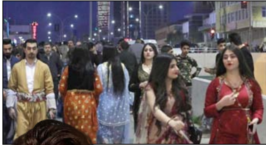
وطوقسه هي من طبيعة الأشياء في كردستان العراق. وفي هذا اليوم يتم إظهار الرموز الكردية، من الملابس

الأزياء الفولكلورية، إلى الشراب، وصولا لكونه علامة فارقة على رفض الكرد للانصهار، والتخلي عن هويتهم وأرضهم، وإصرارهم على نيل حريتهم، وحقوقهم. وتبدأ الاحتفالات من مساء ٢٠ آذار، بإيقاد شعلات النار الضخمة، في ساحات الاحتفال المركزية، في مختلف المدن والبلدات الكردستانية (وحتى غير الكردستانية، مثل اسطنبول) في العراق وتركيا وإيران وسوريا، ويعقبها عقد حلقات الدبكة، وغيرها من أنشطة وفعاليات، تعبيرا عن الفرح والبهجة بعيد النوروز، وبيشائر الربيع وجماله. وفي يوم ٢١ آذار، وعلى مدى