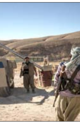
اتفاق التطبيع غير قادر على ضبط الاوضاع

رئيس الوزراء مصطفى الكاظمي. وأشار الى ان الفكرة تم استلهاها في مناطق تسيطر عليها قوات حزب العمال الكردستاني، وانه الحل المثالي لسنجار ولقي موافقة شعبية. وقال مراد ان هذا الطلب سيساهم بحكم سنجار من قبل اهلهما وابقاء الصراعات السياسية بعيدا. وان قوات ايزيدية سيتم دمجها ايضا مع القوات المسلحة العراقية طالما ان سنجار هي مدينة عراقية. مشيرا الى انه كان من المفترض ان تكون الاتفاقية بين سنجار وبغداد مؤكدا بان الحكومة غير قادرة على ايجاد حل يرضي جميع الاطراف. داوود شيخ جندي، مسؤول عن تشكيلات حزب PUK في سنجار، قال انه يدعم مقترح تحويل سنجار الى محافظة، مؤكدا بقوله "سنجار تستحق ان تصبح منطقة