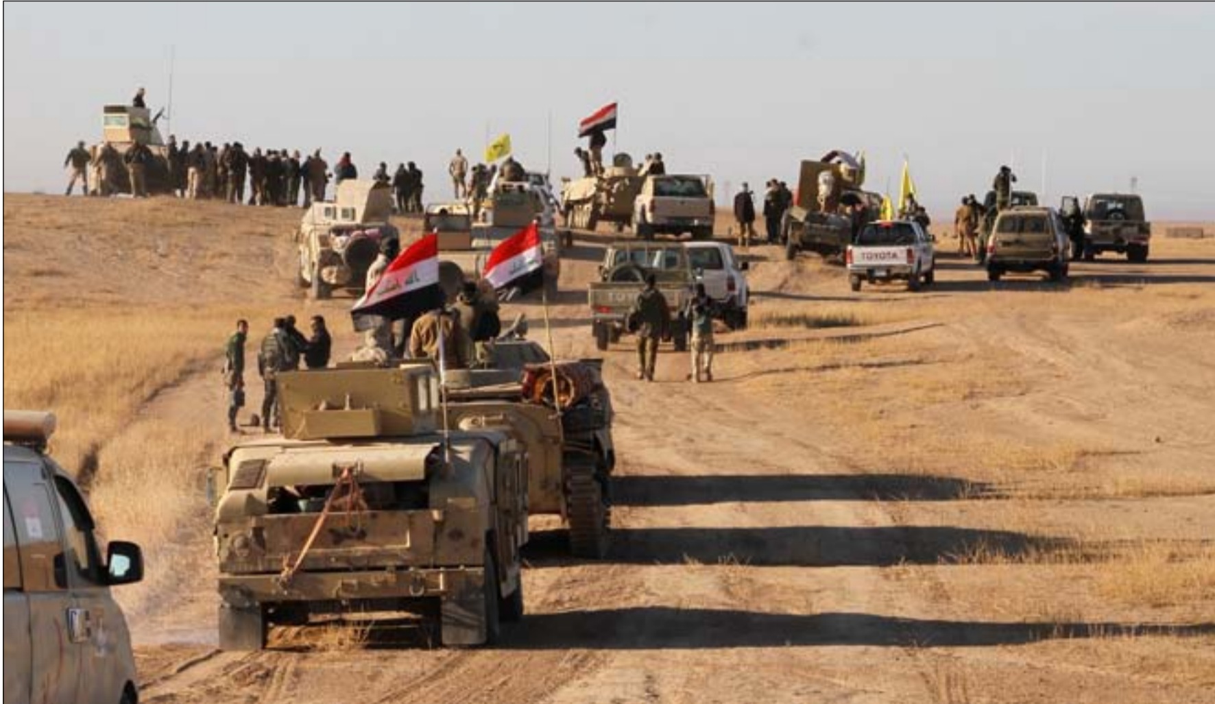
قوة عسكرية في صحراء الانبار.. ارشيف

وتبلغ مساحة محافظة الانبار نحو 138 ألف كيلو متر مربع (نحو ثلث مساحة العراق)، أغلبها مناطق صحراوية. ويضيف العنشاوي في اتصال مع (المدى) ان "هناك مجاميع وفرقا من داعش في الصحراء، تلاحقها العمليات العسكرية بشكل دائم".