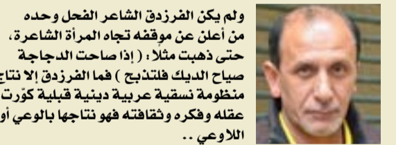
ولم يكن الفرزدق الشاعر الفجل وحده من أعلن عن موقفه تجاه المرأة الشاعرة، حتى ذهبت مثلاً: (إذا صاحت الدجاجة صباح الديك فلتدبج) فما الفرزدق إلا نتاج منظومة نسقية عربية دينية قلبية كوّرت عقله وفكره وثقافته فهو نتاجها بالوعي أو اللاوعي..

كان من الطبيعي أن يتجاهل الإعلام العراقي، في عهد صدام، نازك الملائكة تماماً، ولا يتعرض لها أو ينشيد بذكرها، كما لو كان صدر حكماً بإعدامها إعلامياً. والنتيجة أن توقف الدارسون والنقاد في العراق عن ذكرها أو الإشادة بدورها الرائد في ابتداء قصيدة الشعر الحر، تلك التي نسبوها لريادتها إلى بدر شاكر السياب. ولا أظن أن الحملات الإعلامية والسياسية كانت سبباً متفرداً في ضوم نازك، بل على العكس فإن المرحلة الدكتاتورية لم تكن تمنع دراستها ولا في الجامعة ولا في الصحافة ولا في النقد بل إن أشهر الملققين والشعراء المحسوبين على السلطة وايدولوجيين كانوا يقررون بزيادة نازك وسبقها على السياب ولكن لعل الفارئ الكريم يتفق معي أنها كانت... أيضاً... حملة (الديك) على (الدجاجة)!