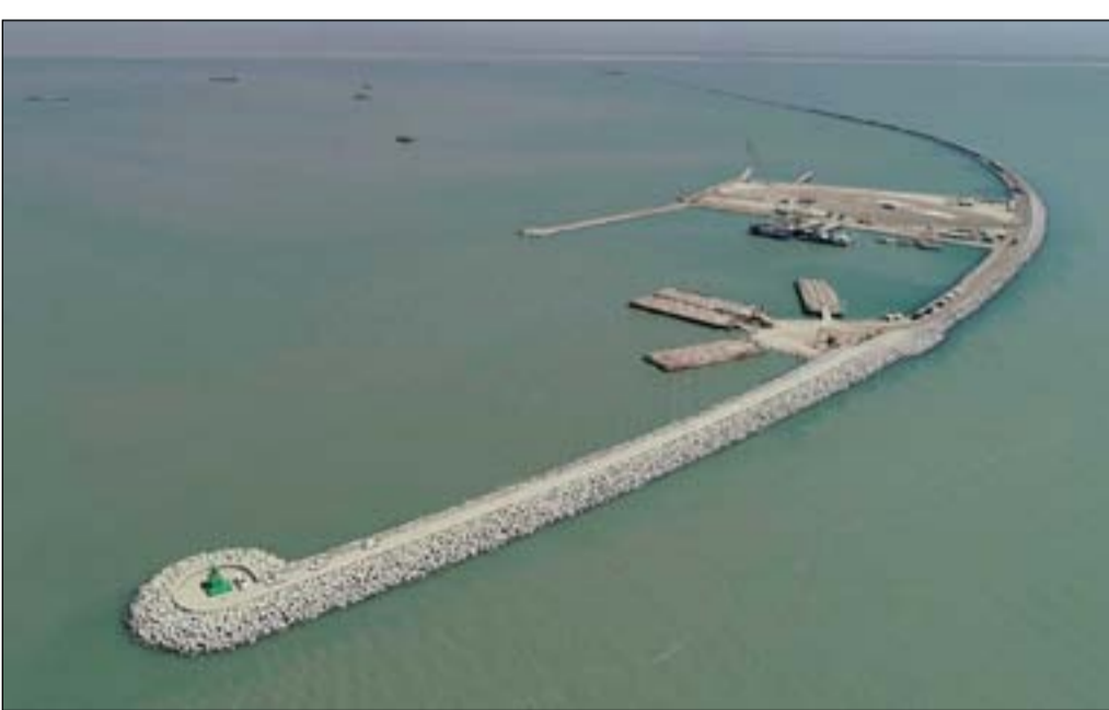
كاسر الأمواج في ميناء الفاو الكبير

والعاشر على مستوى العالم، وتم وضع حجر الأساس لهذا المشروع يوم ٥ نيسان ٢٠١٠. وصممت شركة ايطالية متخصصة مشروع الفاو الكبير ليستوعب ٩٩ مليون طن من الشحن سنوياً بكلفة ٤٦ مليون يورو ليربط الخليج العربي بأوروبا بواسطة شبكة حديدية وصولاً إلى القارة الأميركية. وتعود فكرة إنشاء هذا المشروع إلى الفترة التي تلت الحرب