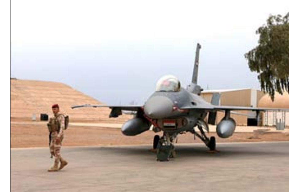
مقاتلة اف 16 في قاعدة بلد

كما ستركز المناقشات على انسحاب المزيد من الجنود الأمريكيين، المقرر عدهم بنحو 2500 جندي ما زالوا في العراق بعد سحب أكثر من 2700 منهم خلال العام الأخير من ولاية ترامب (2017-2021).