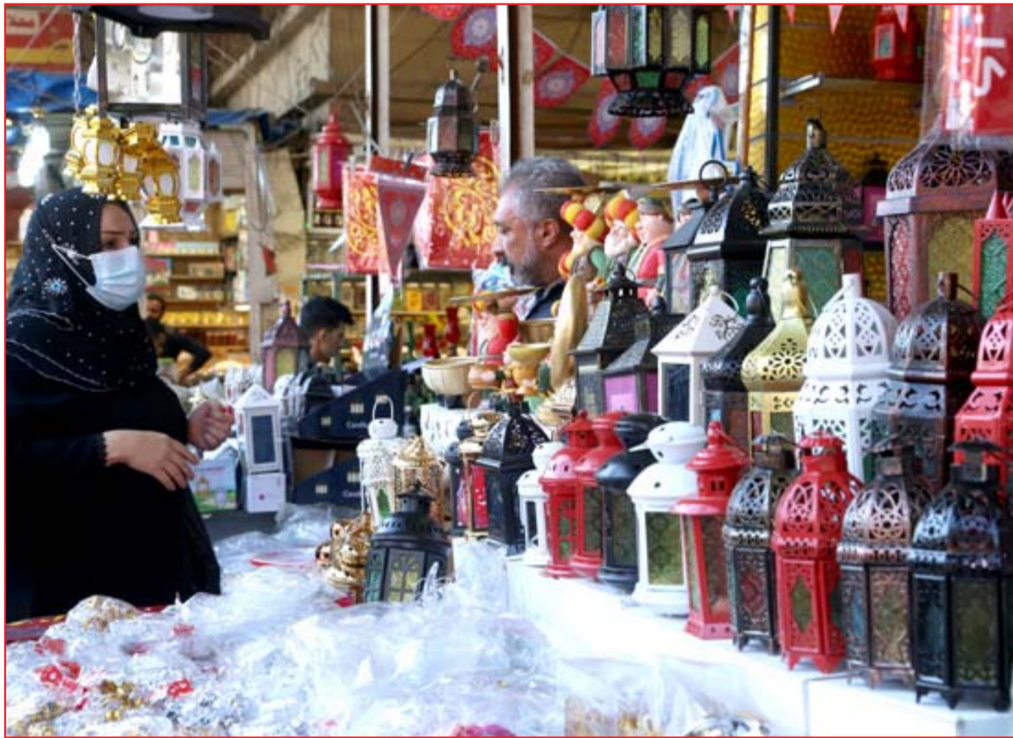
تحضيرات رمضان تملأ سوق الشورجة.. عدا: محمود رؤوف