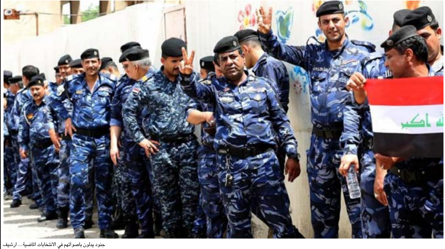
جنود يملون باصواتهم في الانتخابات الماضية... أرشيف

وتوقع ان "إجراء الانتخابات المحلية أمر بعيد وفق المشاكل والازمات التي نمر بها التي قسم منها يتعلق بالجانب السياسي والتي تتعلق بإجراء الانتخابات خلال ستة اشهر وهذا يتطلب تعديل قانون الانتخابات المحلية وهو غير ممكن، الجانب الثاني والذي يتعلق بإمكانية مفضوية الانتخابات واستعداداتها لدمج الاقتراعين".