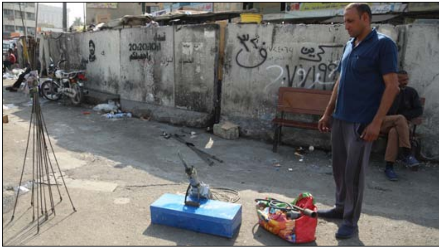
عمال في ساحة الطيران في ظل الحظر...

وقال الجهاز المركزي للإحصاء التابع لوزارة التخطيط، قبل اسبوع، إن «ارتفاع سعر صرف الدولار في الأسواق