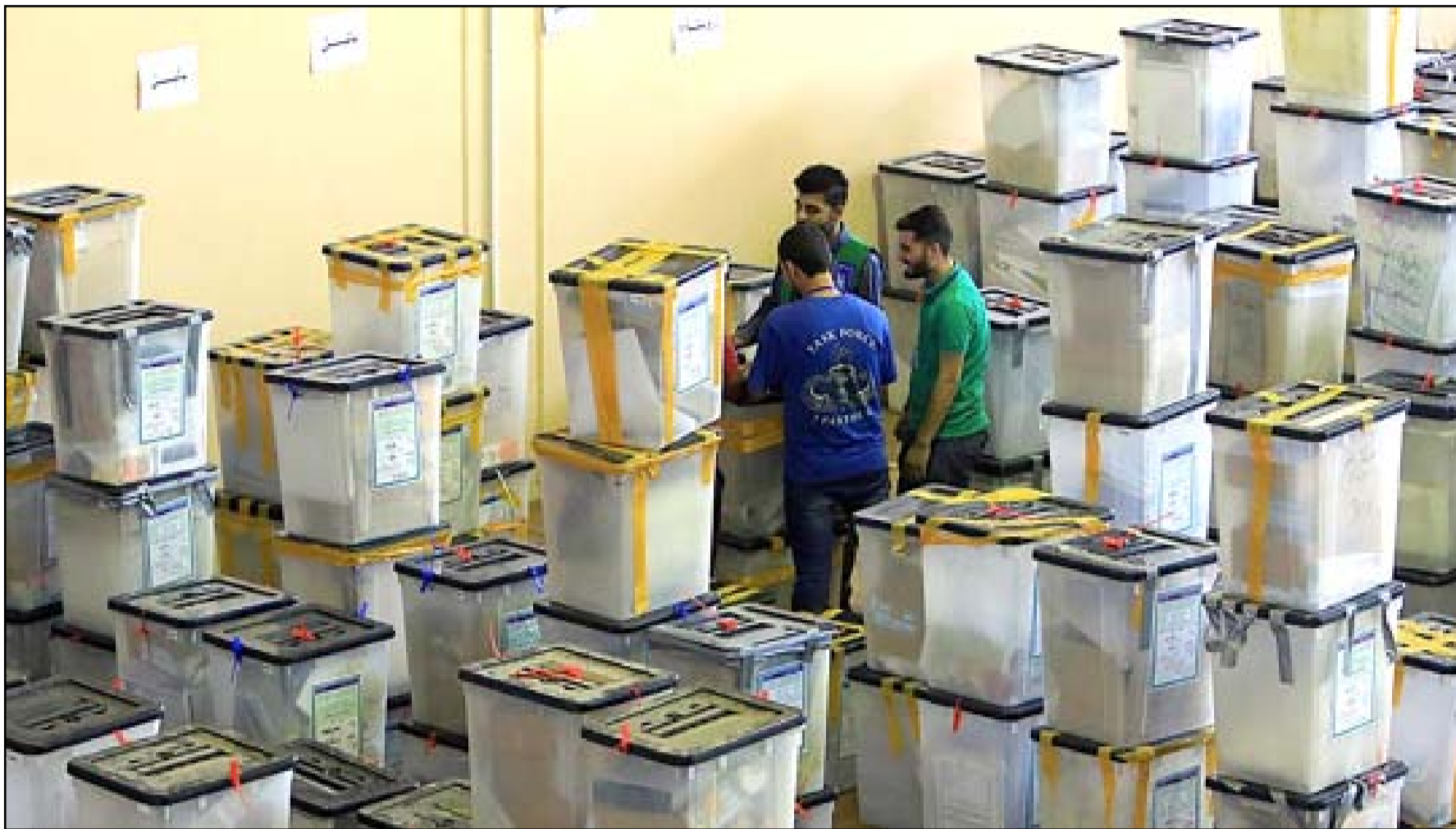
أحد مراكز العد والفرز.. أرفيف

وأعلن الحكيم في حزيران 2020 تشكيل تحالف (عراقيون)، والذي اعتبر حينها بأنه تيار داعم لحكومة مصطفى الكاظمي. وأكد الجبوري أن الحكمة "لم يحسم حتى الآن فيما سيخوض الانتخابات بالاسم الأول أو بعراقيين".