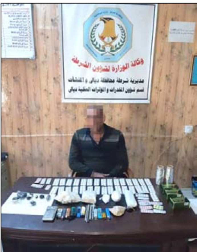
أحد تجار المخدرات في قبضة شرطة ديالى...