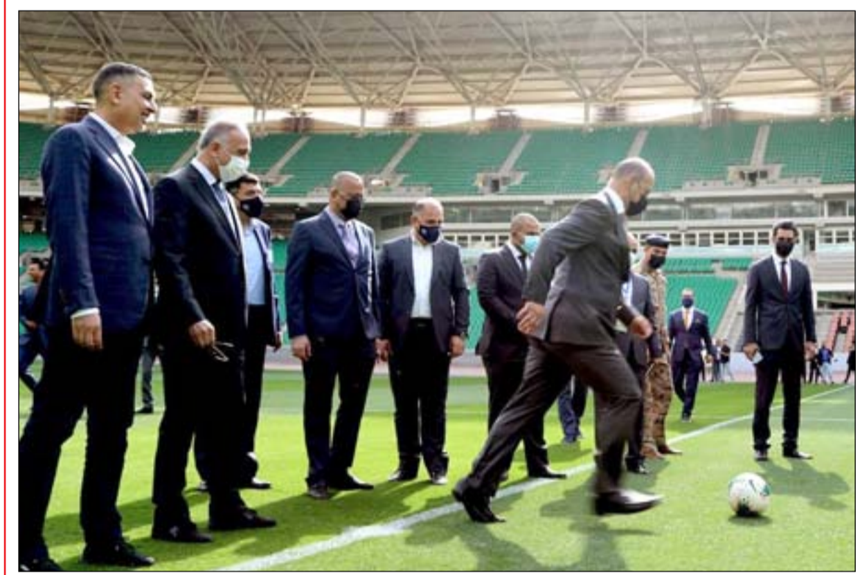
الكاظمي وفريقه الحكومي في ملعب جذع النخلة أمس

وفي آخر تحديث للمفوضية فان اعداد التحالفات ربما تصل الى اكثر من ٤٠ تحالفا، بينها ٣٠ مجازة بشكل فعلي، و٨