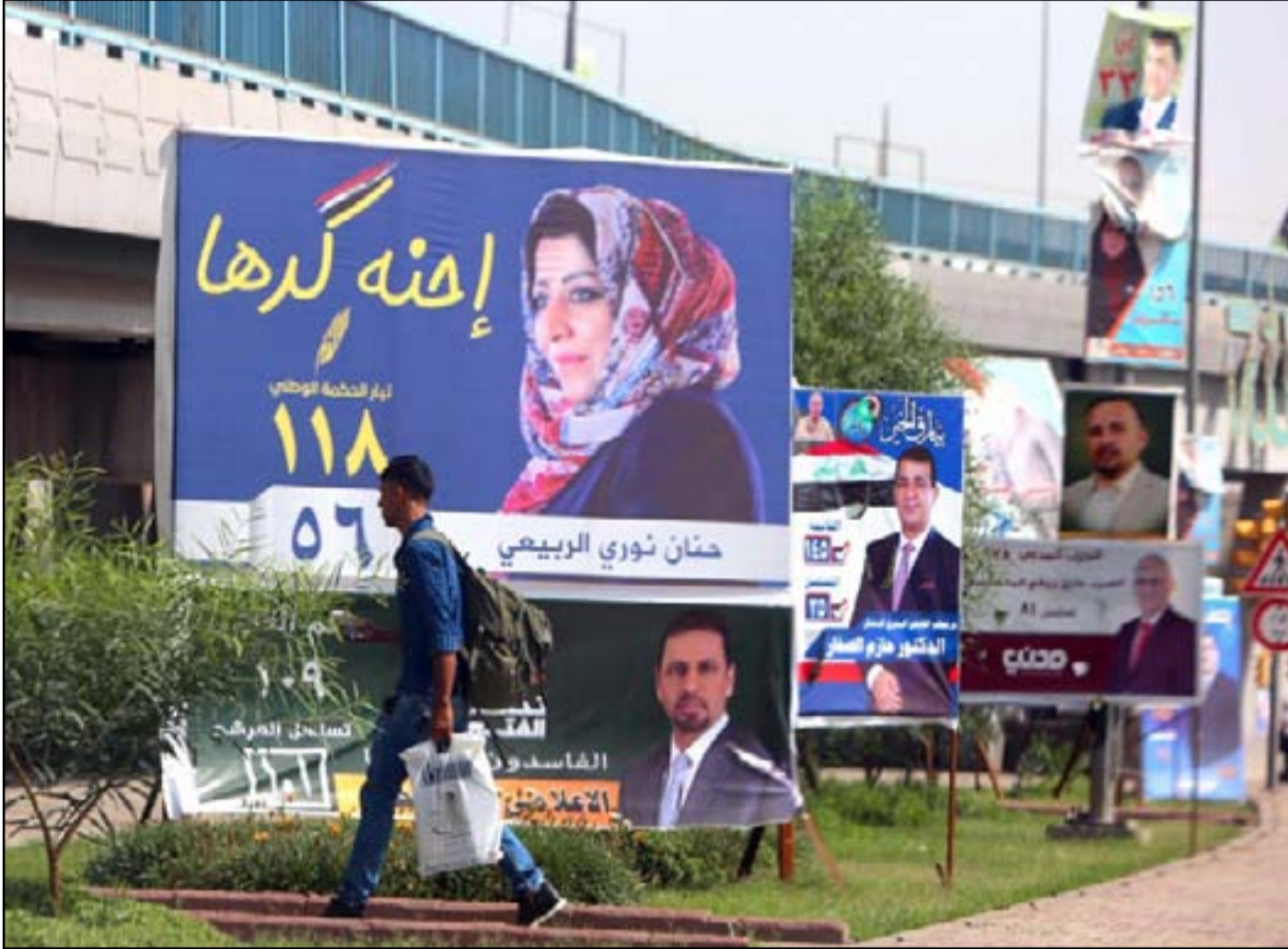
لافتات انتخابية في شوارع بغداد