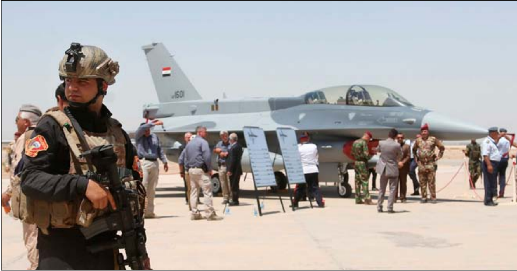
مقاتلة أف ١٦ عراقية

متسببي دائرة الكهرباء الذين كانوا يعملون حينها قرب مكان الهجوم انه تم تبليغ قوات الجيش والشرطة الذين سارعوا لمكان انطلاق الصواريخ ليجدوا قواعد إطلاقها في مكان الحادث". وفي هجوم مساء الاحد تكرر السيناريو ذاته، فيما أكد السكان في الدوجمة، ان قريتهم قدمت "٥٠٠ شهيد" في المعارك ضد تنظيم القاعدة وداعش.