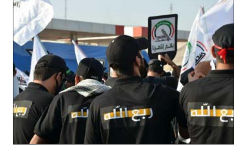
ترجمة / المدى

لسنوات، واستهدفت قوات التحالف بقيادة الولايات المتحدة العاملة في العراق بدعوة من الحكومة العراقية، مما أسفر عن مقتل وإصابة جنود من قوات التحالف ومدنيين محليين. وفي الأونة الأخيرة، لجأت العناصر التابعة للمقاومة إلى قصف شاحنات مدنية يقودها مدنيون عراقيون، لكن يُزعم أنها تحمل الإمدادات والعنّاء إلى قواعد التحالف. ولا يقتصر الأمر على العنف فحسب، بل تجني الفصائل أيضاً دخلاً من مجموعة من المصادر والأنشطة التجارية غير المشروعة، بينما تسبح سيطرتها المتزايدة على عناصر في الحكومة والمؤسسات العراقية باستغلال عائدات نقاط التفتيش ومراقبة الحدود ومشاريع الإبتزاز. وتابع التحليل "باختصار، لا تحترم فصائل المقاومة كثيراً القانون المحلي العراقي، أو الأنظمة التي تحكم القوات المسلحة العراقية وموظفي الحكومة، أو أي قانون دولي". ويرى المعهد أن "هذا الإجراء يجعل هوس الفصائل بتطبيق القانون مفاجئاً إلى حد كبير. ومع ذلك، تخصص الفصائل المدعومة من إيران - والعديد منها من المنظمات التي صنفتها الولايات المتحدة كإرهابية - الكثير من الوقت والجهود لنشر اهتمامها بالقانون ودورها كدافعة عنه". وتناقش الفصائل العراقية وقادتها وقنواتها الدعائية مفاهيم مرتبطة بقانون النزاع المسلح - لا سيما فيما يتعلق بشرعية استهداف القوات الأميركية - والمكانة القانونية للفصائل نفسها باعتبارها فرعا رسمياً للقوات المسلحة العراقية من خلال قوات الحشد الشعبي، بحسب معهد واشنطن. وأوصت الدراسة البحثية صناعات السياسة، الذين يسعون إلى حلول طويلة الأمد لمشاكل الفصائل بفهم "شبه الالتزام بالقانون من أجل وضع حد لأنشطتها، ودعم محاولات الحكومة العراقية للوفاء بالتزاماتها الدولية لمنع الانتهاكات من قبل الجهات الفاعلة المرتبطة بالدولة".