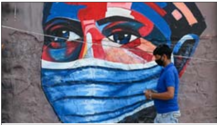
تزال اللقاحات هي الأداة الحاسمة لمنع انتشار المتغيرات الأخرى أيضاً، وتلك التي قد تتطور في المستقبل، ولحماية من المتغيرات الأكثر عدوى،

وتابعت: "حاول تجنب الأماكن الأكثر خطورة حيث لا يرتدي الأشخاص أقنعتهم، مثل تناول الطعام في الداخل، يمكنك القيام بنشاطات اجتماعية في الهواء الطلق فقط، مع أفراد من أسر مختلفة، مع الحفاظ على مسافة 6 أقدام على الأقل". أما بالنسبة للأشخاص الذين تم تطعيمهم بالكامل، فالتق والتباعد، وبمضاغفة جميع الاحتياطات، وأضاف: "مرة أخرى، هذا يعني ارتداء قناع في جميع الأماكن العامة. أظهرت الدراسات أنه من المفيد ارتداء كمامتين - ووضع قناع قماش فوق القناع الجراحي".