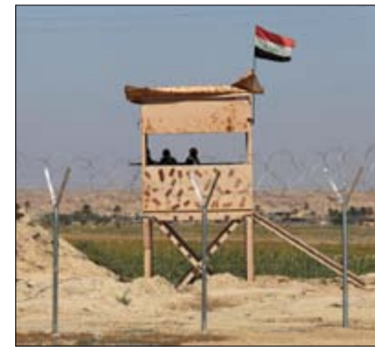
الحدود العراقية السورية.. أريشيف

اجتماع الكعبي مع المحافظين بحضور اللجان البرلمانية