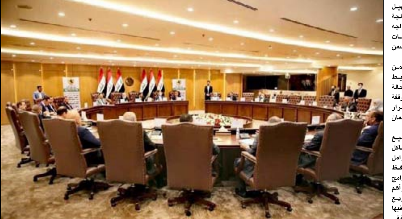
اجتماع الكعبي مع المحافظين بحضور اللجان البرلمانية

ويواصل العسل، أن "قواتنا سواء الجيش أو الشرطة الاتحادية أو الحشد الشعبي والعشائري تقوم بأنشطة وتواجد دائم في الصحراء، وذلك بالتنسيق مع قيادة العمليات المشتركة وتواجد للغطاء الجوي، لمطاردة مفارز تنظيم داعش الإرهابي". وتحدث، عن "استعانة مستمرة بالحشد العشائري في أي عملية أمنية لما يمتلكه من خبرة في مداخل الصحراء ومخارجها وطبيعة السكان". ومضى العسل، إلى أن "العائلات المتواجدة في المخيمات التي انخرط أحد أفرادها في صفوف التنظيمات الإرهابية لا نستطيع تأمين إعادتها، ما لم يتم تعويض نوي الشهداء والمضطرين من الإرهاب".