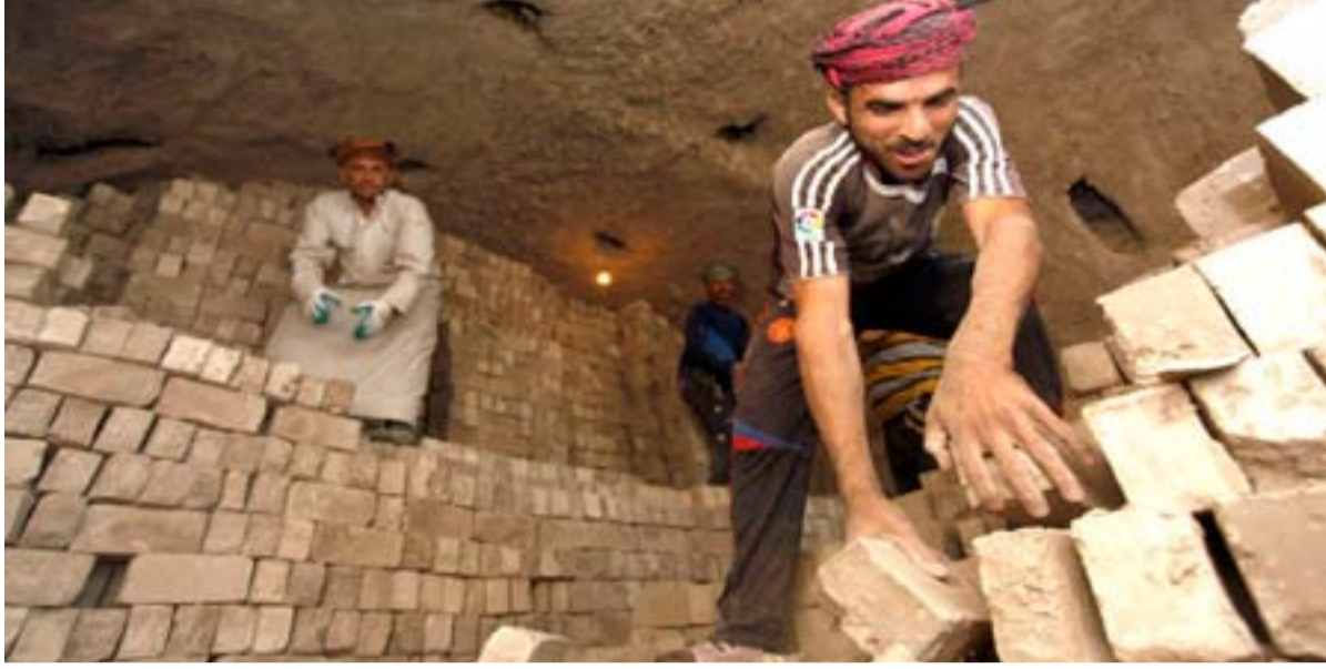
عمال في احد معالم الطابوق..