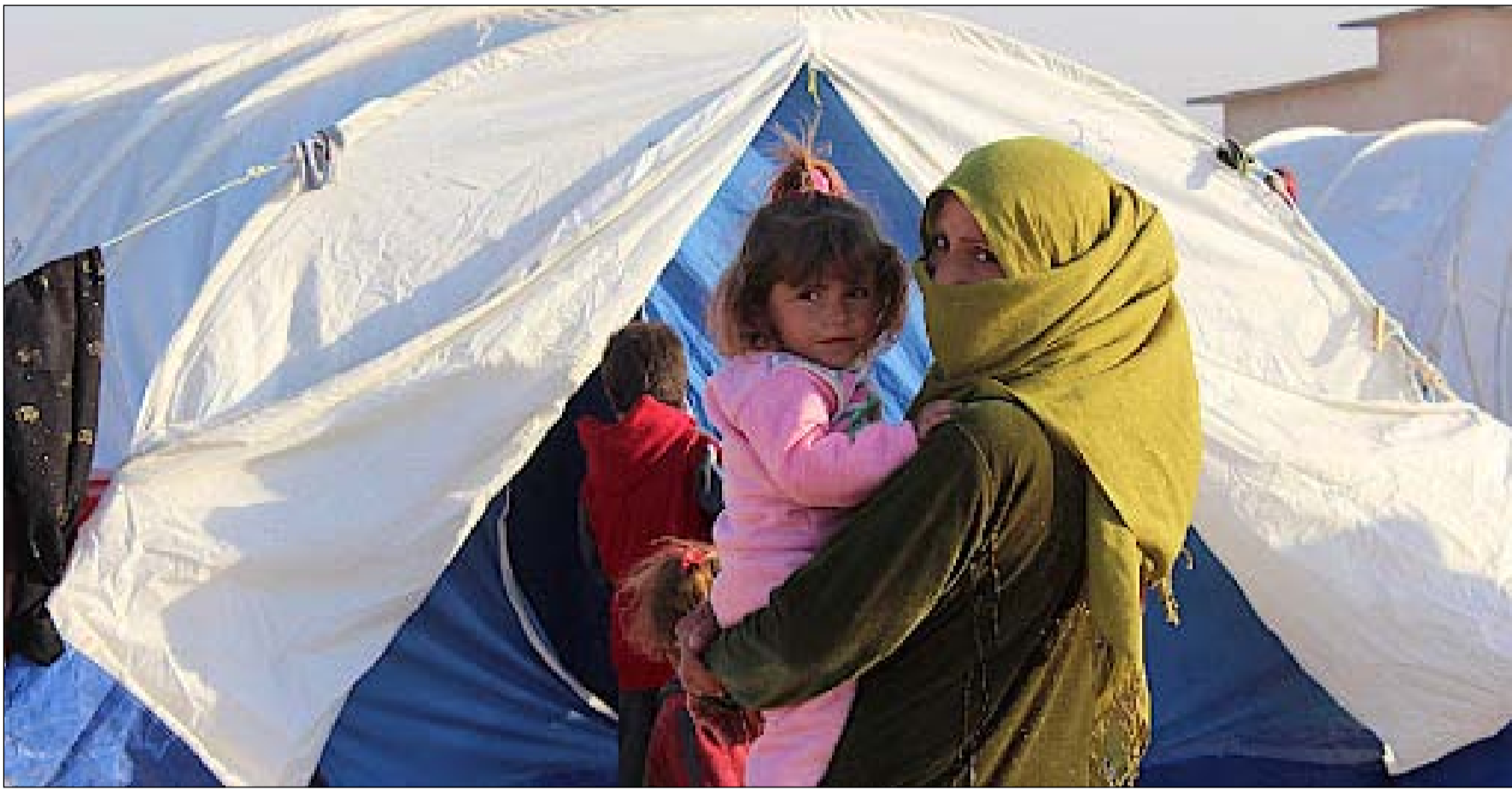
لحد مخيمات النزوح في العراق... أرشيف

300 عائلة لجأت إلى مراكز كردستان هرباً من الموت والهجرة تقطع رواتبهم