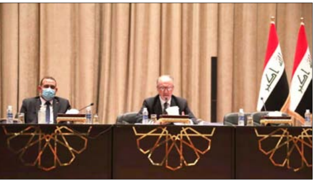
وزير المالية والتخطيط في البرلمان

المخولة لهم بموجب أحكام قانون النشر بالجريدة الرسمية". وبينت ان "الأخطاء" التي وردت في النص المنشور في جريدة الوقائع العراقية الرسمية، على النحو الآتي: ١- ورد بالمادة ١/ أ/أ، تقدر إيرادات الموازنة العامة الاتحادية للسنة المالية ٢٠٢١ بـ(١٤١٩٨٤١٠١٣٢٠) ألف دينار حسبما مبين في الجدول (أ) الإيرادات على وفق الأعداد الملحقه بهذا القانون، في حين أن جدول (أ) لم يعدل وفق إجمالي الإيرادات المشار إليها أعلاه وإنما تم الإبقاء على إجمالي الإيرادات المرسله بمشروع الحكومة والبالغ (٤٤٤٤٤٤٤٤٤٤٤٤) ألف دينار. ٢- كذلك ورد بالمادة ٢/ أ/أ، النفقات، يخص مبلغ (٢٢٩١١٠٩٩٩٣٠٠٠٠) ألف دينار مبلغ ٢٠٢١، منها: ١- أ- النفقات التشغيلية (٩٠٥٥٩١٣٩٤٨٢) ألف دينار توزع وفق الحقول (٢١ و ٣) من الجدول (ب) النفقات حسب الوزارات، في حين أن إجمالي الصحيح هو (٩٨٩٧٤١٣٩٤٨٢) ألف دينار وليس (٩٠٥٥٩١٣٩٤٨٢) ألف دينار