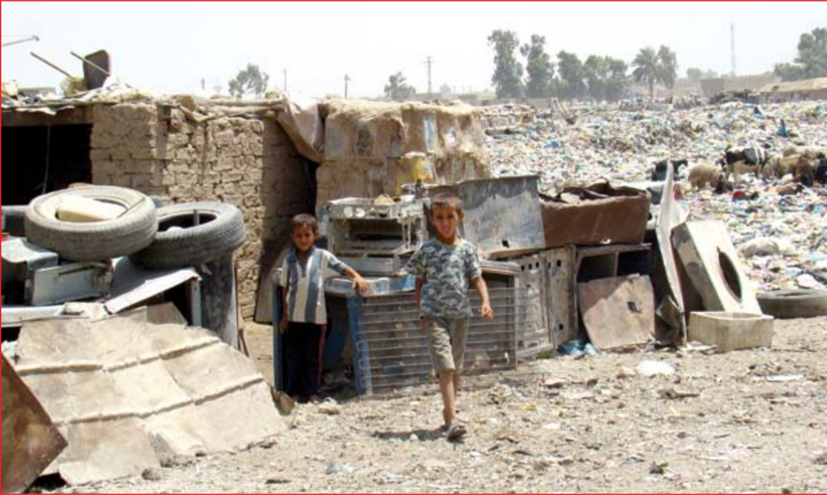
أسر بغدادية فقيرة تسكن في مقالع النفايات...

هذه الشخصيات المطلوبة بأنها من "حبتان" الفساد وبعضها تمتلك مصارف وشركات وهمية. من جانبه، بين مصدر سياسي آخر في تصريح لـ(المدى) أن "الحكومة شكلت منذ وقت طويل لجنة لمكافحة الفساد تمكنت من إلقاء القبض على عدد من المتهمين بهدوء وبعيدا عن الأنظار"، معتبراً أن ما يحصل من اتهامات للجنة هو ردة فعل على بعض الاعتقالات. ويوضح أن "ردة الفعل جاءت كون أن جمال