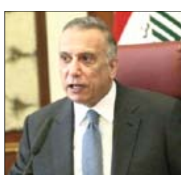
□ بغداد / المدى

أكد رئيس مجلس الوزراء مصطفى الكاظمي، أن أعضاء فريق التحقيق في حادث مستشفى ابن الخطيب يعملون على مدار الساعة ويتابعون شخصية منه. جاء ذلك خلال جلسة مجلس الوزراء التي عقدت أمس الثلاثاء، حيث قال: ” نتظر تقريرهم بالموعد الذي حددناه، وسنعمد نتأجه بالكامل ” . وأضاف الكاظمي: ” على الوزراء ان ينزلوا لدوايرهم والعمل الميداني المتابعة متطلبات المواطنين، وحل الإشكالات وتسهيل الإجراءات، وكذلك الإطلاع على إجراءات السلامة في جميع المباني ” . ولقت رئيس مجلس الوزراء، خلال جلسة مجلس الوزراء أمس، إلى أنه هناك تقييمات للوزراء والمسؤولين وسيتم اتخاذ قرارات صعبة ” ، مستدركا: ” هدفنا خدمة أبناء شعبنا وتحسين الأوضاع، للوصول الى انتخابات مبكرة نزيهة ” . ■ التفاصيل ص 2