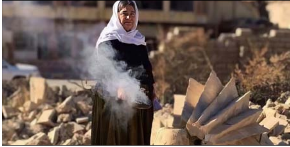
امرأة إيزيدية في سنجار