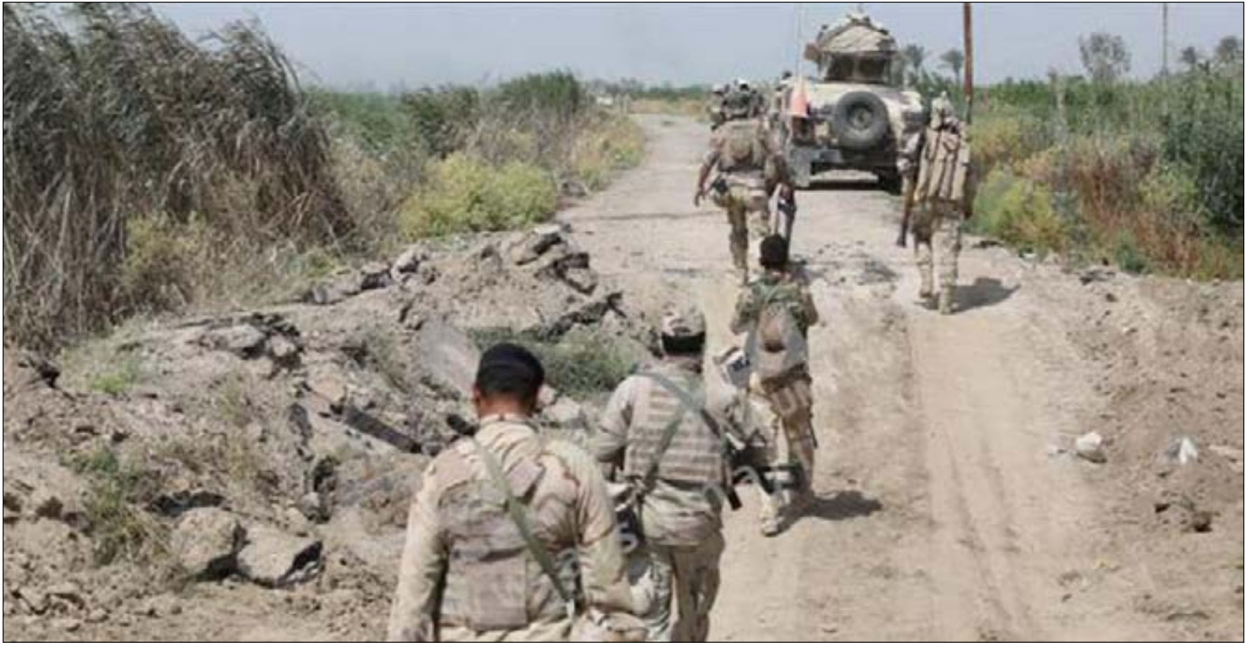
قوة عسكرية في شرق ديالى... ارشيف