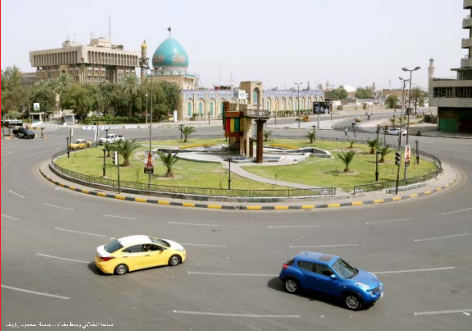
ساحة الخلائي وسط بغداد... عسمة: محمود رؤوف