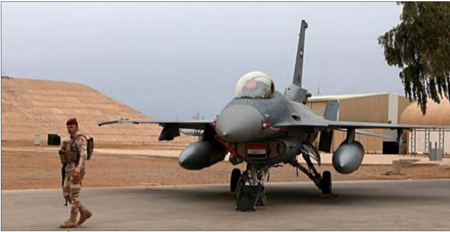
نحو ٢٠ صاروخاً سقطت في قاعدة بلد منذ مطلع العام

الماضي، تعليقا على خبر عدم تمكن طائرات أف ١٦ من تنفيذ ضربات جوية دقيقة، في تصريح على الوكالة الرسمية ان "الجهود الفنية لكوادر قيادة القوة الجوية من مهندسين وفنيين تتواصل في اقامة وصيانة وتسليح طائرات أف ١٦". وأضاف حينها، أن "القوات العراقية اكتسبت الخبرات العالية في مجال اقامة وتقديم الخدمات إلى طائرات أف ١٦، مؤكدا أنه لا صحة بعدم طيران طائرات أف ١٦ وعدم تمكنها من تنفيذ ضربات جوية دقيقة". ومساء الاثنين قررت شركة "لوكهيد مارتن" الأمريكية سحب فرق الصيانة الخاصة بصيانة طائرات (اف ١٦) لأسباب قالت بانها أمنية. وقال جوزيف لاماركا جونيور، مسؤول الاتصالات بالشركة في بيان، إنه "بالتنسيق مع الحكومة الأمريكية ومع اعتبار سلامة الموظفين على رأس