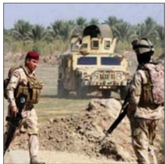
قوة أمنية تلاحق داعش

وفي تقريره السادس لمجلس الامن قال خان ان فريق الامم المتحدة التحقيقي توسع بجمع الادلة على نحو سريع خلال الاشهر الستة الماضية. وقال خان "حدثت تطورات مهمة في جمع ادلة الطب العدلي من مواقع المقابر الجماعية واستخراج المعلومات الرقمية من ذاكرة حاسبات كانت تعود لتنظيم داعش مع ترقيم ملفات القضايا واستخدام ادوات تكنولوجية متطورة لمعالجة وبحث قواعد معلومات سمحت للفريق بان يؤسس قوائم وبيانات ادلة مهمة على انشطة عناصر قيادية من تنظيم داعش".