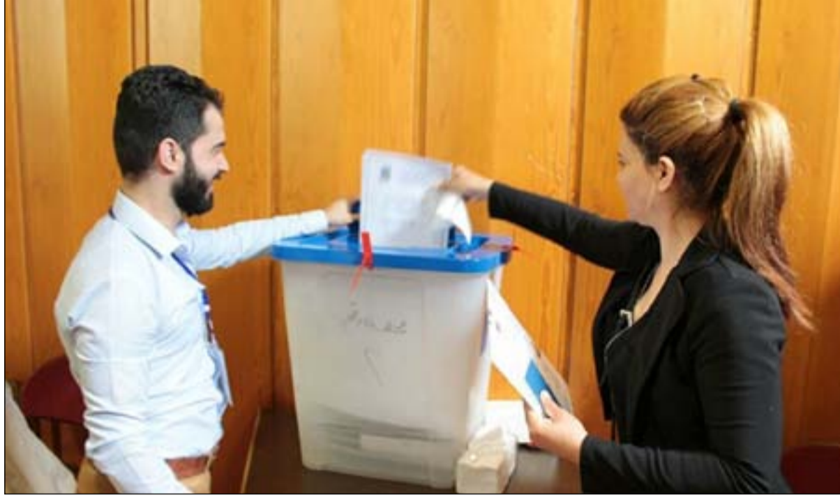
مركز اقتراع في خارج العراق

الانتخابات البرلمانية الذي يميز بين عراقيي المهجر وعراقيي الداخل"، موضحاً أن "القانون ألزم مشاركة عراقيي الخارج بالاقتراع بطاقة البايومترية بشكل حصري، في حين الداخل سيكون لهم الخيار بالبايومترية والالكترونية". ويلفت كنا إلى أن "الكتل المعارضة على إلغاء اقتراع الخارج