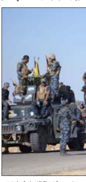
قوة من الشرطة الاتحادية.. ارشيف

تُنشئ لأغراض سياسية من قبل مسلحين ومتمردين لإظهار عدم كفاءة السلطات الحاكمة وخذلانها وليت الرعب بين السكان. ويستخدم العنف ايضا من قبل مجاميع عرقية او دينية لتحقيق السلطة والسيطرة وكسب الشرعية من خلال وسائل غير تقليدية. العراق ما يزال يعتبر بلدا خطرا امنيا، وقد يكون قد دخل اول تجربة ديموقراطية منذ قيام اول انتخابات برلمانية في عام ٢٠٠٥، ولكنه ما يزال دولة تعيش تحديات وثغرات امنية داخلية وتهديدات داخلية لقيادتها. غالبية الشعب ليست لهم ثقة بالنظام الحاكم ولكن بدلا من ذلك لجأوا الى وضع ثقتهم بمجاميعهم ومكوناتهم العرقية والانثنية والدينية والعشائرية. ويعتبر العراق ضمن مؤشر الشفافية من بين أكثر البلدان فسادا في العالم