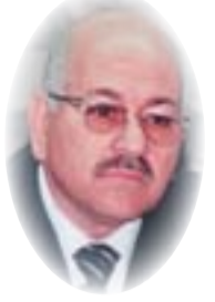
محمد حميد رشيد

في الانتخابات تم وضع مراقبين وممثلين لهم في مراكز الاقتراع للإشراف المباشر على عملية الانتخاب والفرز؛ ويمكن للقوى الوطنية الإستعانة بالهيئات الدولية المشرفة والمراقبة على الانتخابات والتعاون مع تلك الهيئات الرقابية في تأكيد التزوير والفساد إن وجد. وفي نفس الوقت يصعب من عمليات التزوير المتوقعة وقد يقلصها إلى أدنى حد ممكن، بينما عدم المشاركة يعطي الحرية والفرصة الأكبر للتزوير ولا يحد منه.