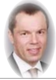
بقلم سرغيه كاراتف