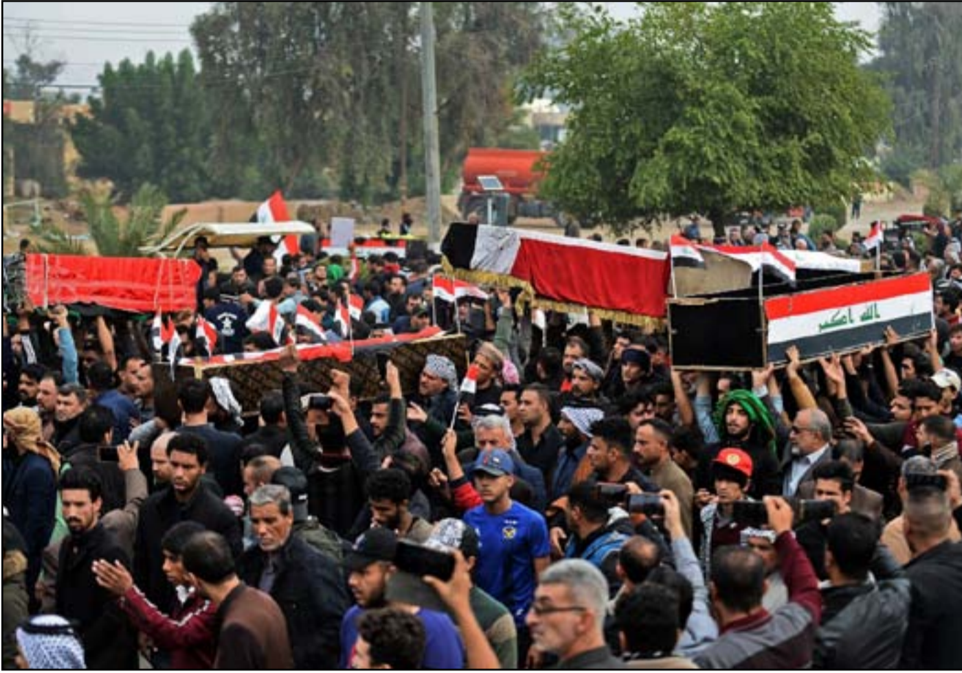
متظاهرون يحملون نعوشاً رمزية للتبديد بالناشطين...

بدوره، يقول المحلل السياسي هيثم التميمي إن النظام السياسي هو الذي يولد الحكومة وليس الانتخابات، مضيفاً أن "العملية الانتخابية يمكن أن تأتي بأسماء جديدة، لكن النظام السياسي القائم لن يسمح بجلب قوى جديدة أو جهات يرغب بها الشارع".