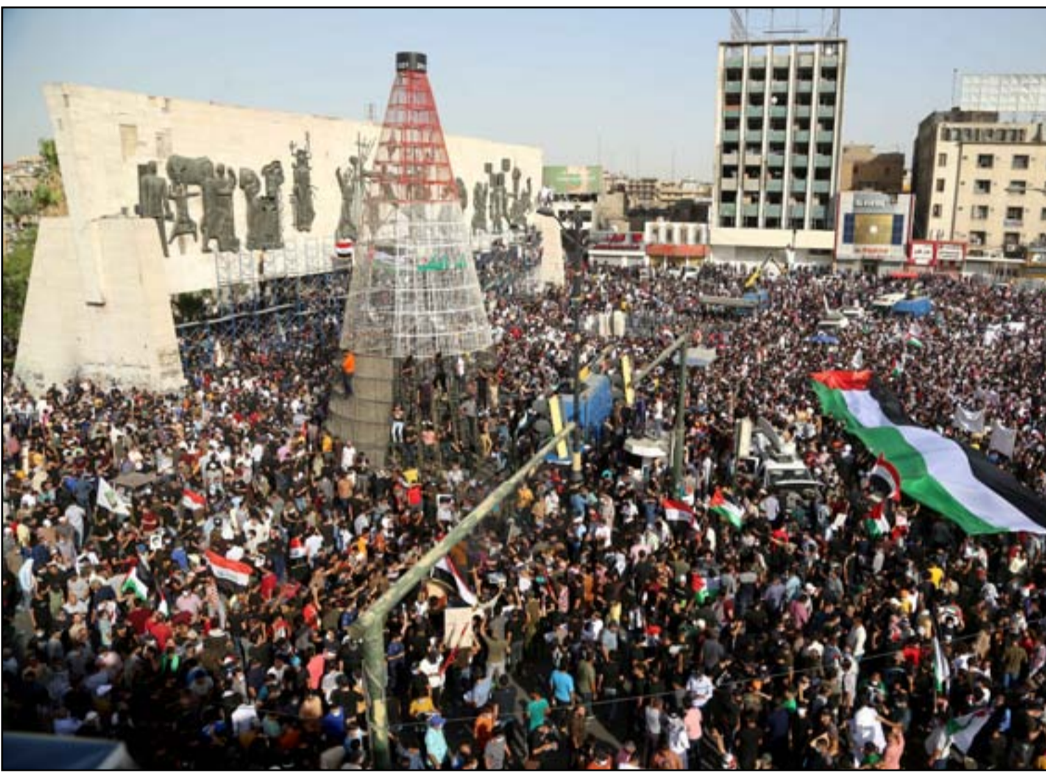
الآلاف يتظاهرون في ساحة التحرير لمؤازرة الفلسطينيين...