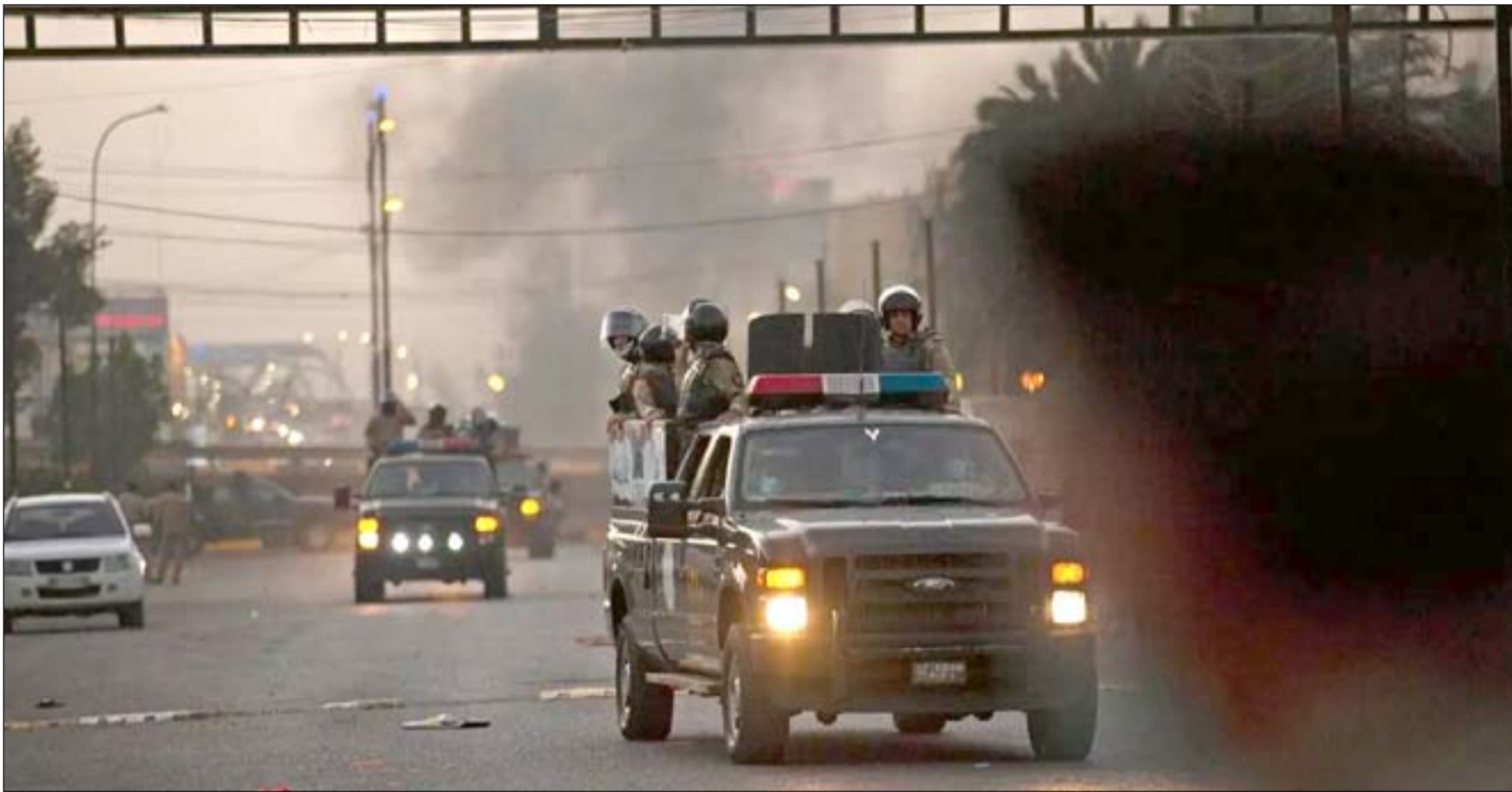
قوة عسكرية في البصرة .. ارشيف

ووَجَّه رئيس الوزراء مصطفى الكاظمي الخميس الماضي، بإرسال لجنة تحقيقية لمعرفة ملابسات الأحداث التي حصلت في محافظة البصرة في الليلة التي سبقتها، وذكر بيان لخلية الاعلام الأمني أن القائد العام للقوات المسلحة، وجَّه بإرسال لجنة تحقيقية لمعرفة ملابسات الأحداث التي حصلت في محافظة البصرة الليلة الماضية في مجمع القصور في هذه المحافظة ومعرفة المقصرين، لغرض اتخاذ الإجراءات القانونية اللازمة بحقهم. وبحسب المصدر الذي طلب عدم نشر اسمه ان "الفصيل المسلح الذي تنتمي اليه هذه العائلة هاجم خلية الصقور في القصور الرئاسية في البصرة بعد محاولة اعتقال صباح الوافي".