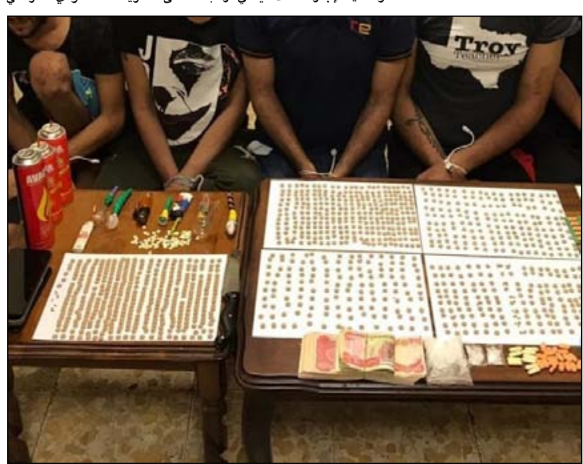
اعتقال عصابة تتاجر بالحبوب المخدرة.

وشدد قائد عمليات البصرة على "ضرورة القيام بعمليات استباقية وتفتيش واسعة في تلك المناطق وتشديد الإجراءات الأمنية في مراقبة