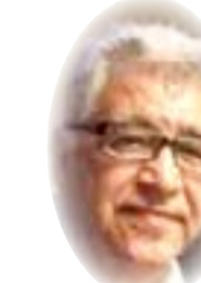
■ د. فالح الجمراني

رئيسين يديران المفاوضات بإشراف رئيس الوزراء العراقي مصطفى الكاظمي، وهؤلاء هم محمد عبد الرضا الهاشمي المعروف باسم أبو جهاد، وهو مستشار الكاظمي، ومستشار الأمن القومي العراقي قاسم الأعرجي. وقال مسؤولون إن المسؤولين كانوا يتنقلان بنشاط بين طهران والرياض وبغداد خلال الشهرين الماضيين، ولم يطلب الإيرانيون من المملكة العربية السعودية فتح نقطة تجارية لبيع النفط فحسب، بل دعو أيضاً المواقع الإلكترونية ليصبحوا "شركاء في الإدارة" مع الحكومة اليمنية. وطالب السعوديون بدورهم بوقف هجمات الحوثيين على أصولهم النفطية والاقتصادية، ووقف التحريض الإيراني ضد السعودية في السول ذات النفوذ العام، خاصة إلى العراق واليمن ولبنان وسوريا. بالإضافة إلى ذلك، فإن السعوديين طالبوا بمزيد من المشاركة السنبة في مؤسسات الحكومة العراقية بطريقة تعكس بشكل أفضل مصالحهم في البلاد، وكذلك إنهاء الهجمات التي تشنها الجماعات العراقية المدعومة من إيران على الحلفاء السعوديين والمستثمرين المحتملين داخل العراق، وكان أكبر اهتمام سعودي هو وقف هجمات الحوثيين على منشآتهم، وطالب السعوديون بوقف كل أشكال التحريض ضدهم بما في ذلك التحريض الإعلامي. وقال مصدر مقرب من إيران في هذا الصدد "خلال هذه الرحلة، لم يتحدوا بالتفصيل عن لبنان أو العراق".