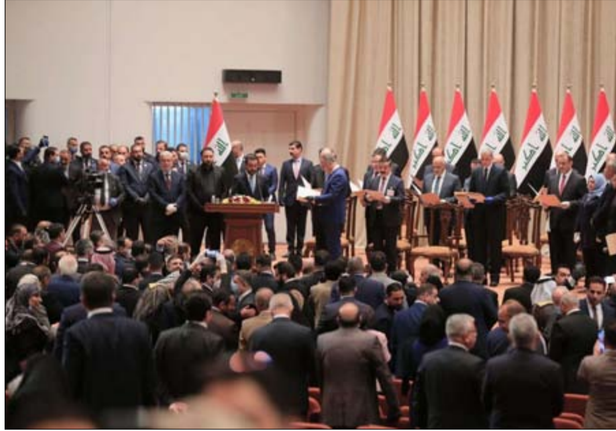
جلسة منع الثقة لحكومة الكاظمي .. ارشيف

ما زالت الخلافات قائمة بين الكتل السياسية على استئناف جلسات البرلمان بعد عطلة العيد تهيئاً لعرض قائمة التعديلات الوزارية المقترحة من قبل رئيس الحكومة للتصويت. بالمقابل تطالب كتل سياسية باستجواب بعض الوزراء قبل التصويت على استبدالهم. ويريد رئيس الحكومة مصطفى الكاظمي استبدال خمسة من طاقمه الوزاري وهم كل من وزير الصحة (المستقبل) والمالية والصناعة والتجارة والزراعة، وسيرسل الاسماء البديلة إلى مجلس النواب حال اتفاق القوى السياسية على تحديد موعد عقد الجلسة المقبلة.