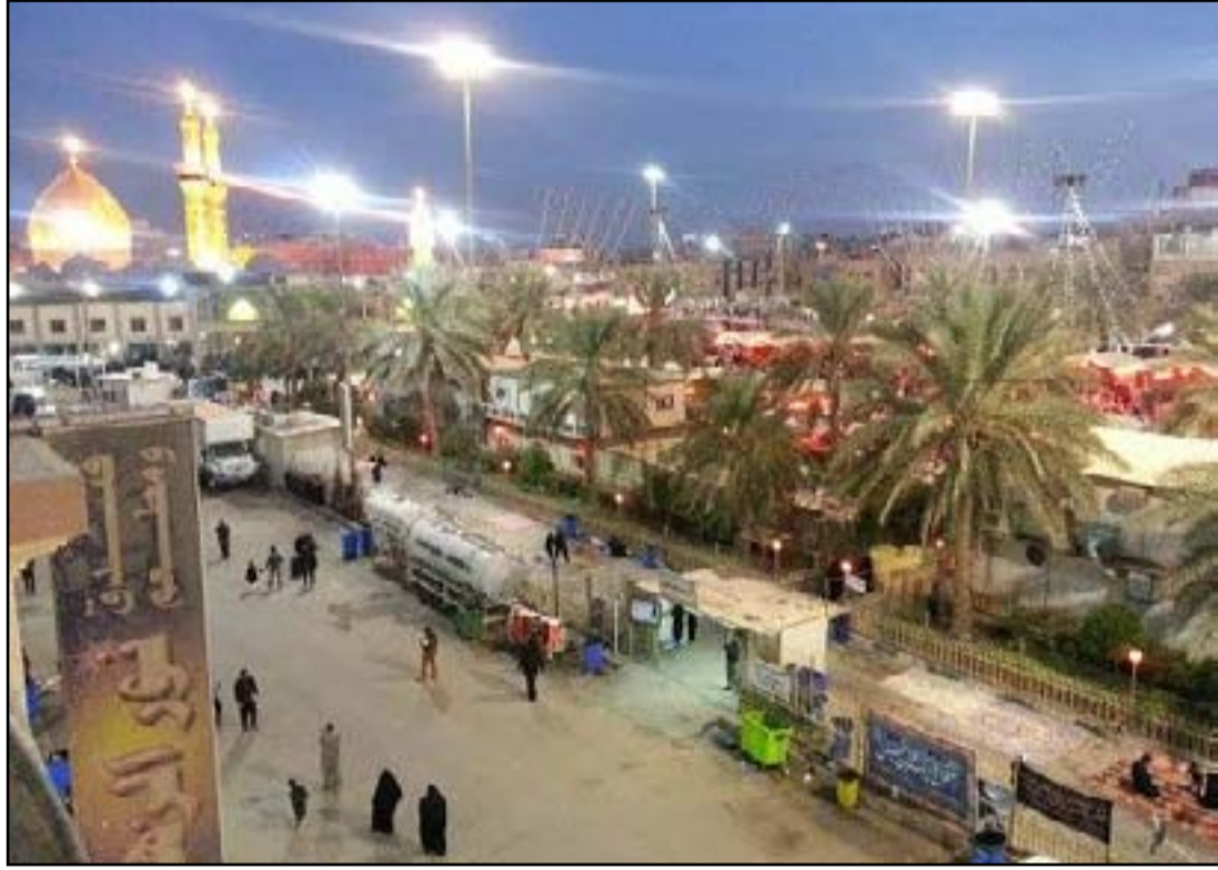
السياحة في كربلاء تستغيث

وعلى صعيد متصل، أكد مدير سياحة كربلاء أن هناك الكثير من الأسس والمعايير لاختيار كربلاء المحافظة عاصمة السياحة العربية، ومن هذا المنطلق قدمت كربلاء إلى المديرية العامة لهيئة السياحة الملف الكامل لهذا المشروع وهو إلى الآن في طور الدراسة لتشكيل لجنة لغرض إنجاز كافة الإجراءات التي يتطلبها هذا المشروع.