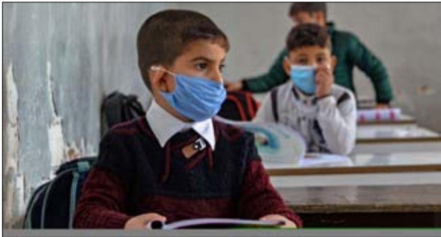
طلبة في إحدى المدارس