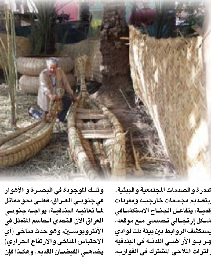
وتلك الموجودة في البصرة والأهوار في جنوبي العراق، فعلى نحو مماثل لما تعانیه البندقية، يواجه جنوبي العراق التحدي الحاسم المتمثل في الأنتروبوسين، وهو حدث مناخي (أي الاحتباس المناخي والارتفاع الحراري) يضاهي الفيضان القديم. وهكذا فإن