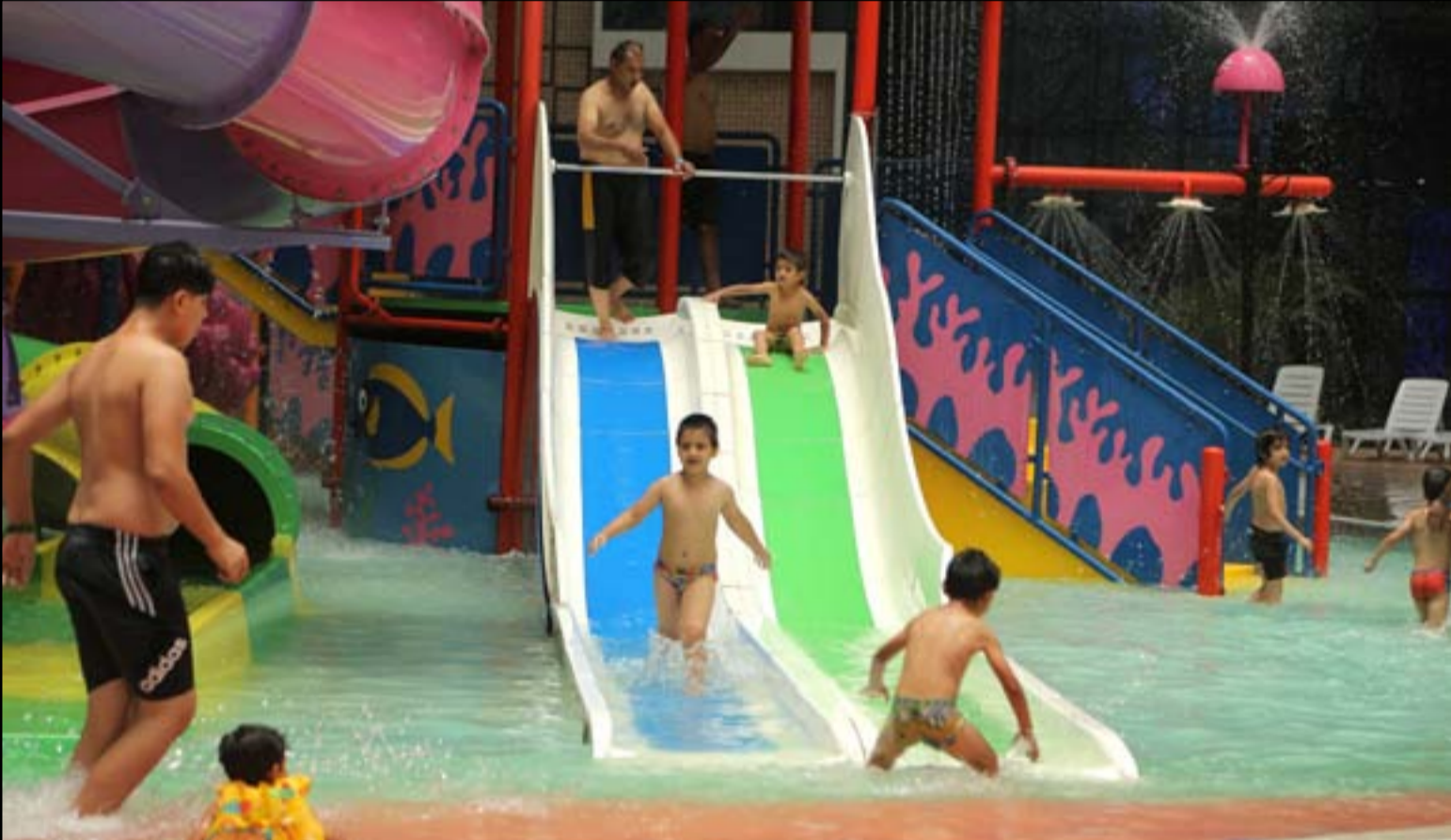
المدينة المائية تفتتح ابوابها مجددا بعد تراجع معدل الاصابات بكورونا.. عداة، محمود رؤوف

ما زالت الخلافات قائمة بين الكتل السياسية على استئناف جلسات البرلمان بعد عطلة العيد تمهيدا لعرض قائمة التعديلات الوزارية المقترحة من قبل رئيس الحكومة للتصويت. بالمقابل تطالب كتل سياسية باستجواب بعض الوزراء قبل التصويت على استبدالهم. ويريد رئيس الحكومة مصطفى الكاظمي