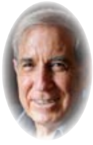
■ بقلم شلومو بن-آمي

لكن المتظاهرين العرب الشباب يمكن أن يدعوا النصر في هذه المواجهات، لأنهم أجبروا الحكمة العليا الإسرائيلية على تأجيل حكم بشأن عمليات الإخلاء في الشيخ جراح، كما أجبروا الشرطة على تغيير مسار مسيرة يوم القدس بعيداً عن حارة المسلمين في البلدة القديمة. امتد الصراع إلى إسرائيل قبل عام 1967، حيث حرضت الجماعات الإسلامية الشباب العرب الإسرائيليين. اندلعت المدن العربية اليهودية المختلطة التي كان من المفترض أن تكون نماذج للتعايش، مثل عكا والرملة ويافا واللد، وانزلق الجميع في عريضة من العنف