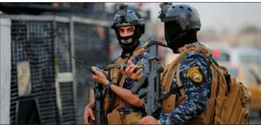
قوة أمنية تابعة لوزارة الداخلية