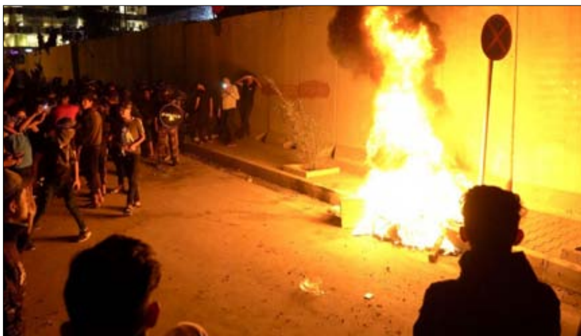
نيران بجانب القنصلية الإيرانية في كربلاء... أرشيف