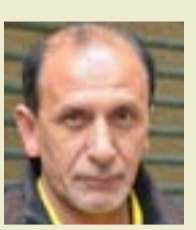
Portrait of a man

ليست في الإضبارة قصيدة شعرية تصافح للديوان أو مقالة تنفع الدراسة ولست وريشاله كي أنتفع من شهادة الوفاة . فخاب ظن طالب القروغولي وعادت بشاشة الانتصار على وجه الموظف ولكني ومن دون تفكير أو احتراز طلبت شهادة الوفاة وبعد نظرة استفهام منها تلاحقت طلي بأنها تقيديني في تدوينها وأنا أتحدث عن حياته ويوم وفاته وتكون شاهداً إدارياً وثيقة رسمية على تاريخ الوفاة ( 1972 / 10 / 4 ) ..