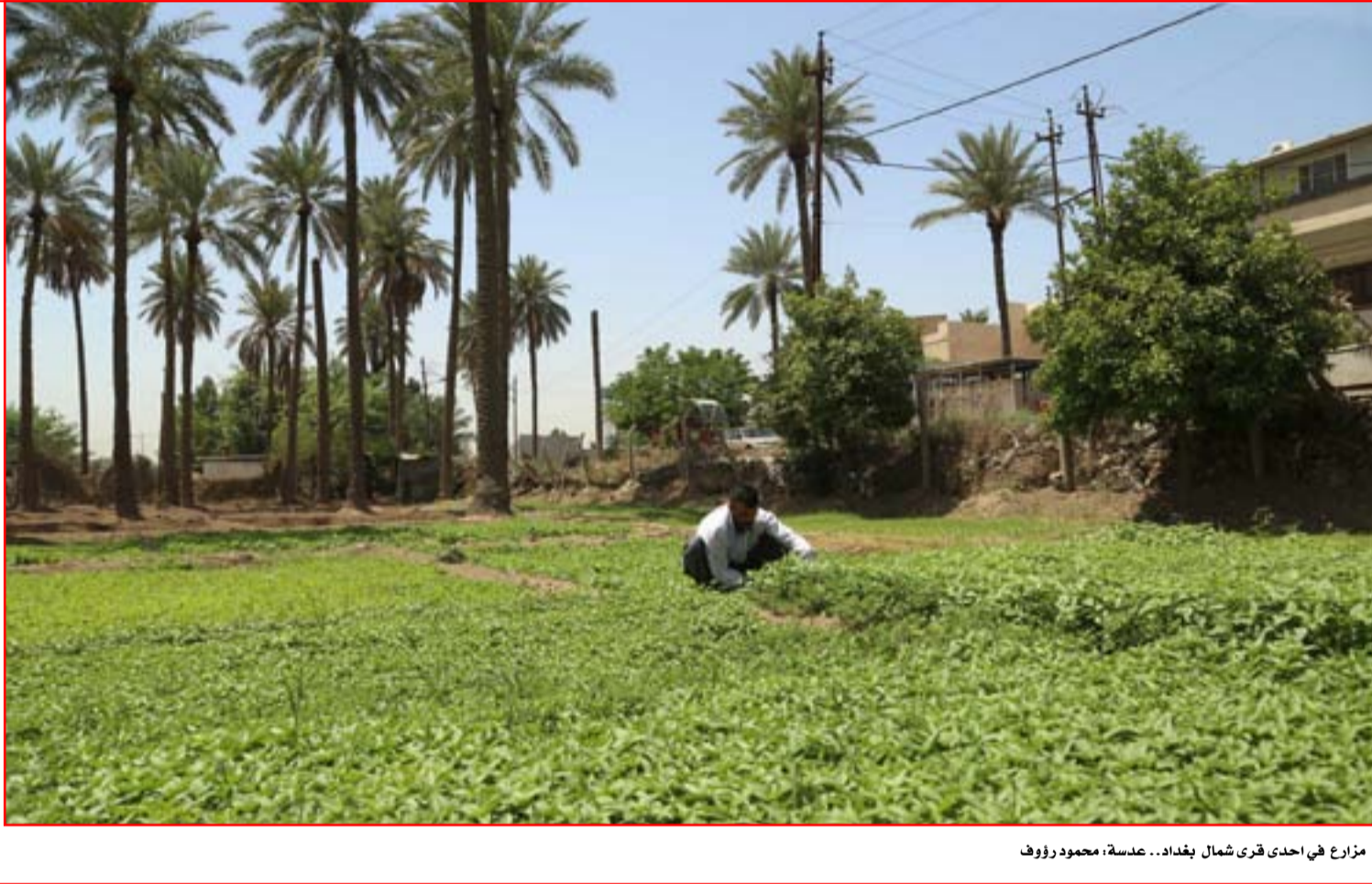
مزارع في احدى قرى شمال بغداد..