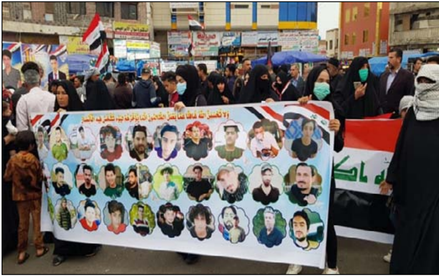
متظاهرون يحملون صور الشهداء

ويرى النائب السابق أن "تأجيل الانتخابات وفق هذه المحادثات باتت عديمة القيمة سواء أجريت في موعدها المحدد أو أرجحت إلى موعد آخر"، متوجعا "تأجلا جديدا للانتخابات البرلمانية المبكرة وفق الإشارات الواضحة والظروف الراهنة".