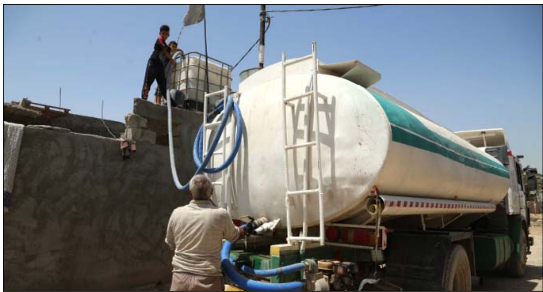
مناطق أطراف العاصمة تعتمد على "الحوضيات" لتوفير مياه الشرب..

بغداد / المدى قال وزير الدفاع العراقي جمعة عواد، الأربعاء، إن سبب إقالة قائد عمليات البصرة السابق من منصبه، هو محاولته حل "مشكلة" القصور الرئاسية على الطريقة العشائرية. واندلعت ليل الأربعاء الماضي اشتباكات بين قوة أمنية عراقية وعناصر فصيل موال لإيران في منطقة القصور الرئاسية في البصرة، بعد مدهامة أمنية لمنزل أحد مسلحي الفصيل، المتهم بتنفيذ عمليات اغتيال ناشطين. وأضاف عواد في رد على سؤال أن "قائد عمليات البصرة السابق اللواء الركن أكرم صدام حاول حل الخلاف والمواجهة المسلحة التي حصلت في مجمع القصور من خلال قيامه بطلب ما يعرف بالعبوة (الهدنة)". وشدد الوزير العراقي على أن البصرة "تعرض دائماً لتهديد السلاح المنقلت والزعات العشائرية". وكانت مصادر أمنية عراقية متعددة كشفت أن الاشتباكات وقعت في البصرة بعد قيام "فصيل مسلح يتبع عصابات أهل الحق بمهاجمة مقر خلية القصور الاستخباراتية في القصور الرئاسية بمنطقة البراضية".