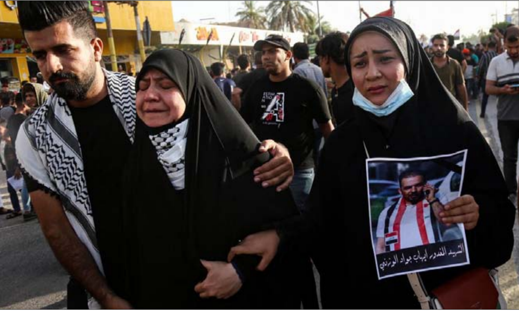
مسيرة في كربلاء للمطالبة بالكشف عن قتلة الوزني

وتشير المصادر في حديث ل(المدى) الى ان "حادث الاغتيال جرت امام منزل قيادي كبير في احد الفصائل، مبينا ان مقطع الفيديو الذي انتشر عن الحادث كان مسجل من "كاميرات المنزل". وأظهرت لقطات بالابيض والاسود من كاميرا مراقبة اقتراب مسلح على دراجة نارية من سيارة الوزني. توقف عند نافذة السائق وأطلق النار على الناشط ثم هرب في الغلام. وتتابع المصادر انه "جرى سحب عناصر الحماية المتواجدة منذ سنوات في الشارع الذي يسكن فيه القيادي في احد الفصائل قبل يوم واحد من الحادث". كما تؤكد المصادر ان "تلك الحميات