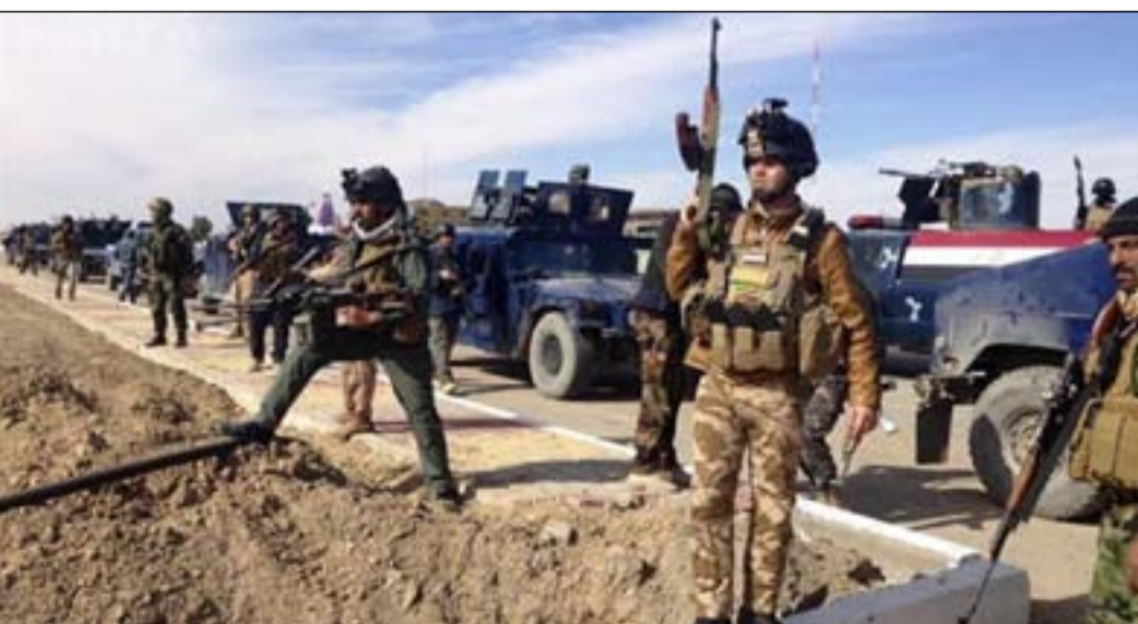
قوة أمنية تلاحق داعش

والتي وعد الكاظمي في تغريدة باعتقال قاتليها