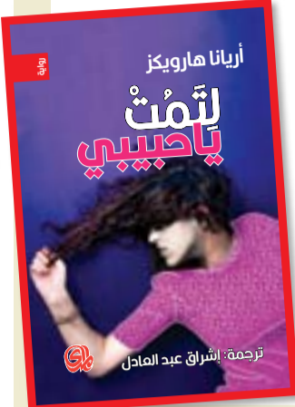
ترجمة: الشراق عبد العادل

عن دار المدى صدرت رواية أريانا هارويكز " لتمت يا حبيبي " ، وفي هذه الرواية نمطاً من النساء يثير التعاطف في نفس القارئ بسبب اضطراباتها التي تحيلها إلى كائن ضعيف، لكنه سرعان ما يتخلى عن شعوره هذا عندما يستنزه بل يثير نفوره واشمئزازه شعور مناقض يمارسه عليه سلوك وحشي غريب يرافق البطلة على امتداد الرواية، بل يسبقه شعور مفاجئ آخر يقوده إليه عنوان الرواية وما تلاه من بداية حيث نداعب البطلة السكنين بيدها وتراودها فكرة قتل زوجها وابنها. امرأة لا تحف عن السعي إلى موتها وهي ترى في نفسها صورة للمرأة التي تطاردها رغباتها ورغبات الرجال