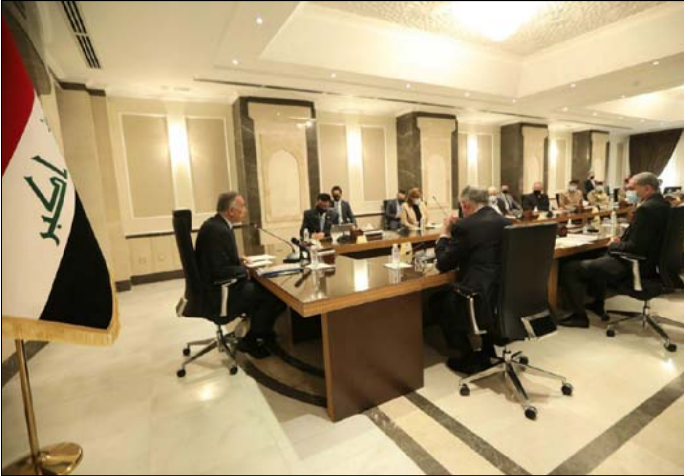
اجتماع حكومي سابق لمناقشة ملف الفساد - إرشيف

القضاء سيطلب رفع الحصانة عن عدد من النواب