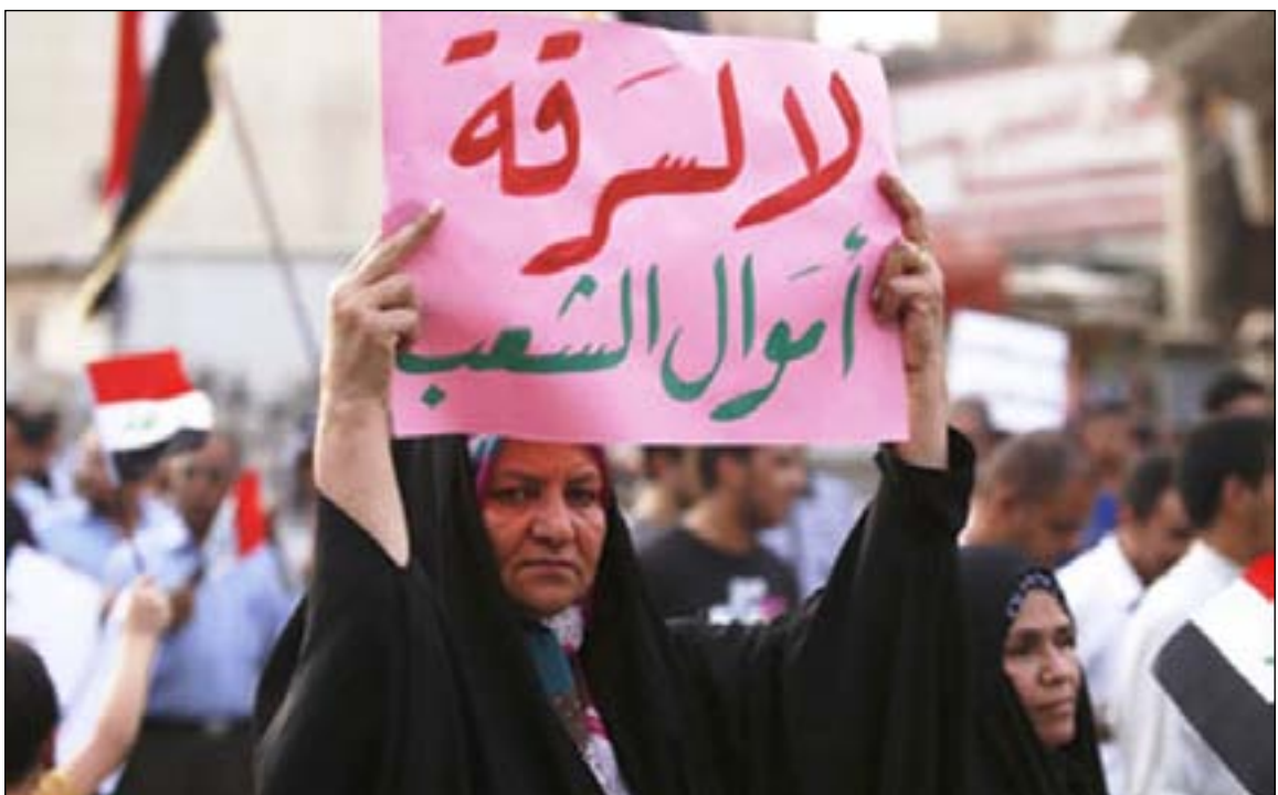
جانب من تظاهرات سابقة.. ارشيف

كثير من المدارس في الموصل تعرضت لأضرار جسيمة جراء عمليات التحرير. تعرضت مدرسة أسكي كارافان لأضرار قبل غلقها في عام ٢٠١٦. وخلال الفترة ما بين كانون الثاني وشباط من العام الحالي قامت منظمة أكتد بإعادة تأهيل المدرسة من خلال تنفيذ الاعمال الأرضية والتجهيز وربط شبكة الاسالة فيها لمدها بالماء الصالح للشرب للطلبة الصغار. وكذلك ربطها بشبكة الكهرباء وتوفير المعدات الصحية من معازل ومواد تعقيم. تأهيل هذه المدرسة ساعد في تخفيف الضغوط على المدارس الأخرى المجاورة في المنطقة. وتمت أيضاً مراعاة التباعد الاجتماعي في الصفوف للوقاية من مرض كورونا. مدرسة كورنا اصلان ضمن منطقة حمام العليل، هي من بين مدارس أخرى في محافظة نينوى تعرضت لتدمير خلال الحرب، ومع إجراء عمليات تأهيل مؤقتة للبنى التحتية فيها تمكنت من استضافة تلاميذ واستمرار العملية التربوية فيها. وساعدت المنظمة الفرنسية في نقل مدرسة كارافان أخرى في القرية إلى منطقة أكثر أمناً وظروف صحية أفضل وذلك عبر رفع الانقاض وتوفير مصدر مياه شرب وتجهيزها بمستلزمات المرافق الصحية والنظافة المطلوبة للوقاية من وباء كورونا. وقبل اجتياح تنظيم داعش الإرهابي