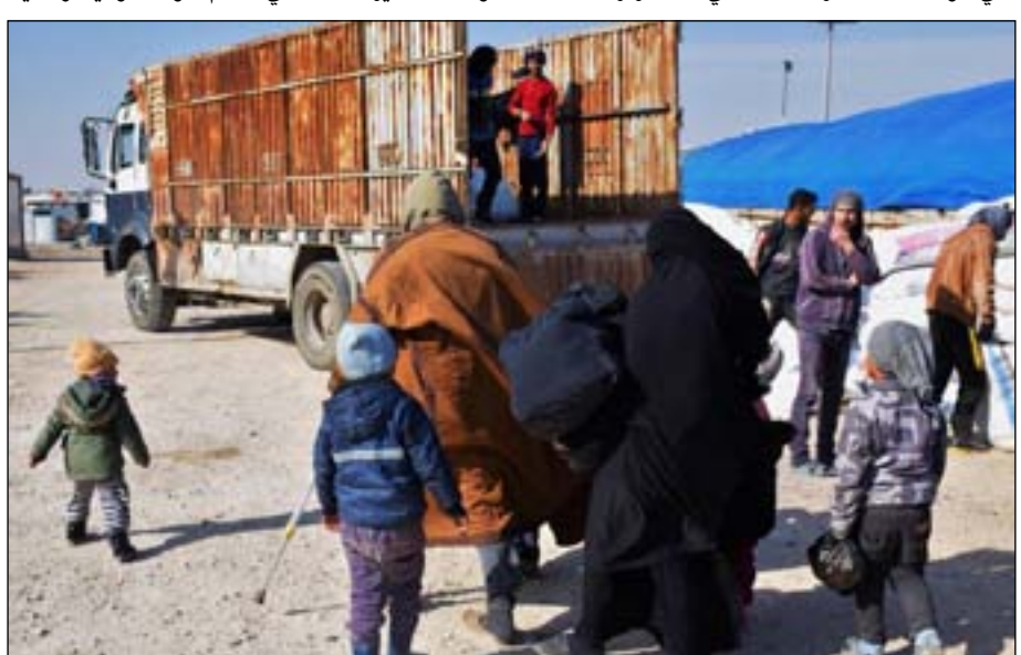
نازحون يعودون لمناطقهم... أرشيف

ويرى القسم الأكبر من أيزيديي سنجار أن جلب عوائل الدواعش إلى هذا المخيم يمثل تهديداً مباشراً لمنطقتهم، ويؤكد قسم من أهالي ونوي ضحايا داعش، أنهم يعرفون الدواعش الذين في مخيم الهول ممن شاركوا في خطف وقتل الأيزيديين. في صيف العام ٢٠١٤ تم اختطاف ٦٤١٧ أيزيدياً من قبل مسلحي داعش، وهناك مخاوف من عودة داعش للظهور في سهل نينوى، مع عودة هذه العوائل الداعشية إلى المحافظة.