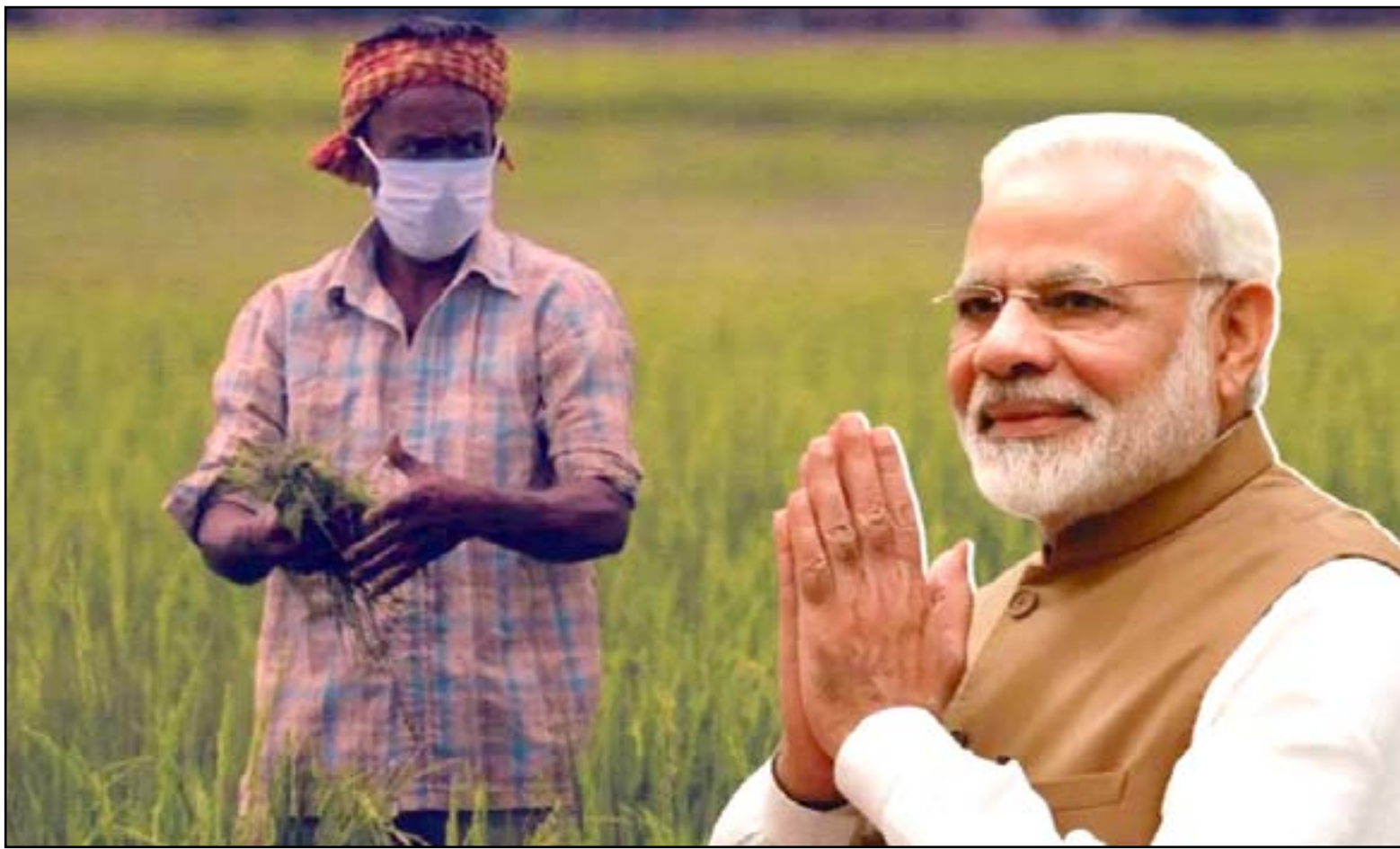
ملتزمون بمضاعفة دخل المزارع

الاتفاقية بين المزارعين والمشاركين من الشركات ستقتصر على التعاقد بشأن المحاصيل ولن يكون للأخير أي حقوق في الأرض لأنها ستظل مملوكة للمزارعين فقط. في حالة الإخفاق بتنفيذ الاتفاقية من أي جانب، أو في حالة نشوء نزاع، ينص القانون أيضاً على آلية تسوية المنازعات من ثلاثة مستويات لضمان الشفافية والعدالة في الأعمال، هذا الحكم لصالح المزارعين حيث يتم نقل مخاطر عدم القدرة على التنبؤ بالسوق بشكل كبير إلى الجهات الكفيلة. أيضاً يجلب مشروع القانون هذا عدداً كبيراً من الفوائد للشركات الناشئة في مجال التكنولوجيا الزراعية واللاعبين المنظمين الذين يربطون المزارعين بالأعمال التجارية