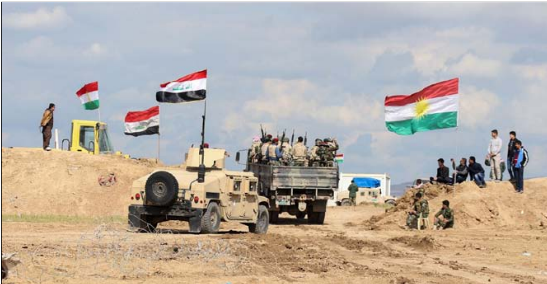
قوات من الجيش والبيشمركة

قوات الإقليم لا تدخل مركز كركوك والحشود الغربية تعود أدرجها