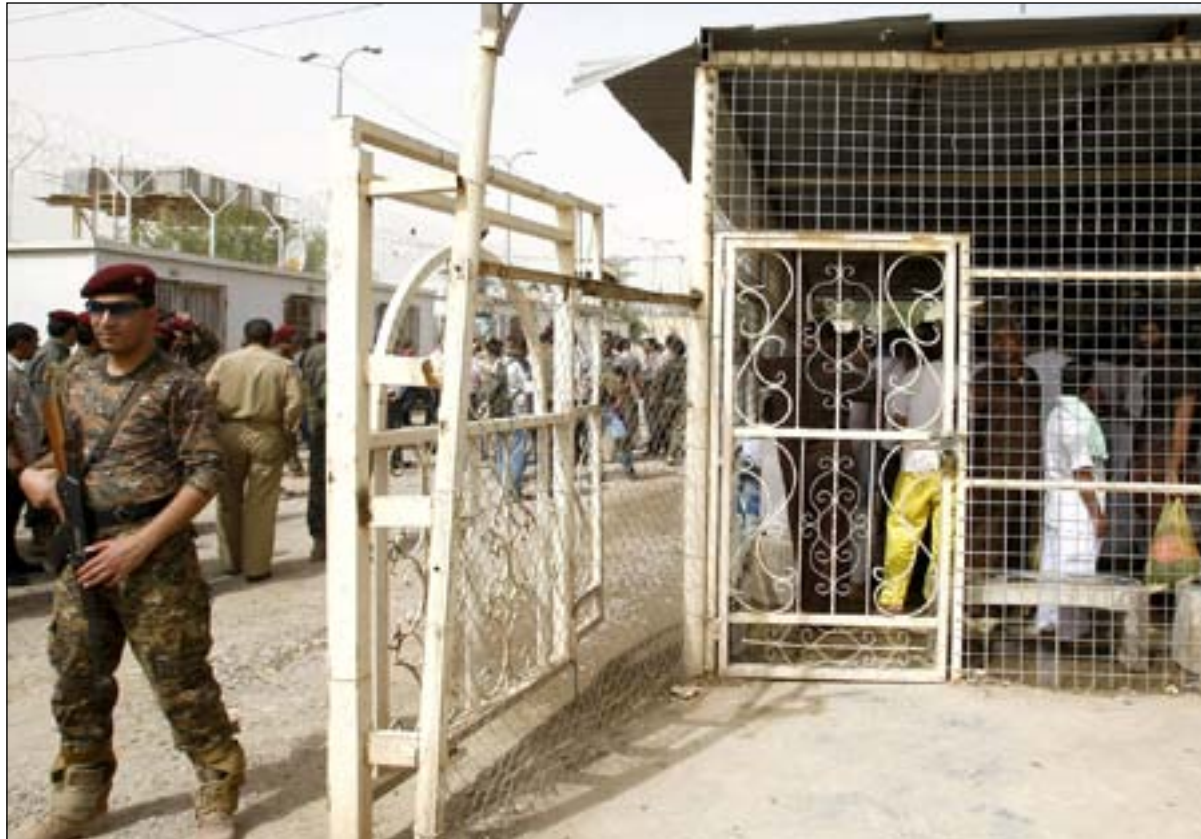
نزلاء في احد سجون بغداد

ويقول مصدر مطلع في تصريح لـ(المدى) إن تبني تشريع قانون العفو العام من قبل كتل وجهات وأحزاب سياسية معينة ومحددة يندرج ضمن الدعاية الانتخابية المبكرة لهذه الأطراف، كاشفاً أن الهدف الأعم من وراء تمرير هذا القانون يشمل أكبر عدد من السياسيين المتهمين والمدانين بعمليات فساد مالي وإداري. وأعلنت اللجنة القانونية النيابية نهاية الأسبوع الماضي عن إعداد نسختين لتعديل قانون العفو العام عن بعض المحكومين تتضمن الصيغة الأولى إصدار عفو