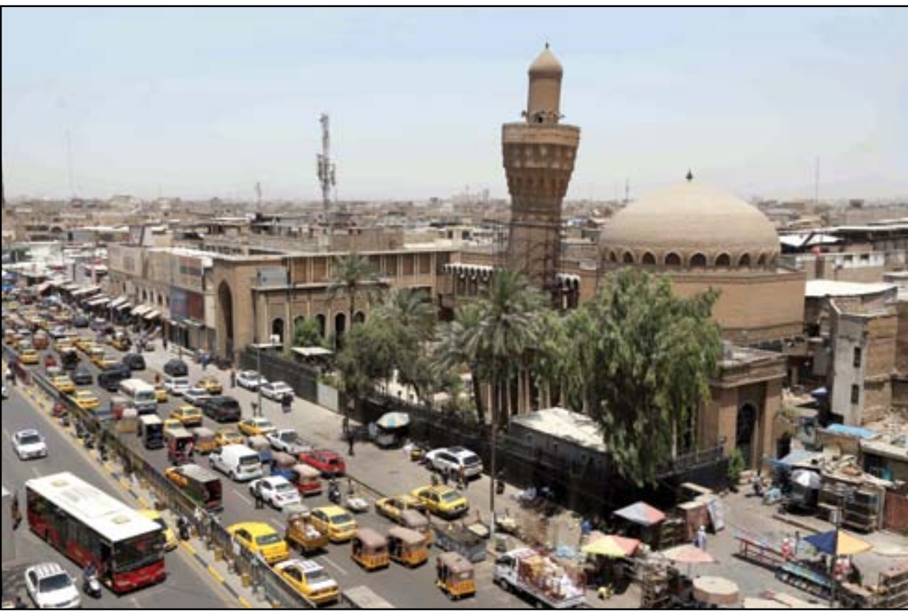
المدينة التجارية وسط بغداد مغلقة بسبب الزحامات المرورية..

وأثارت الأنباء الأخيرة بشأن إعادة عوائل لتنظيم داعش من مخيم الهول في سوريا، إلى