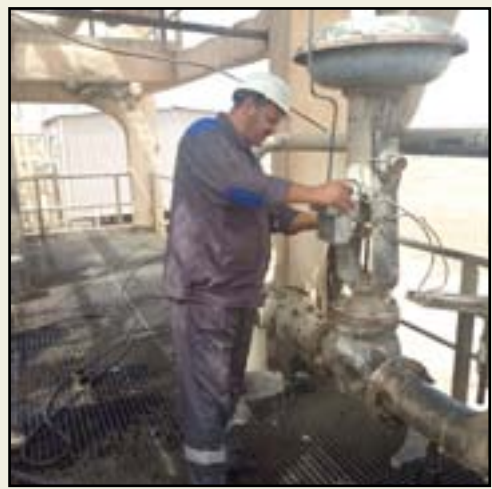
مهندس فني يعمل على صيانة مضخة الحقل شرق بغداد

وتائر العمل وصولاً إلى تحقيق معدل الانتاج ما قبل التوقف وما يسهم في رفد وإسناد وتعظيم الموارد لدفع عجلة الاقتصاد الوطني".