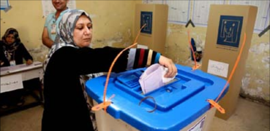
امرأة تلي بصوتها في الانتخابات الماضية

ولاحظت النائبة عن صلاح الدين منار الشديدي، أمس الأربعاء، من تهديد "أموال الفاسدين" على نزاهة العملية الانتخابية. وتحدثت عن سيطرة جهات سياسية مخضرة على الدوائر الانتخابية عبر "المال السياسي" والاستحواذ على المقدرات. وقالت الشديدي إن "جهات وقوى سياسية متنفذة ومهيمنة على مقدرات المحافظات منذ سنوات طويلة تسعى لهيمنة على مجريات العمليات الانتخابية بفعل الاموال الفاسدة التي اقتطعوها من مقدرات وحقوق الشعب لحساب مصالحهم الحزبية والانتخابية". وأشارت الشديدي إلى أن "الكثير من المحافظات حبسية منظومات مالية فاسدة طيلة السنوات الماضية وتنهب المال العام عبر مشاريع وهمية ومخصصات خدمية". ودعت النائبة، الحكومة ومفوضية الانتخابات الى "إلزام المرشحين من المحافظين ومصدره الدوائر والوزراء والمسؤولين والبرلمانيين في الدولة بترك مناصبهم والتوجه لحملاتهم الانتخابية بعيدا عن استغلال موارد الدولة والشعب