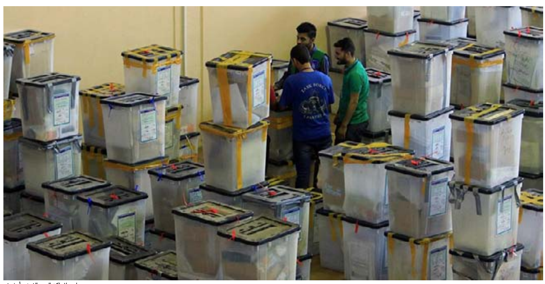
لحد المركز العد والغرز.. أرشيف

ورفض رئيس ائتلاف دولة القانون نوري المالكي في بيان تشكيل حكومة الطوارئ قائلاً إنها تعني تمرداً على الديمقراطية وأصول تداول السلطة برلماناً والإساءة والانتقاص من إرادة الشعب العراقي الذي حزم أمره للمشاركة الواسعة في الانتخابات، مشدداً على عدم "تضييع جهد المفوضية العليا للانتخابات بعدما قطعت شوطاً في التحضير وتجاوز الصعوبات والتحديات".