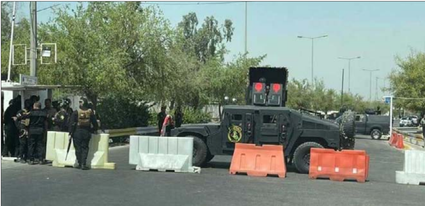
قوة عسكرية تطلق الخضراء على خلفية اعتقال قاسم مصلاح

ناشطون: أخذنا "استراحة محارب" وسنعود للساحات