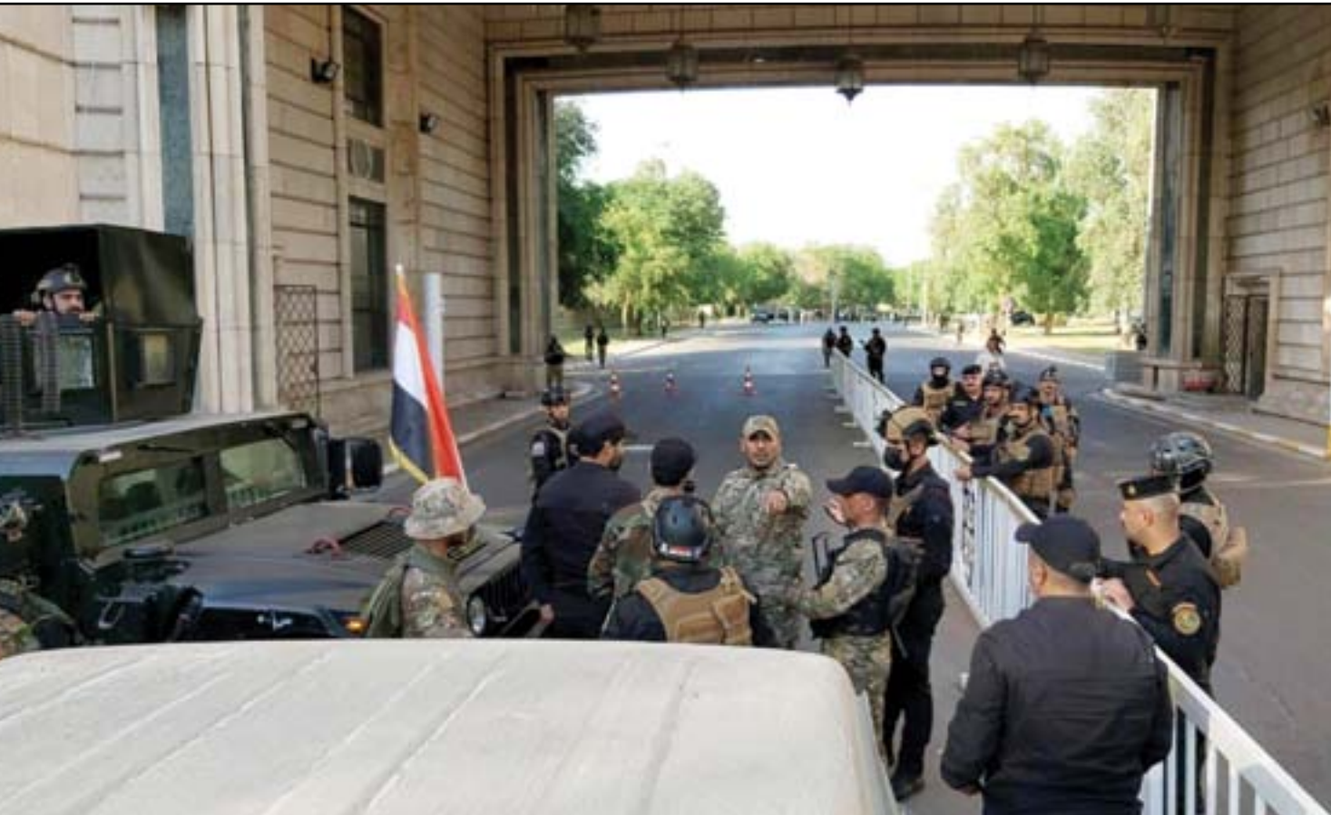
قوة من الحشد ومكافحة الإرهاب في أحد مدخل المنطقة الخضراء

أعلن رئيس الحكومة مصطفى الكاظمي، في وقت متأخر من يوم أمس، أن المظاهر المسلحة التي شهدها اليوم انتهاك خطير للدستور والقوانين النافذة، وأن الحكومة شكلت لجنة للتحقيق في هذا الخرق. وأضاف في بيان تلقته (المدى) إن قائد عمليات الأنبار للحشد الشعبي قاسم مصليح في عهدة العمليات المشتركة لحين انتهاء التحقيق. ووفق وثائق مسربة أن مصليح اعتقل وفق مذكرة 4 إرهاب، وأنه مدان بقتل ناشطين من كربلاء وهما فاهم الطائي وإيهاب الوزني. وحاول عناصر من الحشد الشعبي تطويق المنطقة الخضراء منذ ظهر يوم أمس للإفراج عنه. ونقلت وسائل التواصل الاجتماعي فيديوهات عن عناصر من الحشد مدججين بالسلاح المتوسط والخفيف وهم يطوقون مجلس الوزراء أيضاً. كما نقل أحد الفيديوهات تواجده رئيس أركان الحشد عبد العزيز المحمداوي (أبو فدك) أمام مجلس الوزراء. وانسحب عناصر الحشد بعد بيان للممثلة الخاصة للأمين العام للأمم المتحدة في العراق جينين هينيس بلاسحارت. وقالت بلاسحارت في تغريدة لها عبر تويتر، إن "أي قضية اعتقال يجب أن تأخذ مجراها كما هو الحال مع أي عراقي. وبالتأكيد، لا ينبغي لأحد أن يلجأ إلى استعراض القوة ليشق طريقه".