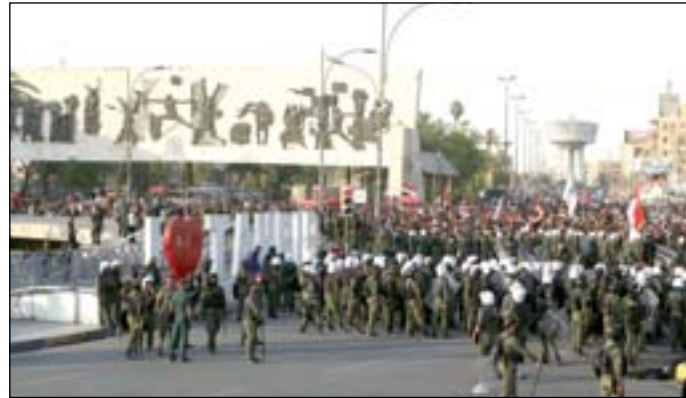
بحكومتها الكارتونية النافذة وسلاحها المنفلت وشبكتها الزبائنية الشرهة والراضعة من ثدي الدولة الفاسد. وأضاف "طرف مقهور اسمه المجتمع

المقاوم، بفنائه المحتجة المصلوبة على جدار الإعدام: الإعدام بالفقر وبالانزلال وبالشفاء وبالكاتم وبالرصاص والحي، طرفان فقط بلخصان الصراع ومساراته القادمة، ولا طرف ثالث. الشاعر والمخرج فارس حرام ذكر بعد انتهاء الاحتجاجات في منشور له "بتخطيط بسيط وصادق، وإمكانات تطوعية، وشحة بالدمع وأمام كل المضايقات والتخوين وحرب التسقيط، نجح الشباب اليوم بإعطاء درس في التحدي والوطنية لكل من في السلطة". وأضاف انهم "اقاموا تظاهرات حاشدة وناجحة بكل المقاييس، مع ما رافقها من غصات وأحداث متقلبة كنا توقعنا