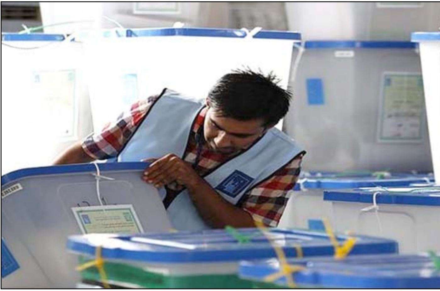
مركز اقتراع انتخابي