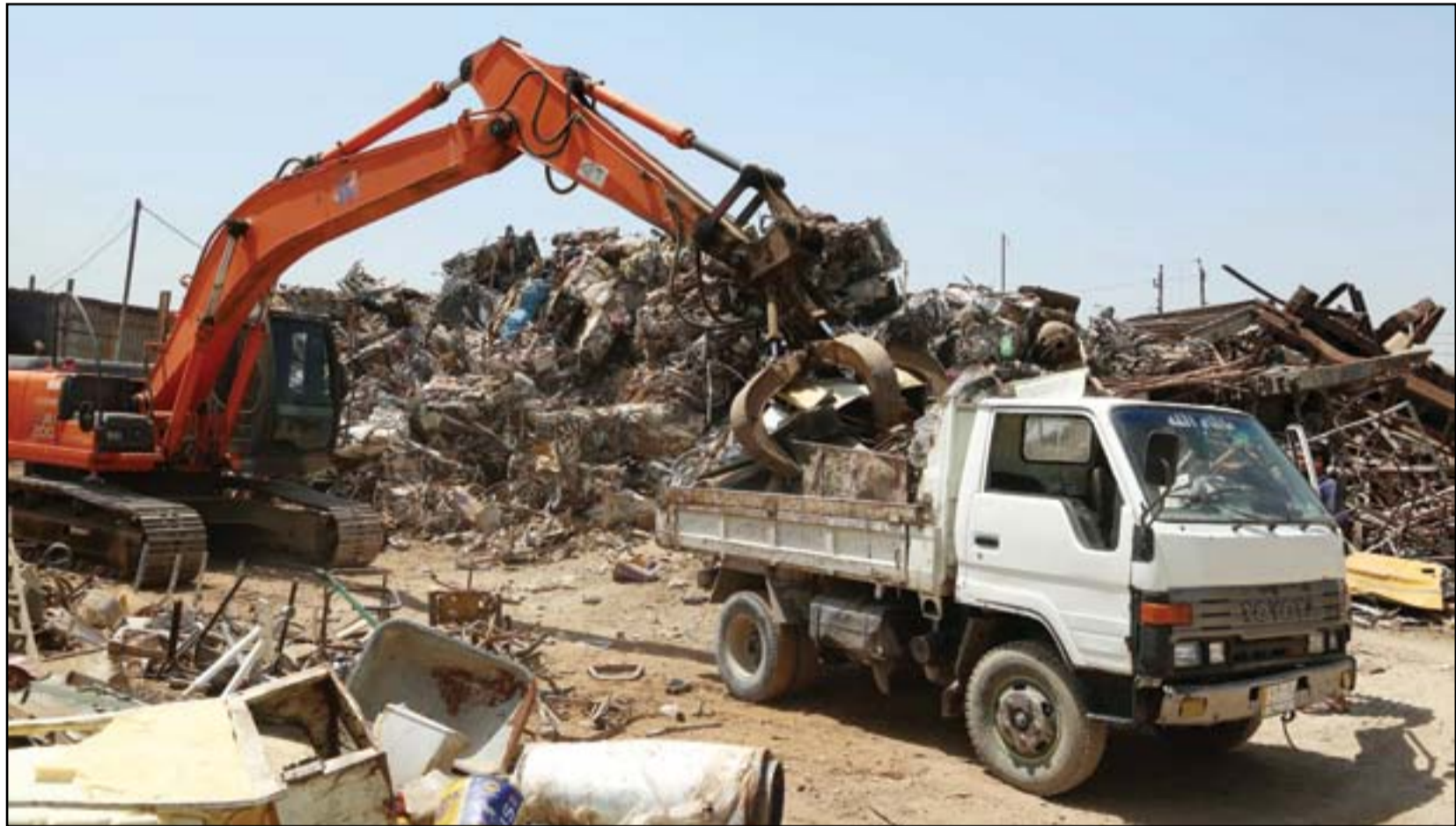
مكب لـ(السكراب) في منطقة باب الشيخ وسط بغداد.. هل يجوز ذلك؟ .. عدسة: محمود رؤوف

أمنية مشددة، عبرت نحو مئة عائلة عراقية ليل الثلاثاء من مخيم الهول في سوريا، إلى العراق لتستقر في مخيم الجعدة الواقع جنوب الموصل. وهي المرة الأولى التي يعاد فيها نازحون عراقيون من الهول الذي يضم أكثر من 60 ألف شخص بينهم أقارب لمقاتلين من تنظيم داعش. وقال مسؤول في الإدارة المحلية الكردية في شمال شرقي سوريا، إن العملية نظمت بموجب اتفاق بين بغداد والتحالف الدولي لمكافحة تنظيم داعش الذي تقوده واشنطن، وتشكل "الموجة الأولى" على أن تليها دفعات أخرى. وأعادت العملية إلى أذهان الكثير من سكان الموصل ذكرى فظائع تنظيم داعش الذي سيطر على المنطقة مدة تزيد عن 3 سنوات. يؤكد عمر البالغ 28 عاماً والذي فقد والده على يد التنظيم المتطرف لوكالة (فرانس برس) أمام مقبرة تضم ضحايا التنظيم، "الرفض القاطع من قبل أهالي القيامة لعودة هؤلاء، فأقاربهم متشددة وداعمة للتنظيم".