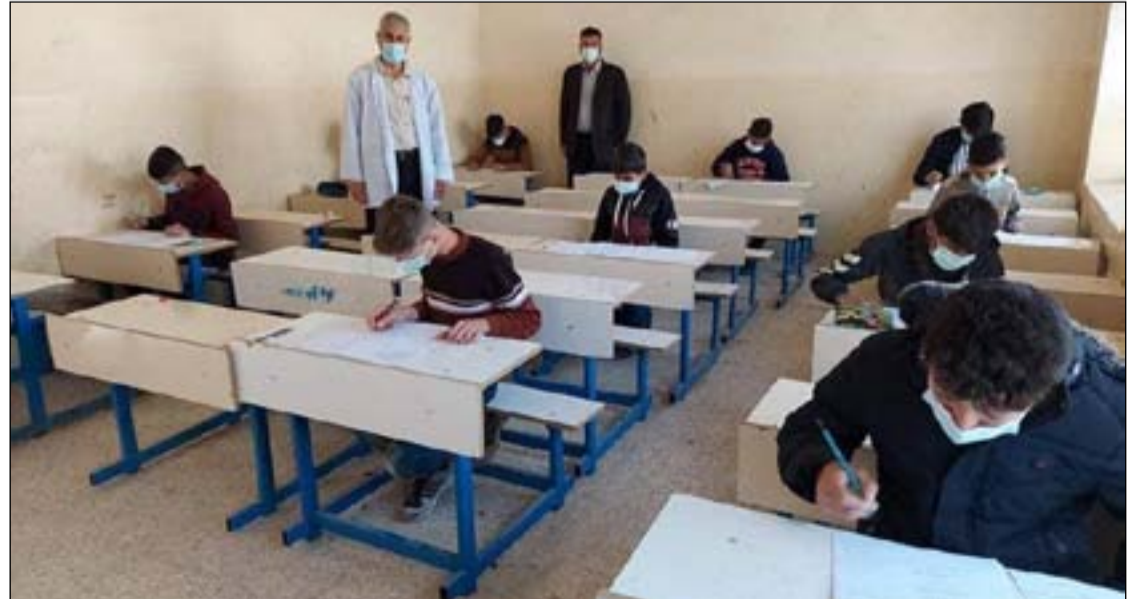
طالبة يؤدون امتحاناتهم مع الالتزام بالاجراءات الوقائية

طالبه يؤدون امتحاناتهم مع الالتزام بالاجراءات الوقائية