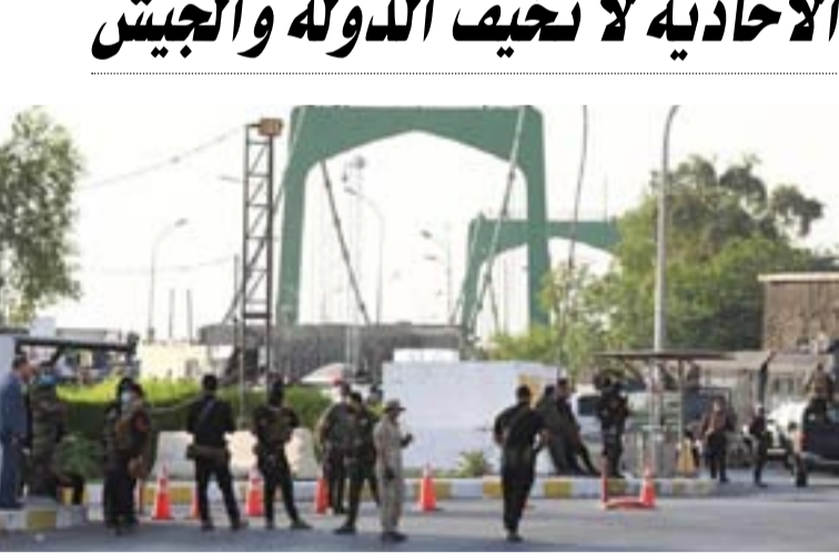
انتشار عناصر الحشد في الخضراء الاسبوع الماضي