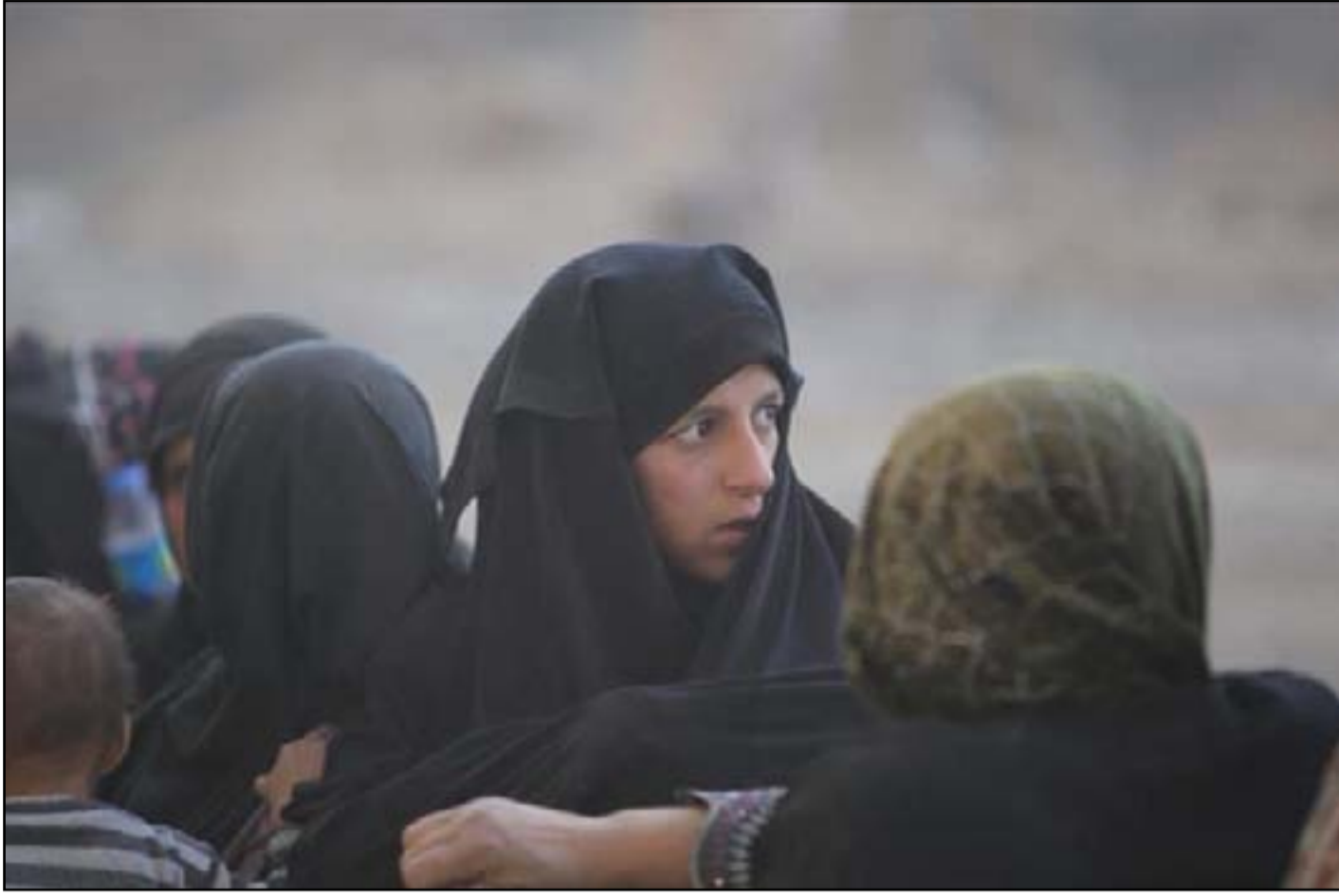
نازحون من عوائل داعش يعودون للعراق