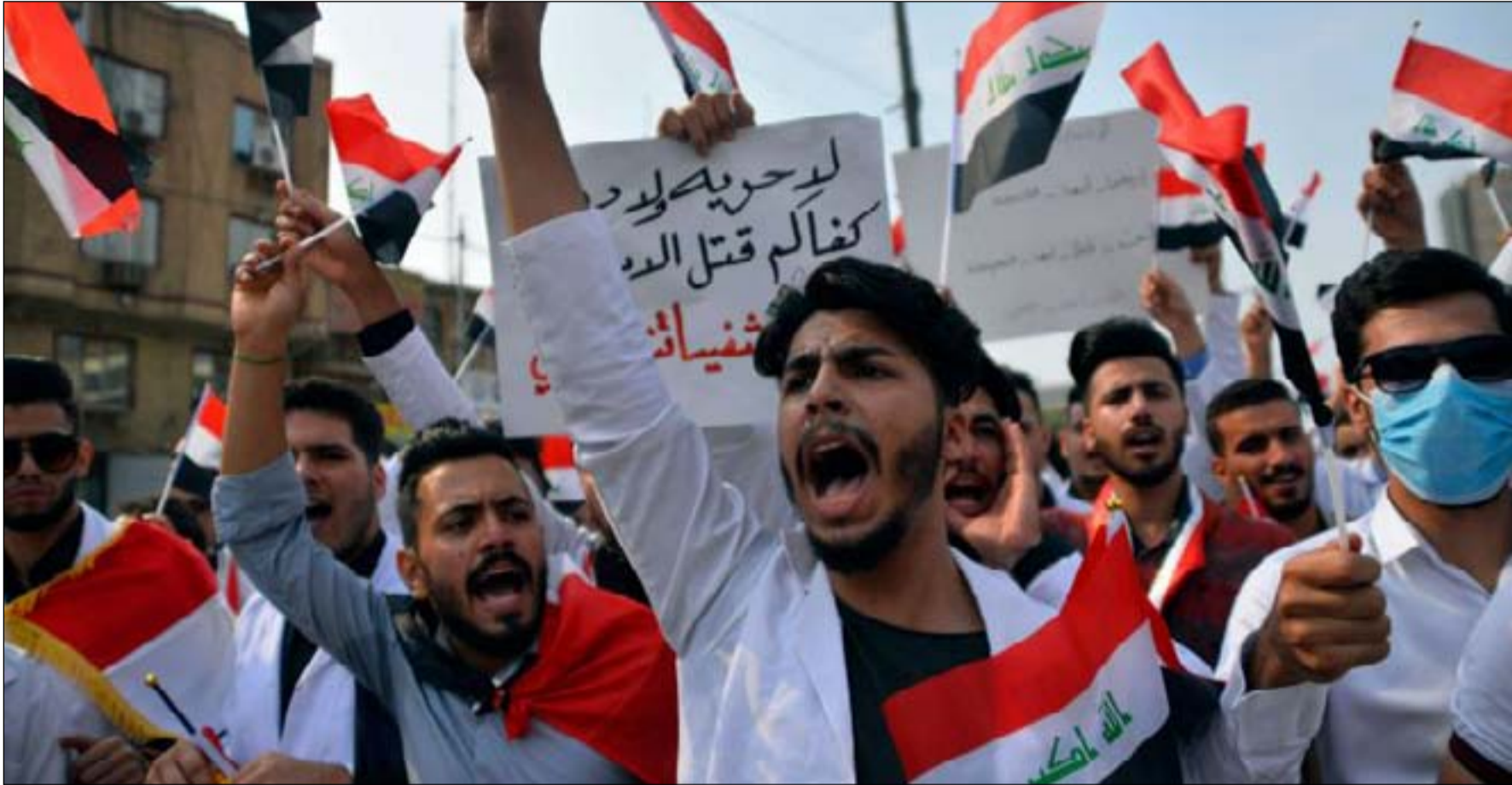
محتجون يطالبون بالكشف عن قلة المتظاهرين... أرشيف

وقالت اللجنة الحكومية، انها استدعت "عوائل الشهداء، وسجلت شهادتهم وإحالتهم للمؤسسات الرسمية كمؤسسة الشهداء وضحايا الإرهاب لتعويضهم وشمولهم ضمن القوانين السارية