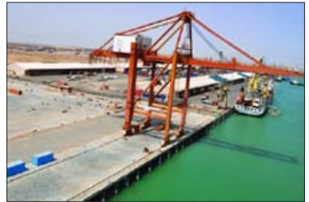
ميناء خور الزبير في البصرة