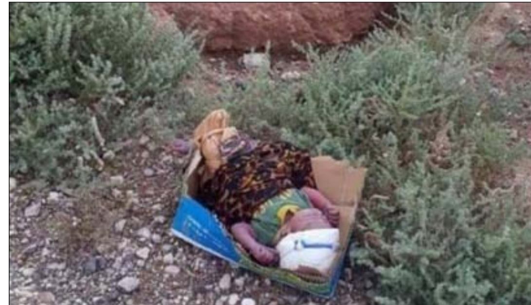
طفل مجهول المصير مرمي في الشوارع