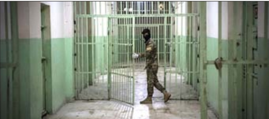
أحد السجون العراقية

وانعدام الظروف الإنسانية للاحتجاز". وأضاف: "وفقاً لدوائر الطب العدلي، ظهر على عدد قليل من الضحايا آثار ضرب مفرط على مناطق الخاصرة والأعضاء التناسلية وأسفل الظهر وكسور في الفقرات العنقية، وحالات وفاة أخرى بفعل ارتفاع ضغط الدم أو تسمم غذائي، وحالات نزيف داخلي لم تحدد أسبابها". وبين السنجرى: إن "السجلات تظهر بأن أكثر من نصف الضحايا من فئة متوسطي العمر بين ٣٥ و٥٠ عاماً، ولا يعانون مسبقاً من أي أمراض مزمنة أو أعراض جانبية"، لافتاً إلى أن "سجني الناصرية (الحوت) والتاجي في بغداد تصدراً أكثر السجون التي شهدت حالات وفاة".