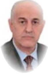
سالم روضان الموسوي

وهذا ما أقره الدستور حينما جعل إدارة السلطة التشريعية تداولية تتبدل عند انتهاء الدورة البرلمانية وتتبدل معها رئاسة الجمهورية وكذلك رئاسة مجلس الوزراء، باستثناء القضاء لخصوصية عمله لأنه يتولى عمل فكري في اجتهاد وتخصص في علم القانون، وهذا يتجلى في عمل المحاكم باستثناء الإدارة التي يجب أن تكون تداولية أيضا لأن تداول السلطة هو نهج العراق الجديد على وفق ما ورد في ديباجة الدستور الناقد التي جاء فيها (وانتهاج سبل التداول السلمي للسلطة) وترجم في نص دستوري في المادة (٦) التي جاء فيها الآتي (يتم تداول السلطة سلميا، عبر الوسائل الديمقراطية المنصوص عليها في هذا الدستور). لذلك فإن هذا التصريح جرس إنذار، لأنه صدر من شخص مطلع على خفايا الأمور التي لا تظهر إلى العلن وتكون محل خفاء عن المواطن، وحينما يبدي بتصريحه فلا بد وأن تكون له أسبابه التي تدعم قوله، وحتى لا يأتي علينا يوم من الأيام ونجد أن الدولة قد اختطفها من اختزلها في شخصه (ولآت حين مناصب)، ويجب علينا أن نفحص جميع القوانين التي تنظم إدارة مؤسسات الدولة المفصلية، ونظورها إما تعديلاً أو بالإلغاء لأن أغلبها قوانين صدرت في ظل نظام شمولى وإنها تعبر عن فلسفة ذلك النظام بترسيخ مبدأ التفرد والشمولية، ولا يكفي الآن نطمئن لأن من يتولى الإدارة من الذين ندرج حجم حرصهم على تطبيق القانون والدستور، لأن المستقبل مجهول قد يأتي أشخاص آخرون يستغلون هذه الثغرة القانونية في جدار الديمقراطية وتعود إلى ديكتاتورية الأشخاص الكليّة تجاه مقدرات الدولة أو جزئياً تجاه مقدرات سلطة من سلطاتها.