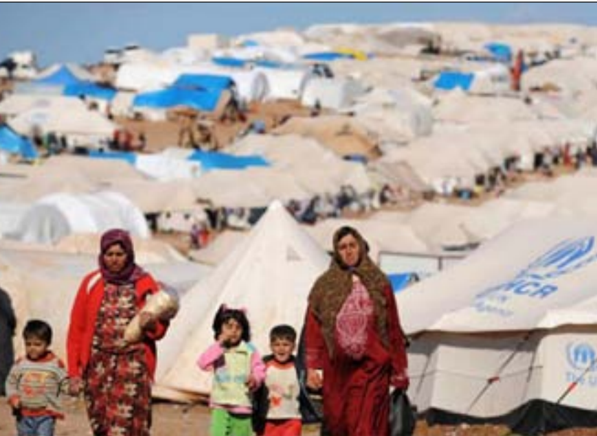
أسر نازحة في مخيم حسن شام... أرشيف

المتحدة لليونسيف ومنظمة الاتحاد الأوروبي للرعاية الإنسانية ECHO. وجاء في تقرير مراجعة الاحتياجيات الإنسانية HNO الخاص بالعراق لعام 2021 ان هناك 1,4 مليون شخص بحاجة لواحدة من الاحتياجيات الإنسانية على الأقل الذين يشكل الأطفال نسبة 44% منهم والنساء 28% منهم. ونكر التقرير ان عدد الأشخاص الذين هم بحاجة ماسة وملحة للمساعدات الإنسانية ارتفع خلال العام 2021 الى 2,4 مليون شخص بعد ان كان حدود 1,8 مليون شخص خلال العام 2020.