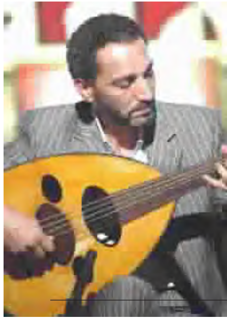
عازف العود العراقي الشهير نصير شمة يقدم احد عروضه في حفل تلفزيوني في مسقط