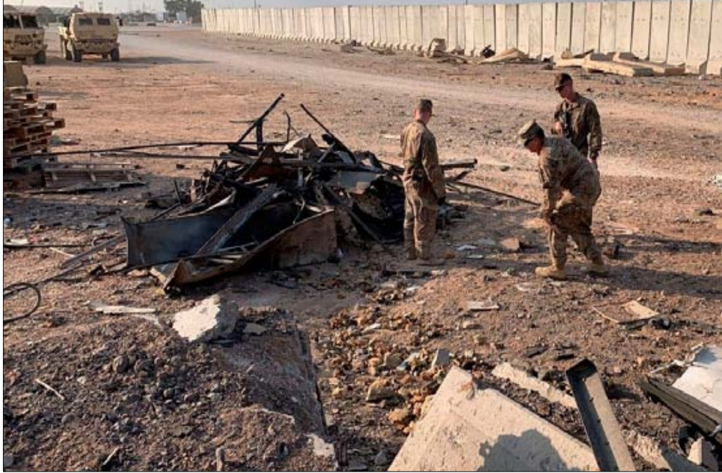
قاعدة عين الأسد في الانبار

للتأثير في مفاوضات انسحاب القوات الأمريكية من العراق