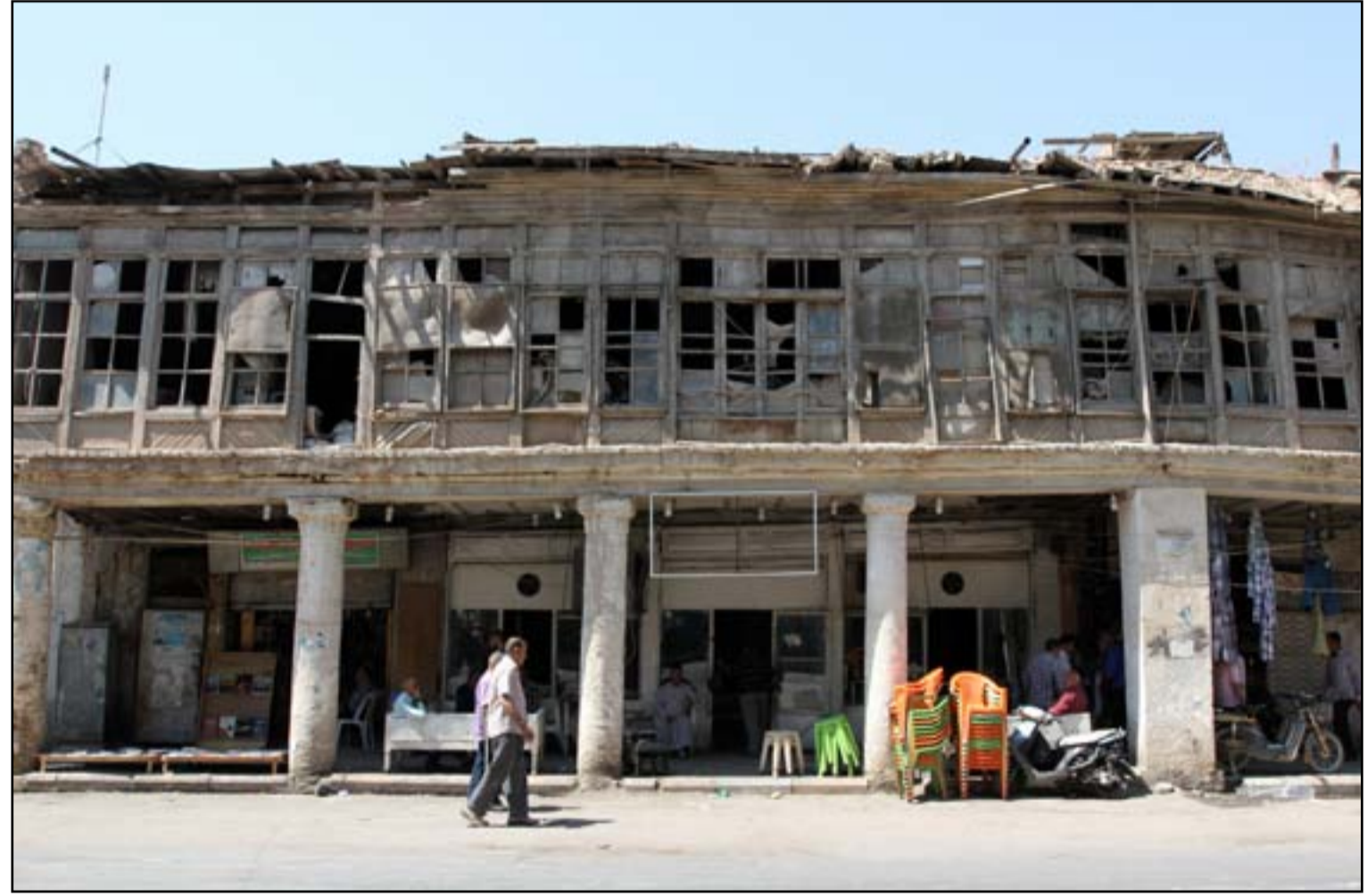
البيوت الأثرية، أعمال صنم اذانه عن كل المطالبات بالاهتمام بها..