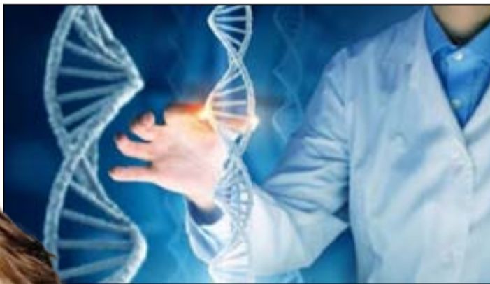
البيانات الطبية لمئات الآلاف من المتطوعين في بريطانيا والولايات المتحدة. وأشار النتائج إلى أن البشر لن يتمكنوا من العيش بعد عمر 150 عاماً، بحسب ما أفادت دورية Nature Communications. إلى ذلك، طوّر العلماء تطبيقاً ذكياً يقوم المستخدم بإدخال بيانات معينة فيه، ما يمكنه من الحصول على نتائج تقديرية لمعدل الشيخوخة البيولوجية والحد الأقصى للعمر بدقة. وتواصل العلماء إلى أن هناك عاملين رئيسيين مسؤولين عن عمر الإنسان، يغطي كلاهما عوامل نمط الحياة وكيفية

والمرضى، أما الثاني فهو المرونة، ما يعكس مدى سرعة استعادة العامل الأول إلى طبيعته. ويمكن فريق العلماء من التوصل إلى أن أطول مدة من المحتمل أن يعيشها أي إنسان هي 150 عاماً، أي ضعف متوسط العمر الافتراضي الحالي في عدد من بلدان العالم الأول البالغ 81 عاماً. ويعتقد فريق العلماء أن خلايا الشبكية في العين تتجدد في حد أقصى للعمر ما لم يتم تطوير علاجات حقيقية مضادة للشيخوخة.