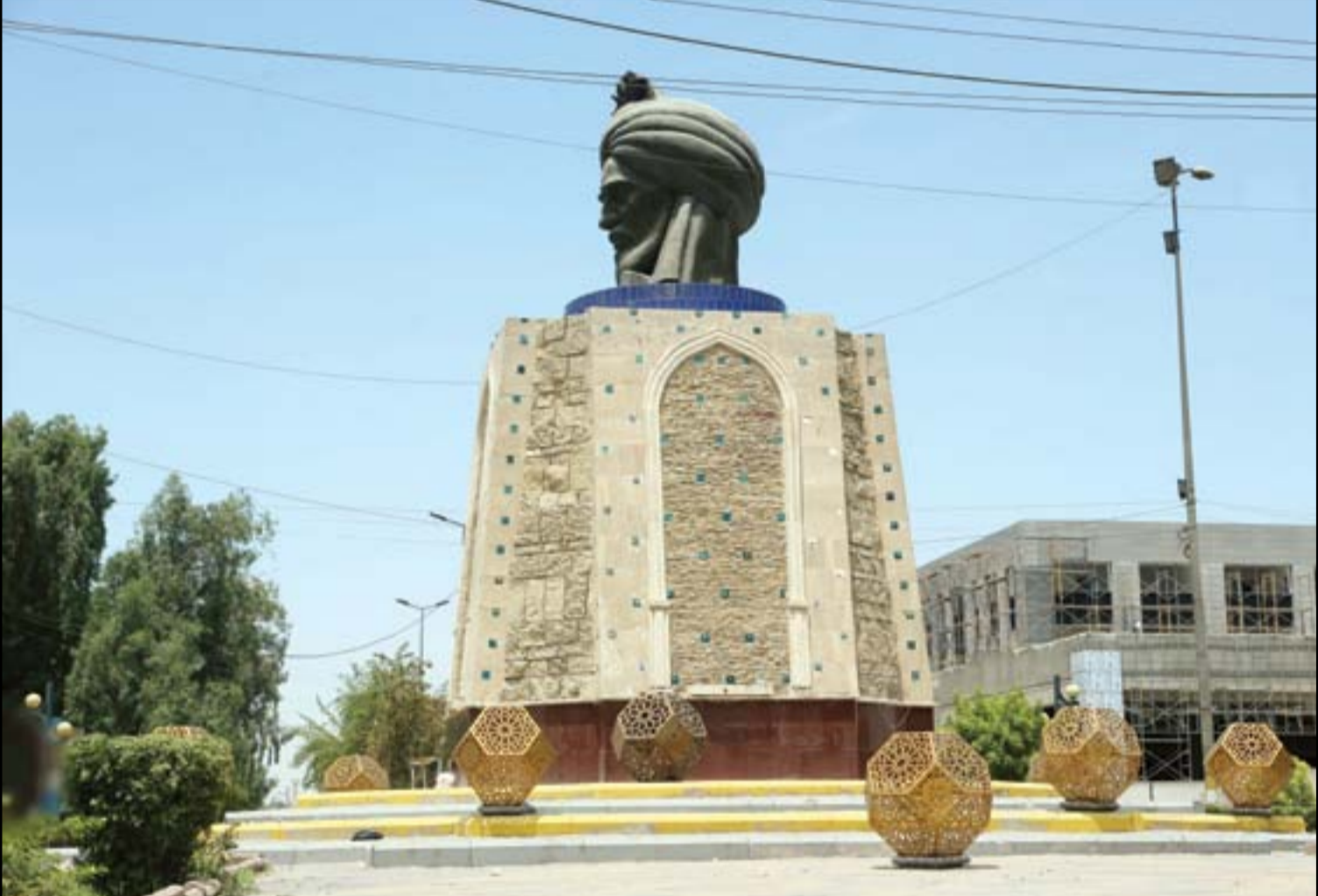
تمثال ابو جعفر المنصور في بغداد .. هل يسلم من ايدي العابثين؟ ... عدسة: محمود رؤوف

منذ ايام نفذ قوات مشتركة من "البيمشركة" وجهاز مكافحة الارهاب عمليات عسكرية في شمال بغداد وصفت بالأوسع والاولى من نوعها منذ نحو 4 سنوات، وهي حصيلة التفاهات الاخيرة بين الطرفين. ومن المفترض ان تمتد هذه العمليات الى مساحات تصل الى أكثر من 1000 كم في الاراضي