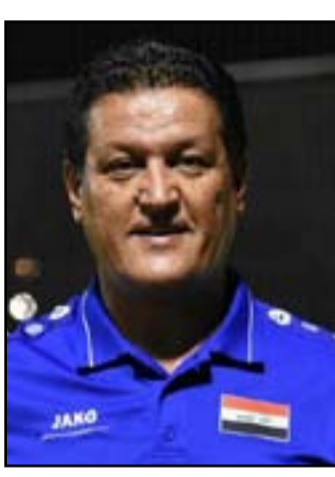
□ بغداد / إياد الصالحى

وعلق كاظم بخصوص مصير حراس المرمى المتميّزين مع فرق المؤخرة في الدوري، بقوله : "لدي تصور شامل عن كل حراس الفرق التي احتلت مراكز متأخرة هذا الموسم، هؤلاء ضحية نتائج فرقهم وليس بالضرورة أنهم يتحمّلون الهزائم المريرة التي تعرّضوا لها، بل بعضهم لم