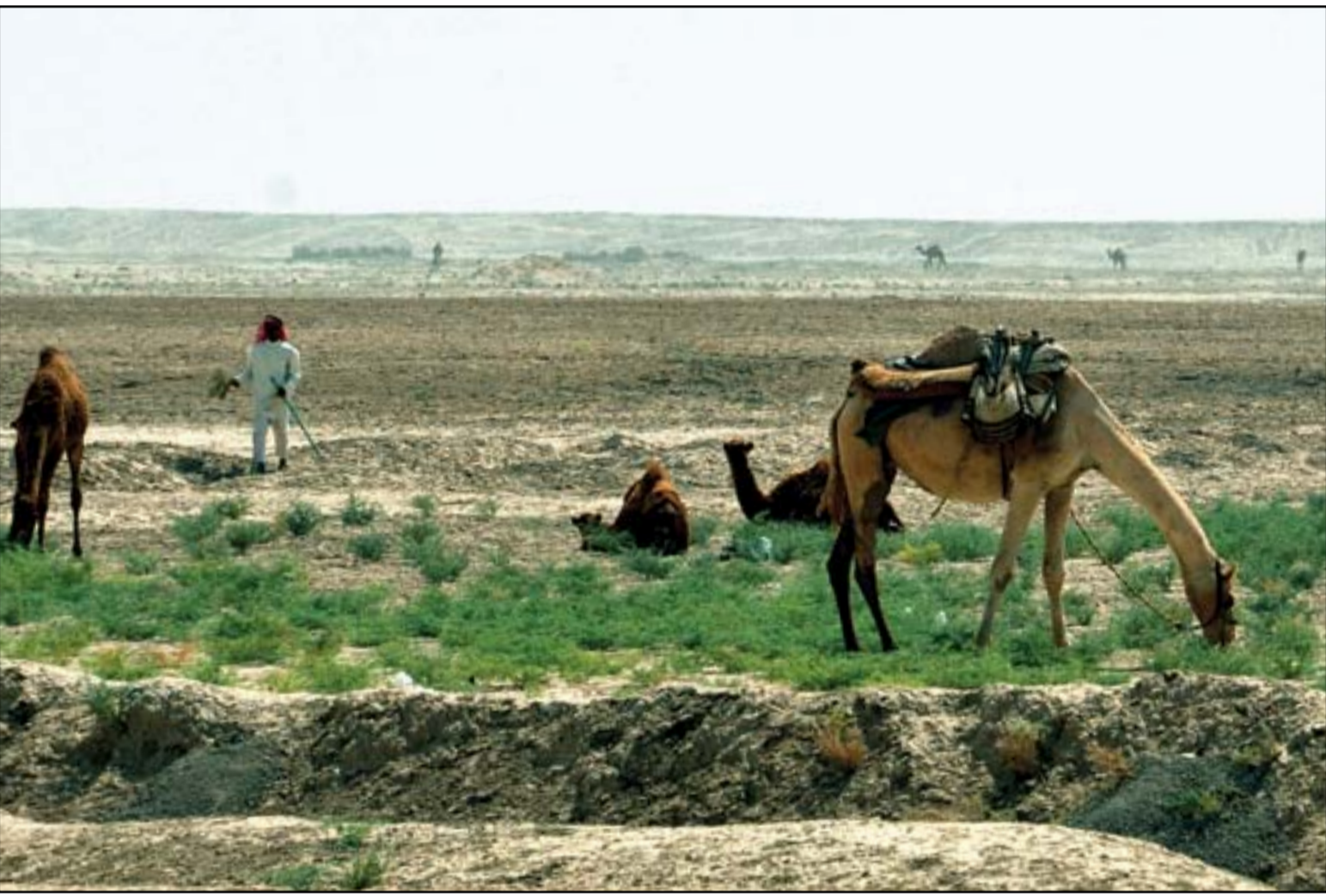
بادية السماوة.. الحياة على طبيعتها.. عدسة محمود رؤوف

■ ذي قار/ حسين العامل دعا ناشطون في مجال التظاهرات وحقوق الانسان الى تشكيل لجنة اممية للتحقيق في جرائم قتل المتظاهرين، مشيرين الى ان تقرير بعثة الامم المتحدة حول تطورات التظاهرات في العراق اغفل الكثير من الحقائق ولم يسم الجهات المتورطة بالقتل بأسمائها ووصفها بـ "عناصر مسلحة مجهولة الهوية". واصدرت بعثة الامم المتحدة لمساعدة العراق (يونامي) مؤخرا تقريرا حول تطورات التظاهرات في العراق: تحت عنوان (المساءلة