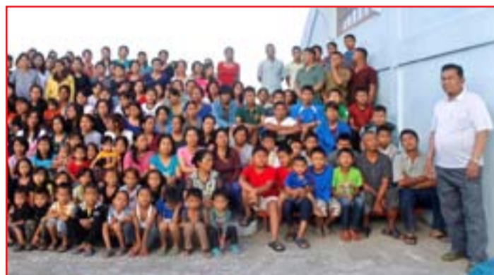
منهم يعملون في نحت الأثاث الخشبي وتصنعون أدوات فخارية. وتزوج من زوجته ١٩٤٥ وولدت تسنانا عام ١٩٤٥ وتزوج من زوجته

توفي زيونا حانا، رئيس طائفة هندية تسمح بتعدد الزوجات، ويُعتقد أنه رب الأسرة الأكبر في العالم عن عمر يناهز ٧٦ عاماً بعد إصابته بالمرض، تاركا وراءه ٣٨ زوجة و٨٩ طفلاً و٣٣ حفيداً - جميعهم يعيشون معاً في منزل مكون من ١٠٠ غرفة بأربعة طوابق في قرية باكتوانج تالانجونام. وأصبح زيونا وقريته من المعالم السياحية الرئيسية في ولاية إيزاول بسبب الأسر، وكان تسنانا يعاني من ارتفاع ضغط الدم ومرضى السكري قبل وفاته في ١٣ حزيران/يونيو، وفقاً لصحيفة "ديلي ميل" البريطانية. أصيب زيونا بالمرض لأول مرة في ٧ حزيران عندما أصبح غير قادر على تناول الطعام، وفقد الوعي في ١١ حزيران، تم نقله إلى المستشفى، حيث أعلن عن وفاته لدى وصوله. من الصعب تحديد الحجم الدقيق لعائلة تسنانا، حيث تشير بعض التقارير إلى أن الأب لديه ٩٤ طفلاً و٣٩ زوجة و٣٣ حفيداً، وكان زعيماً لطائفة شكلها جده في الثلاثينيات. تضم الطائفة حوالي ١٧٠٠ فرد من بينهم أربعة أجيال من عائلة تسنانا، وكثير