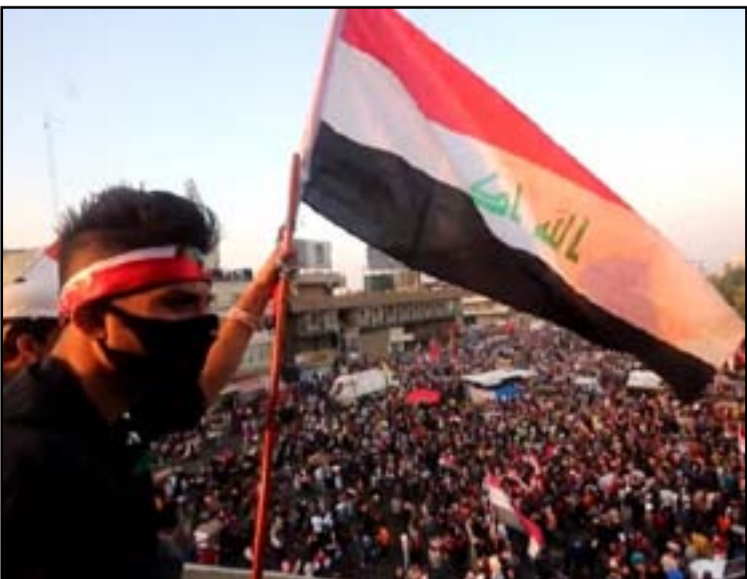
الناشطون يقولون ان تقرير يونامي يخلو من تغطية انتهاكات كبيرة تعرض للمتظاهرون

وتقدر حصيلة ضحايا التظاهرات العراقية بما يقرب من ٧٠٠ شهيد وأكثر من ٢٥ الف مصاب الكثير منهم تعرض لإصابات تسببت بإعاقة جسدية فيما لا يزال مصير عشرات المختطفين والمهيئين من ناشطي التظاهرات مجهولاً.