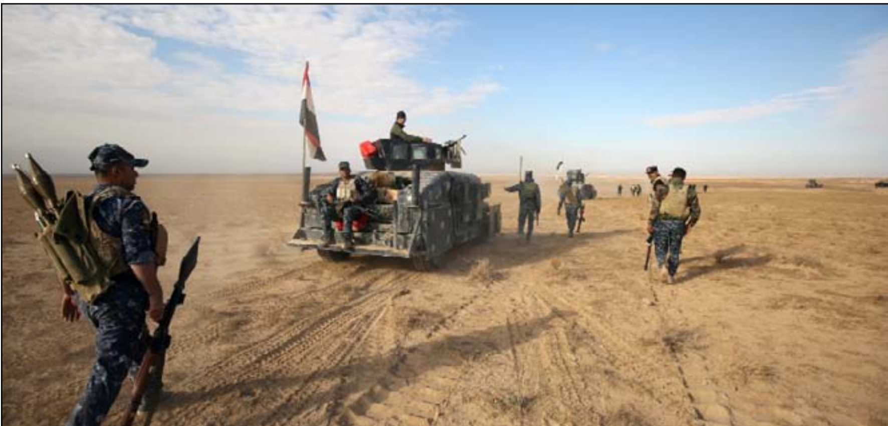
الساحات الشاسعة بحاجة إلى عدد قوات كبير لمسك الأرض