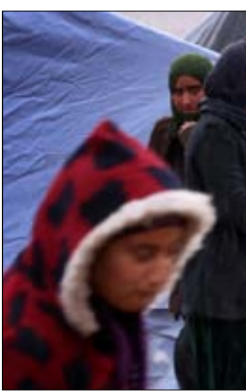
مخيم نازحون ايزيديون

اوروية كأعضاء في مجلس الامن يمكن ان يلعبوا دورا مهما جدا في تسليط الضوء على معاناة المجتمع ايزيدي والعمل مع حكومة إقليم كردستان والحكومة المركزية لنقل وتوفير مزيد من الدعم الدولي لهم. في العاشر من شهر أيار الماضي أشار المدعي العام للمحكمة الجنائية الدولية ورئيس فريق تحقيق الأمم المتحدة بجرانم داعش، كريم خان، بان هناك أدلة مقنعة على ان الجرائم التي ارتكبت بحق ايزيديين تشكل جريمة إبادة جماعية.