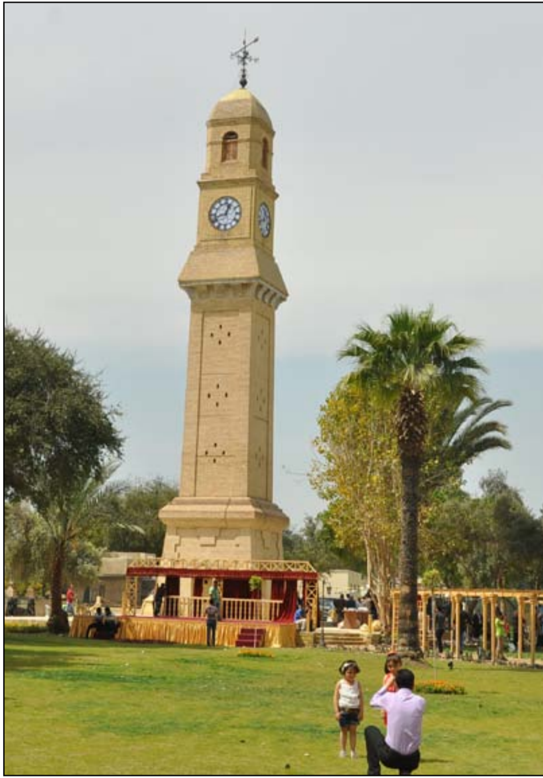
بعد اغلاقها لكتر من عام .. القشلة تفتح ابوابها امام الزوار..

وفي سياق متصل، أفادت لجنة الصحة النيابية بأن الزيادة في أعداد الإصابات في الأيام الأخيرة تعود إلى دخول العراق في الموجة الثالثة لجائحة كورونا؛ بسبب المتغير "دلتا" الجديد، لافتة الى أن هذا المتغير سيحصد ضعف عدد الوفيات التي حصدها المتغيرات التي سبقته، ولا يمكن إيقافه إلا بجرعتي لقاح.